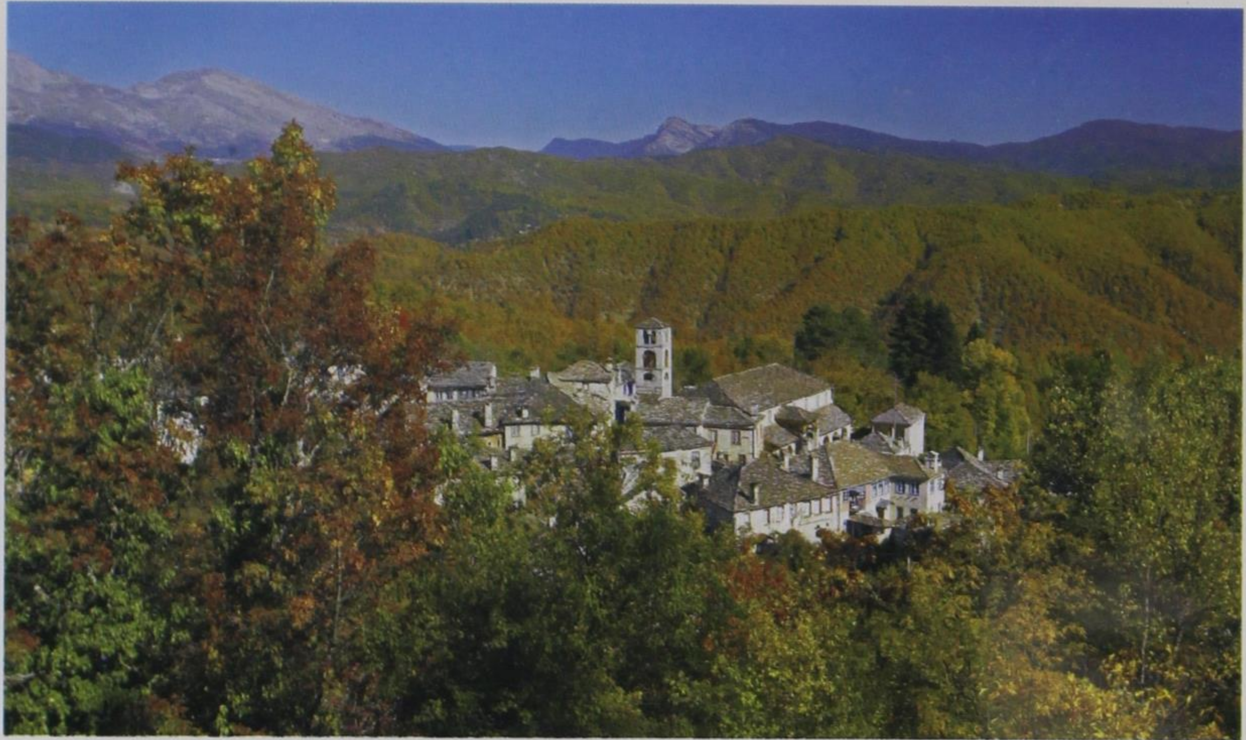
3. Ορεινός οικισμός