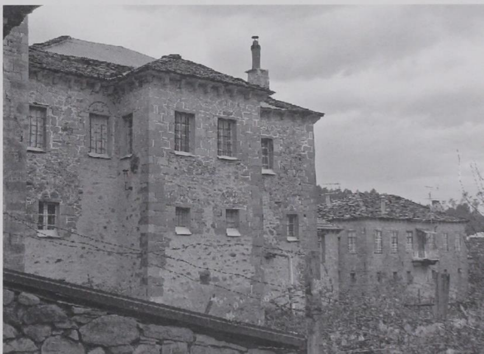
4. Πετρόκτιστα σπίτια χωριού

Μια πληθώρα χωριών που χαρακτηρίζονται παραγωγικά από τον συνδυασμό της γεωργίας με την κτηνοτροφία μικρής κλίμακας και καταλαμβάνουν τη χαμηλότερη ορεινή ζώνη (ζώνη της δρυός) απαντούν στη δημογραφική και οικονομική στενότητα κυρίως με τη στρόφη στις τεχνικές εξειδικεύσεις. Ένα μεγάλο μέρος του ανδρικού πληθυσμού στρέφεται στην άσκηση μιας τεχνικής δραστηριότητας, με αποτέλεσμα συγκεκριμένα χωριά ή συστάδες χωριών να γίνουν γνωστά στη νεότερη ιστορία από αυτή την ειδίκευση. Η εξειδίκευση βεβαίως συνδέεται και με την έξοδο, αφού η άσκηση των συγκεκριμένων τεχνικών επαγγελμάτων σημαίνει την περιοδική μετακίνηση σε μια μεγάλη γεωγραφική κλίμακα.