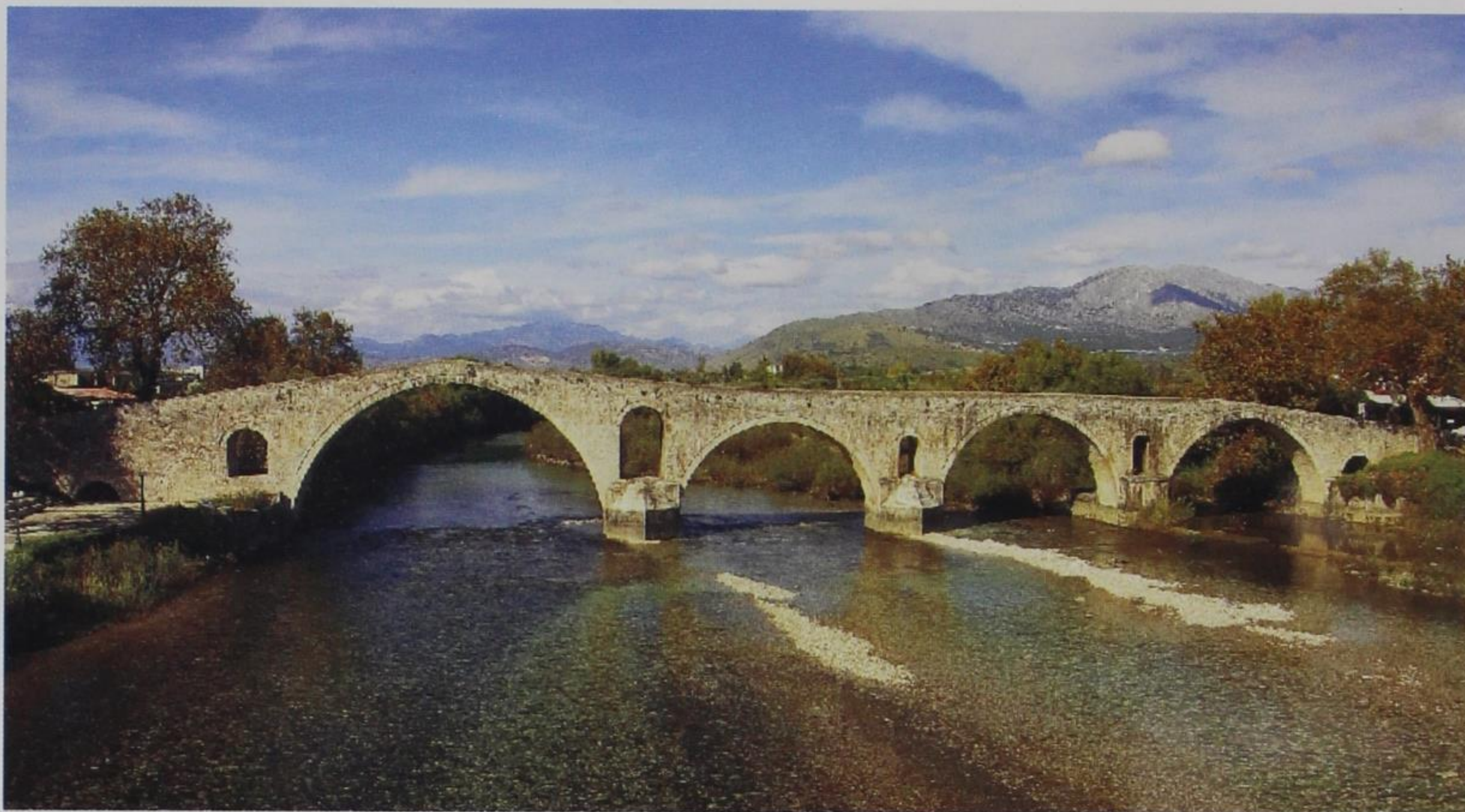
8. Το γεφύρι της Άγρας

τα νέα στρώματα του πληθυσμού της. Παράλληλα αναπτύσσονται ημιαστικά κέντρα όπως το Καναλάκι, ο Λούρος και πιο πέρα η Φιλιπιάδα, τα οποία συγκρατούν ένα μέρος του πληθυσμού της ενδοχώρας από τη μια και από την άλλη, καθώς αναπτύσσονται κατά μήκος κεντρικών οδικών αξόνων, συμβάλλουν στο μετασχηματισμό και του αγροτικού τοπίου της ευρύτερης περιοχής 6 .