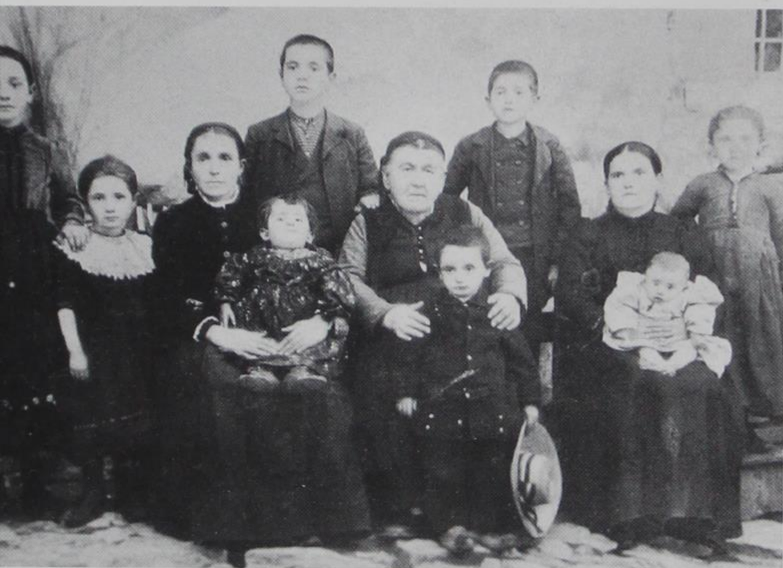
5. Οικογένεια του παρελθόντος

Μια άλλη κατηγορία χωριών, συνδυάζοντας τη μεταποίηση των προϊόντων που παράγουν με τις μεταφορές, εισέρχονται σταδιακά στη σφαίρα του εμπορίου, που κι αυτό συνεπάγεται ταξίδι και δικτύωση με τα μεγάλα εμπορικά κέντρα της Ευρώπης και της οθωμανικής αυτοκρατορίας. Πρόκειται για τις πλέον ορεινές κοινότητες της μεγάλης και μετακινούμενης κτηνοτροφίας, κατά κύριο λόγο Βλάχικες, που σημειώνουν τέτοια ακμή, ώστε να θεωρούνται «δακτυλοδεικτούμενες». Στο εμπόριο επίσης εξειδικεύεται, παράλληλα με τα γράμματα, και ένα μεγάλο μέρος του ανδρικού πληθυσμού του Ζαγορίου, γεγονός που οδήγησε και αυτή την περιοχή σε μια αξιοσημείωτη οικονομική απογείωση και πολιτισμική άνθιση.