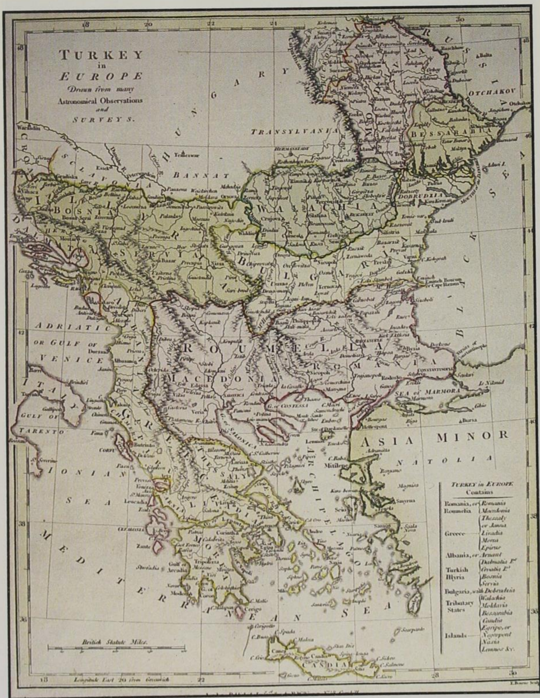
Χάρτης που παρουσιάζει τις ευρωπαϊκές περιοχές της Οθωμανικής Αυτοκρατορίας διαχωρισμένες κατά εθνότητα, 1.800 μ.Χ.