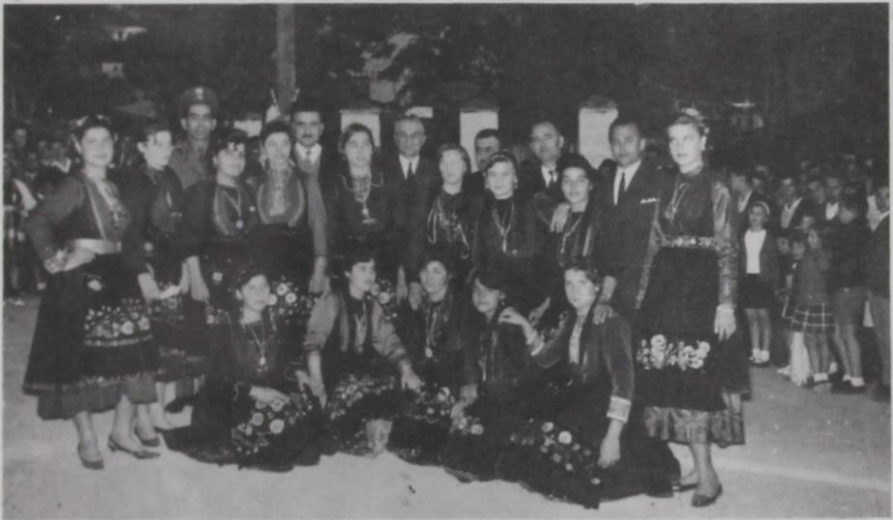
Κοπέλες της Κόνιτσας με εθνικές στολές 28/10/1965.