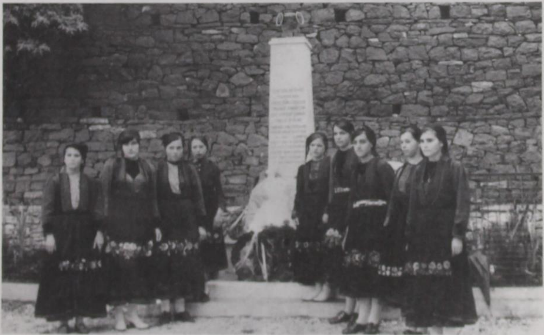
Κοπέλες από την Πυρσόγιαννη της Κόνιτσας με τις τοπικές στολές των 1972.