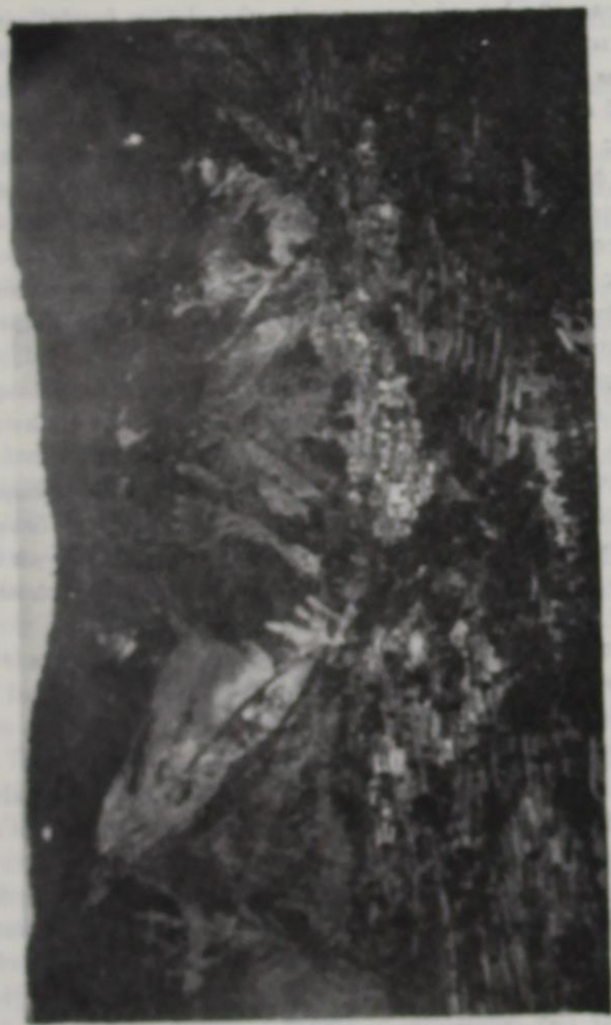
Ἡ Κοστάνιανη, κτισμένη στους πρόποδες τῆς Γόρτισης μέσα σὲ πλούσιη βλάστηση.