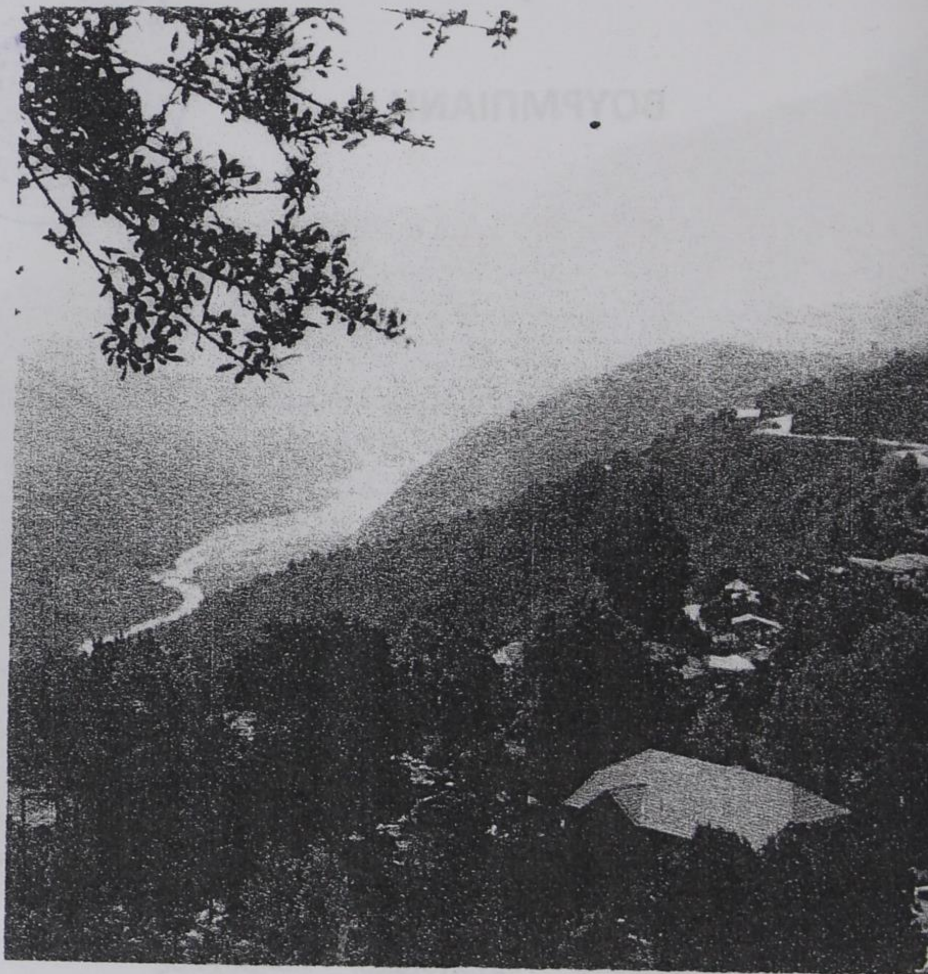
Ένα κομμάτι της Βούρμπιανης και το Βουρμπιανίτικο ποτάμι