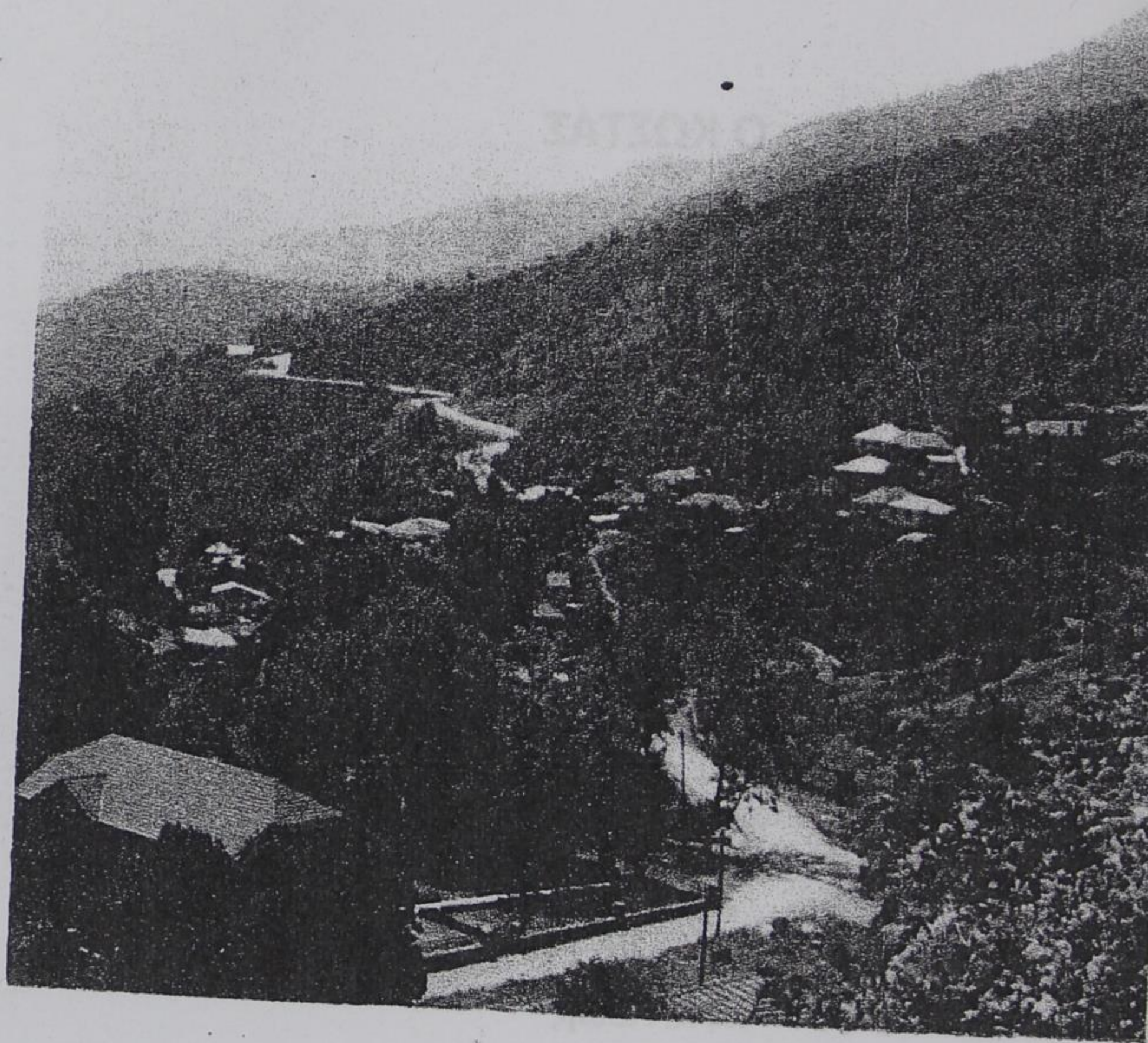
Βούρμπιανη όπως φαίνεται από το απέναντι χωριό Οξειά