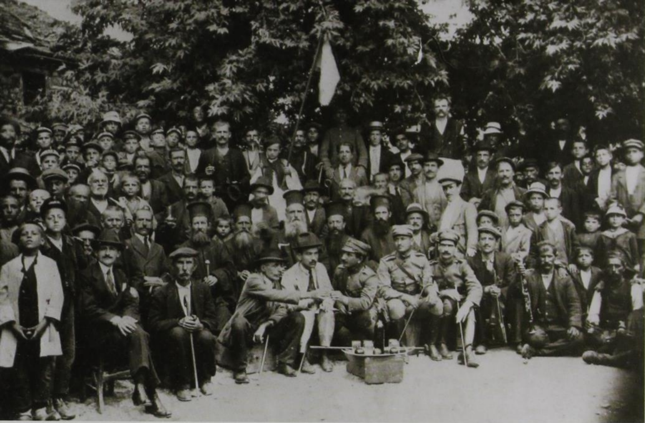
1921 Εορταστική εκδήλωση στην πλατεία της Βούρμπιανης.

σίον τῆς Πυξαριάς, καί ἡ Σέστουρη, ἐπάνω ἀπό τόν Ἰσβορο (σημ. Ἀμάραντος) καταστράφηκαν ἀπό ἐπιδρομεῖς γύρω στό 1700, ὅπως καί ἡ Φετόκο (σημ. Θεοτόκος) μέ τό παζαρόπουλό της· ἐπίσης καταστράφηκαν τό Ἐλευθεροχώρι Λαγκάδας ἀπό ληστές, κάποιο χωριό κοντά στό Ἀσημοχώρι, τά Παλιοχώρια τῆς Στράτσιανης (σημ. Πύργος) καί τῆς Ζέρμας (σημ. Πλαγιά). Ἐπί πλέον ἡ παράδοση ἀναφέρεται σέ περιπτώσεις συνένωσης οἰκισμῶν καί αὐτονόμησης μαχαλάδων. Ἡ Πυρσόγιαννη, κατά τήν παράδοση, προῆλθε ἀπό τήν συνένωση τριῶν οἰκισμῶν περί τό 1600. Καί μετά τήν Ἑλληνική Ἐπανάσταση, ὅμως, ἄρχισαν νά ἐγκαταλείπονται οἰκισμοί πού βρισκόταν σέ δρόμους ἢ περάσματα. Ὑποστηρίζεται ὅτι τότε ἐγκαταλείφθηκαν πολλοί μικροί οἰκισμοί κατά μήκος τοῦ Σαραντάπορου (ἐπαρχία