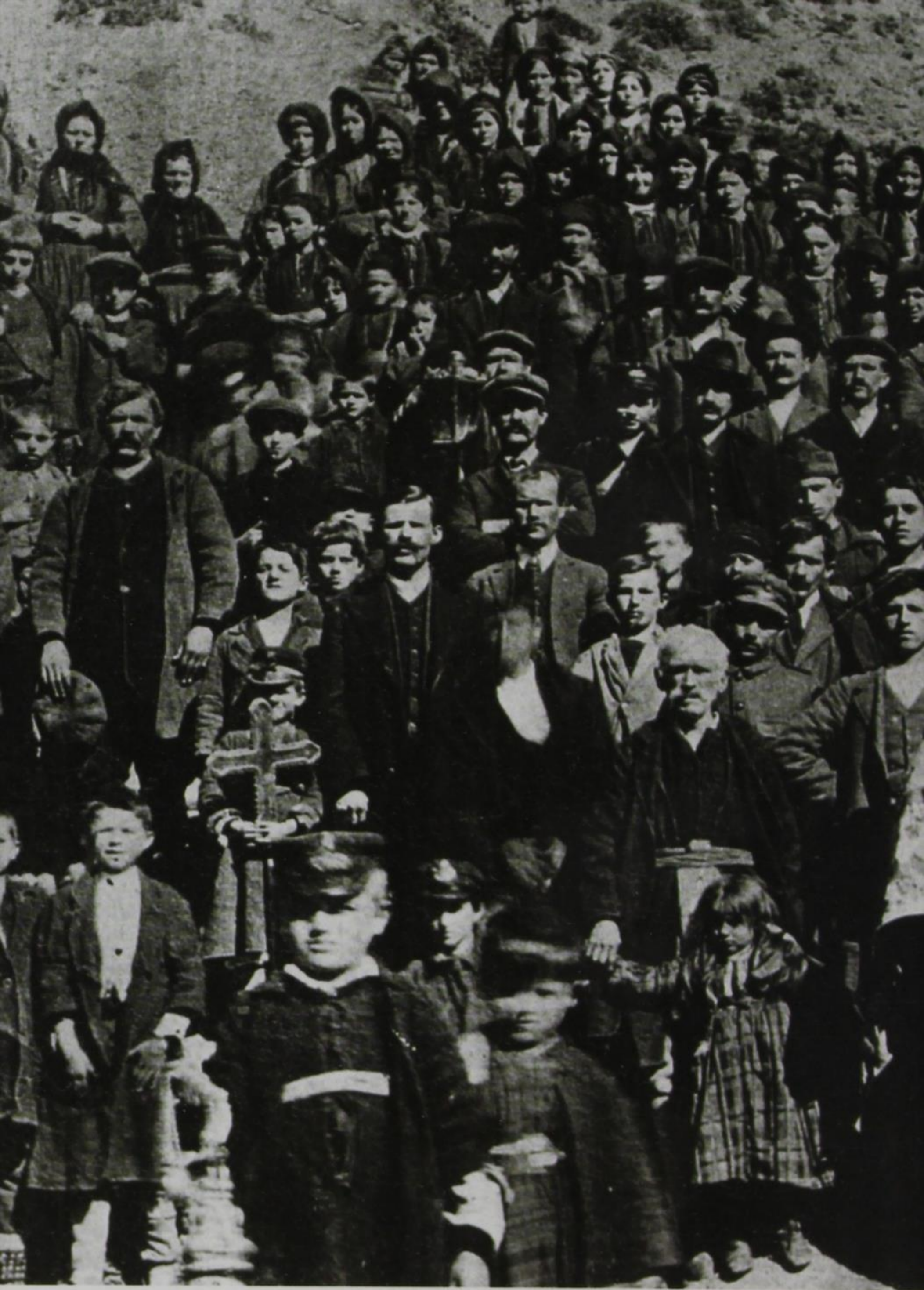
Λιτάνευση της εικόνας Παναγίας της Πληκαδίτισσας, Πληκάτι 1916.