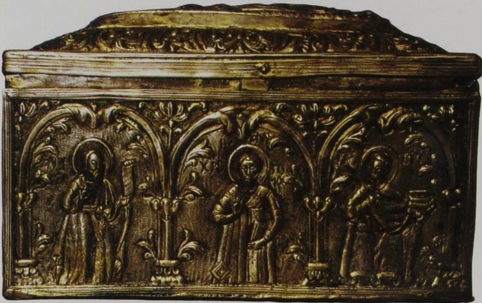
Λειψανοθήκη της Μονής Ζέρμας. Δεύτερο μισό 18ου αιώνα.

Κόνιτσας είναι ελάχιστες ή άοριστες: Πιθανότατα ιδρύθηκαν δύο μικρές μονές κατά τά έτη 1326-8 στην Μόλιστα και στή Σέλτση (Οξυά). Οί ακόλουθες μονές, οί περισσότερες από τις όποιες έχουν αφανισθει πλέον, ιδρύθηκαν ίσως από τόν 15ο μέχρι και τόν 18ο αιώνα: στήν Βούρμπιανη 4 μονές, στήν Σταρίτσανη (σημ. Πουρνιά) μονή του Άγίου Σάββα, στήν Στράτσιανη (σημ. Πύργος) αρχικά μονή του Άγίου Συμεών και έπειτα της Άγίας Τριάδος, στήν Καστάνιανη μονή της Μεταμορφώσεως του Σωτήρος, στό Κεράσοβο (σημ. Άγία Παρασκευή) μονή του Άγίου Ιωάννου του Προδρόμου, στό Παλιοσέλι μονή του Άγίου Γεωργίου, στίς Πάδες και στά Άρματα μονές Άγίας Παρασκευής, στήν Άετομηλίτσα, στόν Γοργοπόταμο και στήν Λαγκάδα άλλες μονές.”