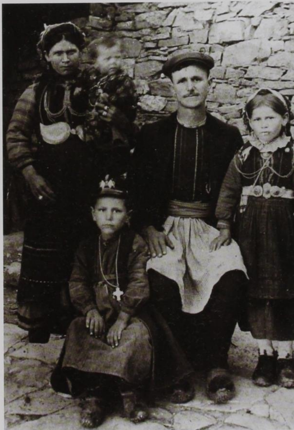
Τυπική ενδυμασία ανδρών και γυναικών από τὰ Μαστοροχώρια (Πρώτο τέταρτο του 20ου αιώνα).

θηκαν σημαντικά τόν 14ο αιώνα και κατά τήν περίοδο 1750-1850.