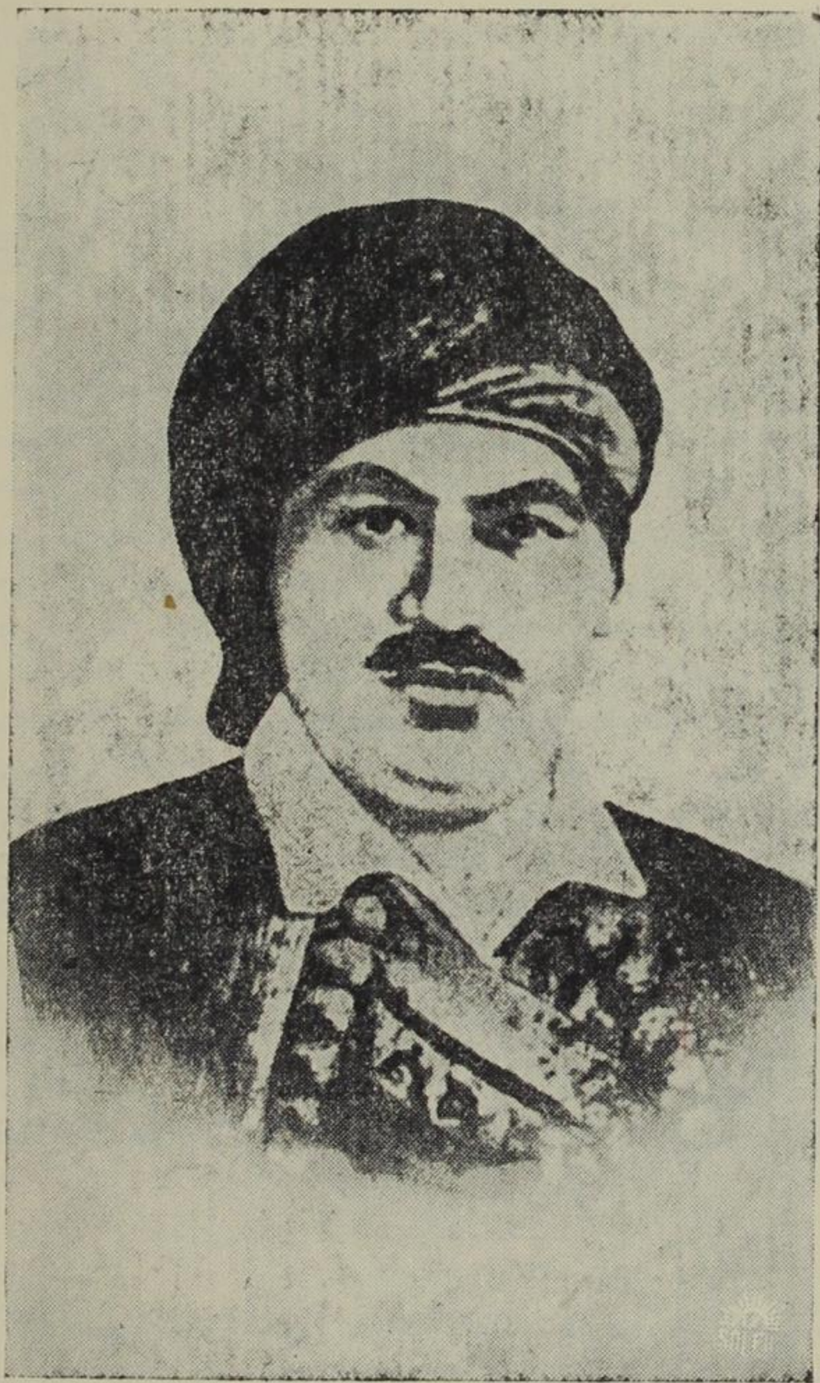
Ο ΘΡΥΛΙΚΟΣ ΗΡΩΣ ΧΑΤΖΗΜΙΧΑΛΗΣ ΝΤΑΛΙΑΝΗΣ (Μιχαήλ Χρήστου έκ Δελβινακίου τῆς Ἡπείρου)