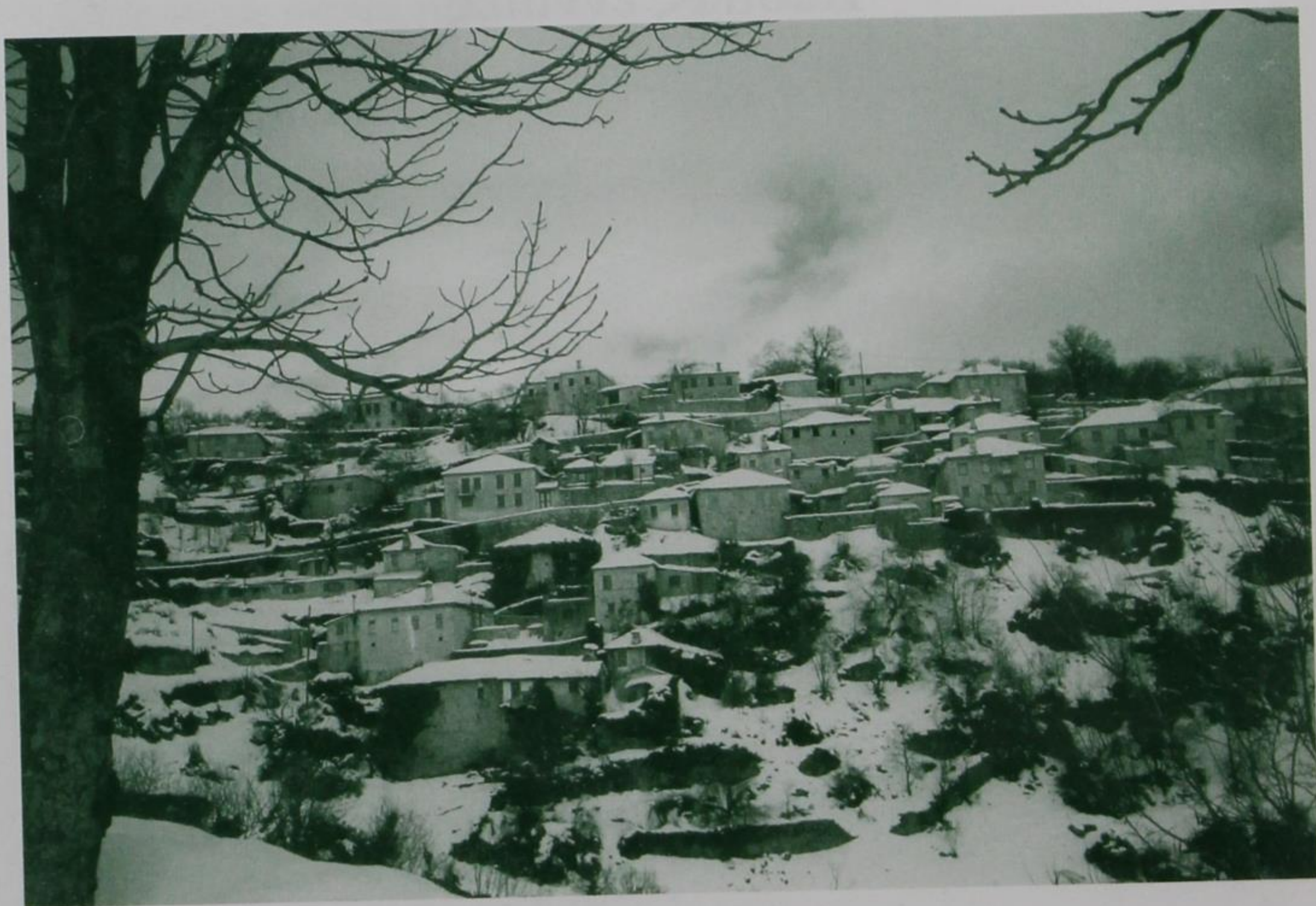
Άποψη της Βίτσας Ζαγορίου