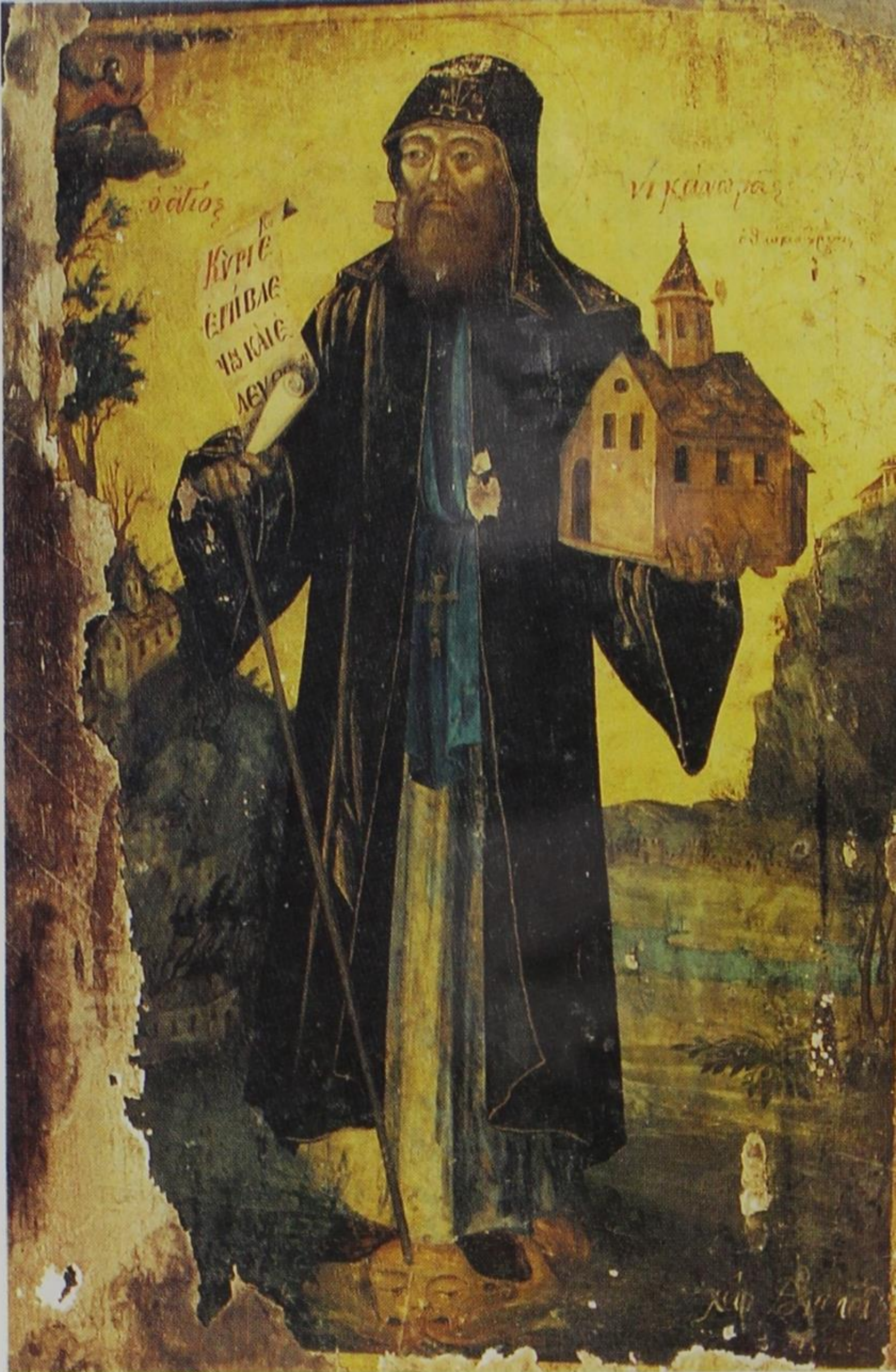
Φορητή εικόνα τοῦ ὁσίου Νικάνορος