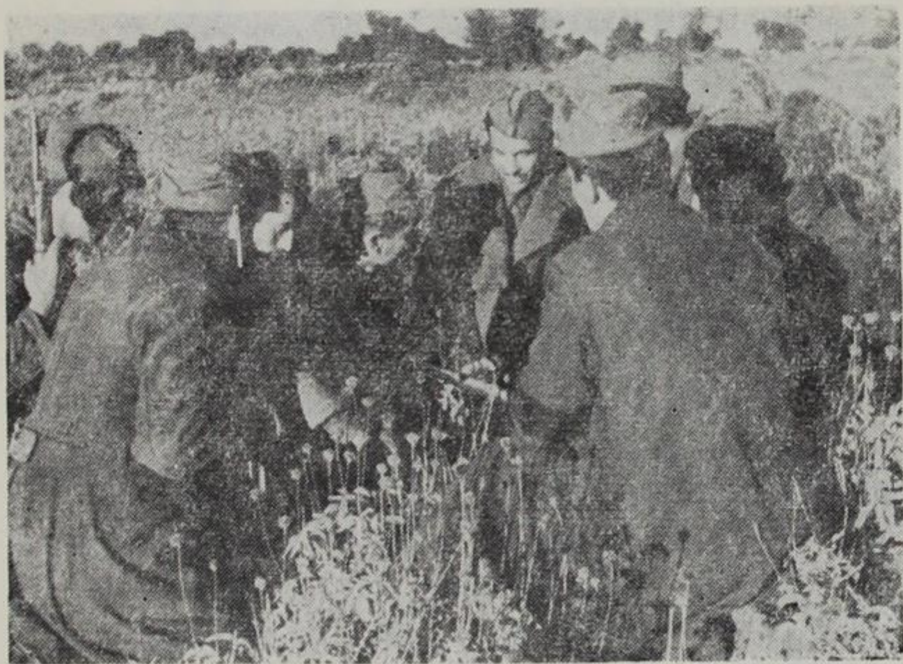
Ομάδα στελεχών του 85 Συν)τος μελετά σχέδιο επίθεσης κατά των χιτλερικών