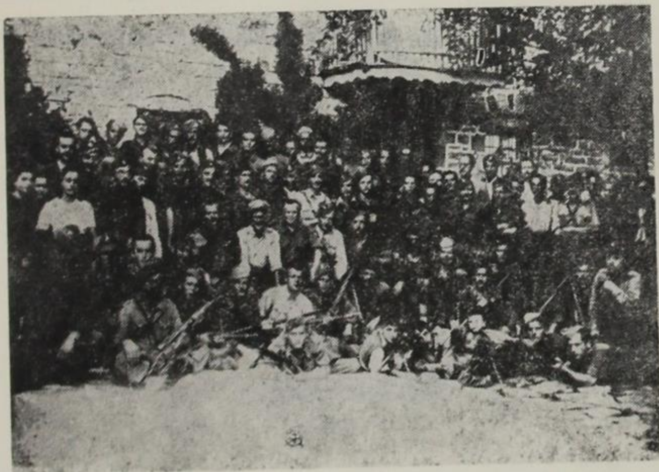
Σκαμνέλι. Το Επιτελείο του 85 Συντάγματος του ΕΛΑΣ. Άνοιξη 1944