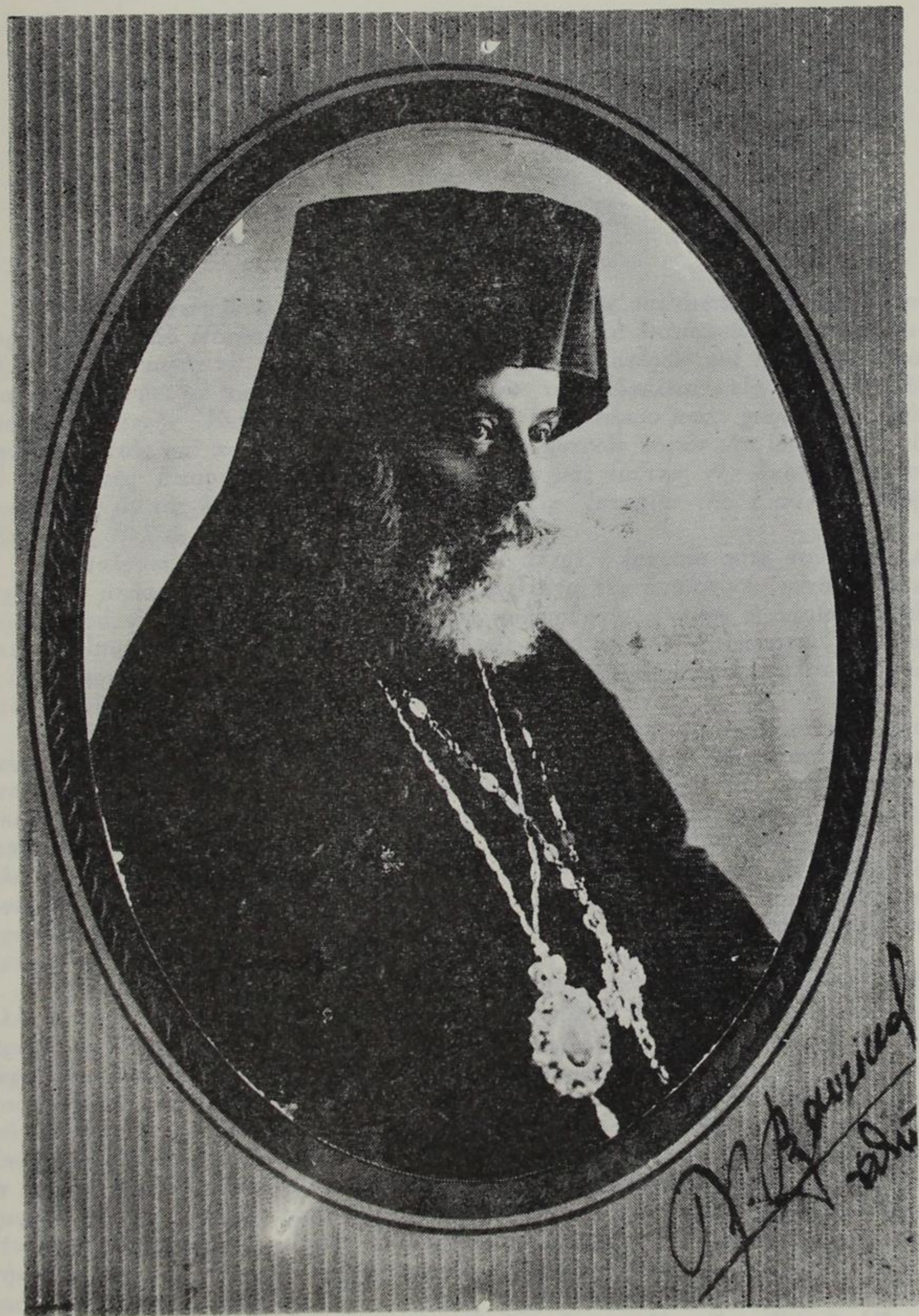
ΙΩΑΝΝΗΣ ΒΑΣΙΛΙΚΟΣ Μητροπολίτης Βελλᾶς και Κονίτσης 1926 — 1936