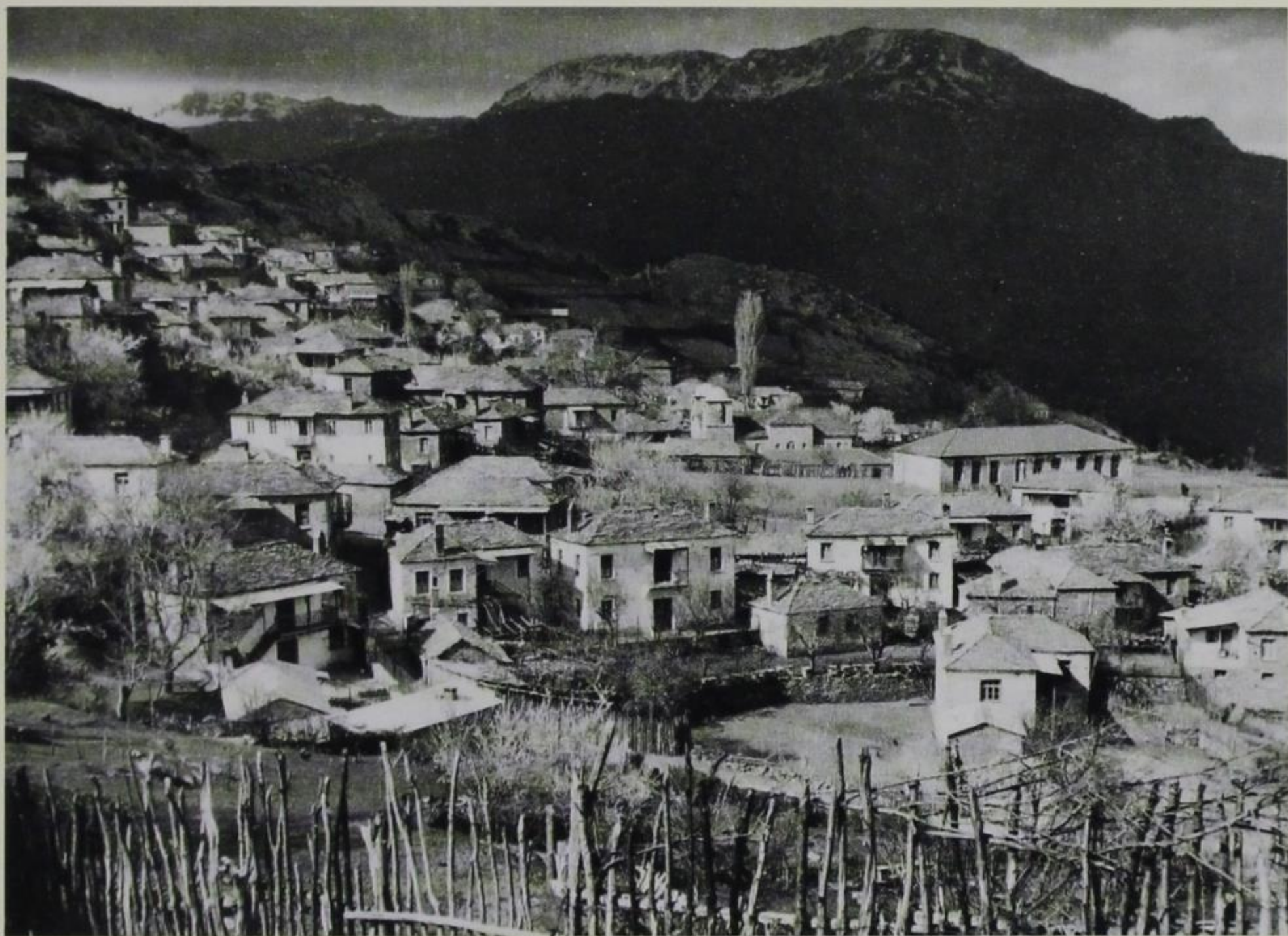
Επάνω: Άποψη του χωριού μας από τα νοτιοδυτικά (απ' τς Μουκάδεις) με τις επιβλητικές Αρένες στο βάθος. Ασπρόμαυρη φωτογραφία της δεκαετίας του '70.