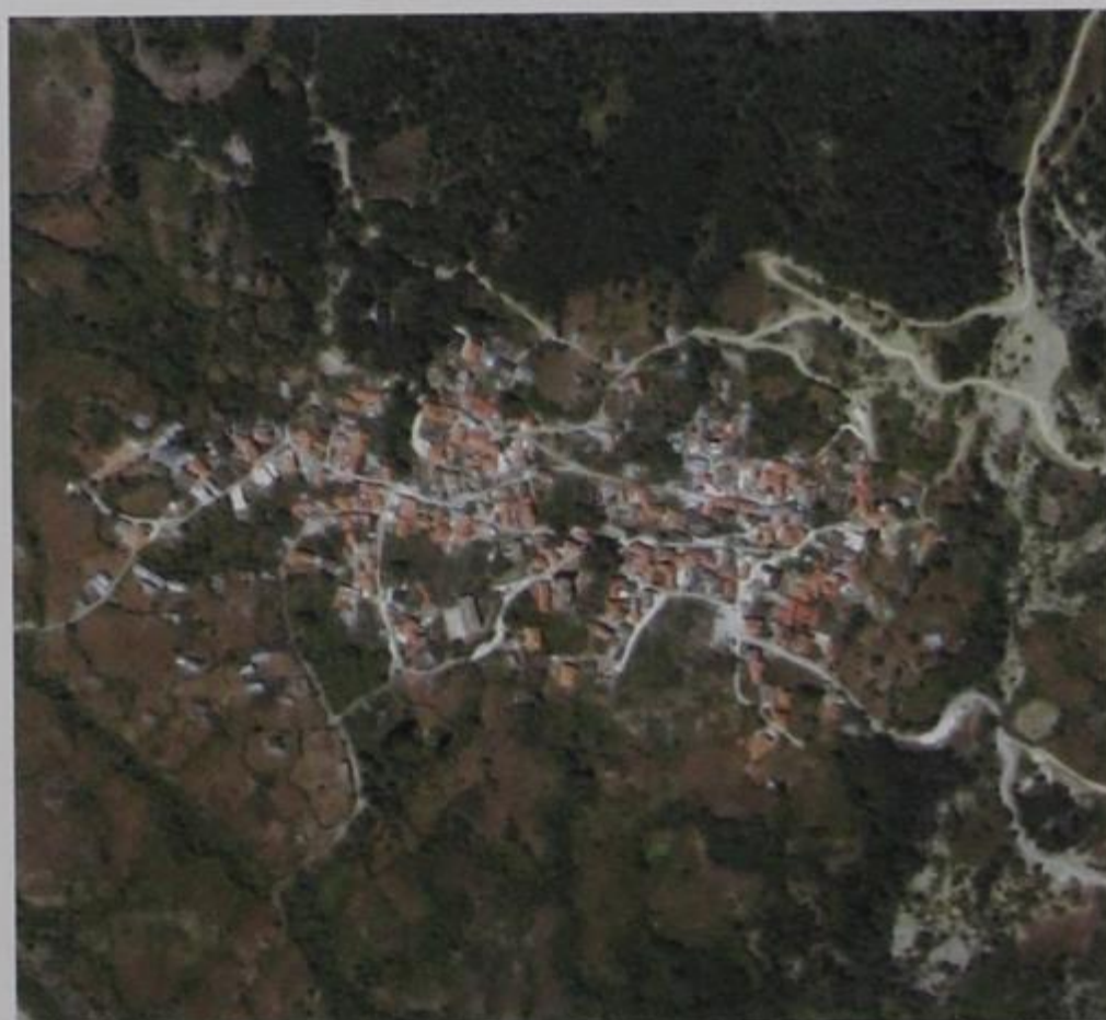
Η Δροσοπηγή από ψηλά, με το φακό του Google.

Με την υπηρεσία αυτή της Google, της πιο γνωστής μηχανής αναζήτησης του διαδικτύου, μπορεί κανείς να δει την εικόνα του χωριού από ψηλά, σε αεροφωτογραφία.