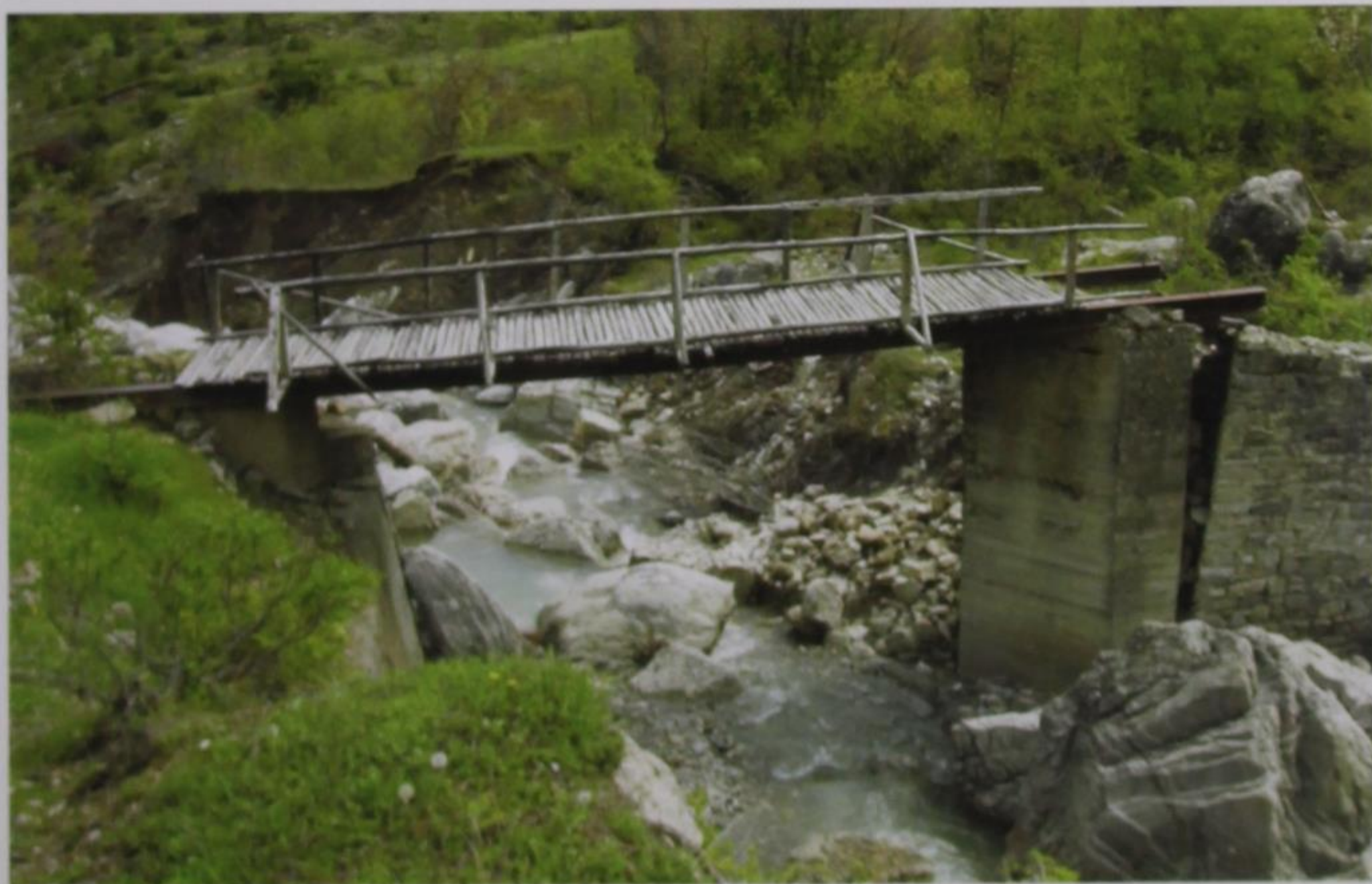
Φωτογραφία: Άννα Θ. Ζιώγα, Απρίλιος 2007

Η δεύτερη φάση , που έγινε το επόμενο έτος, ήταν πιο περίπλοκη και είχε περισσότερες διαδικασίες. Για το πρόβλημα, ποιά διατομή μορφοσιδήρου τύπου I (διπλό ταφ) επαρκούσε από άποψη αντοχής προκειμένου να χρησιμο-