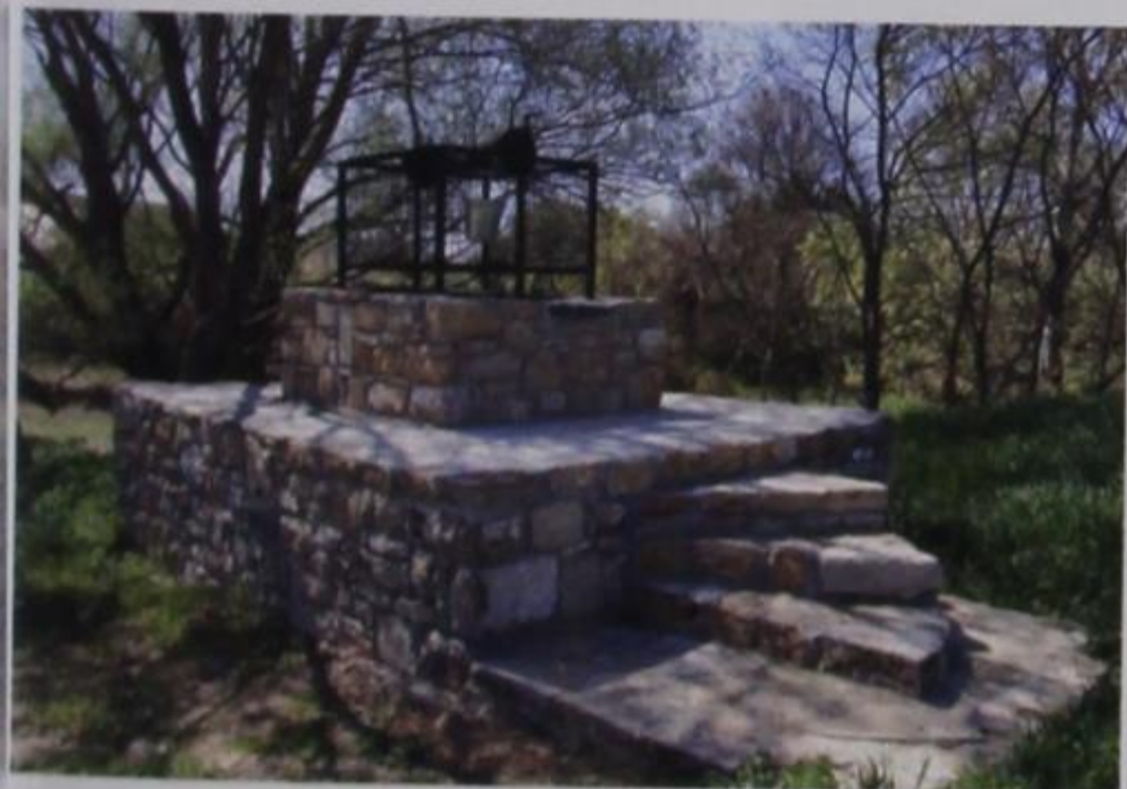
Εικ. 22 Το τούρκικο πηγάδι (φωτ. Βαγγέλη Καθάρου, 2011).

Θεσσαλονίκη Αύγουστος 2010 - Άνοιξη 2011