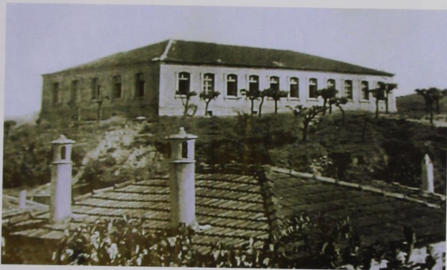
Εικ. 7 Το παλιό σχολείο της Συκιάς. Η φωτογραφία είναι βγαλμένη πριν το 1940.