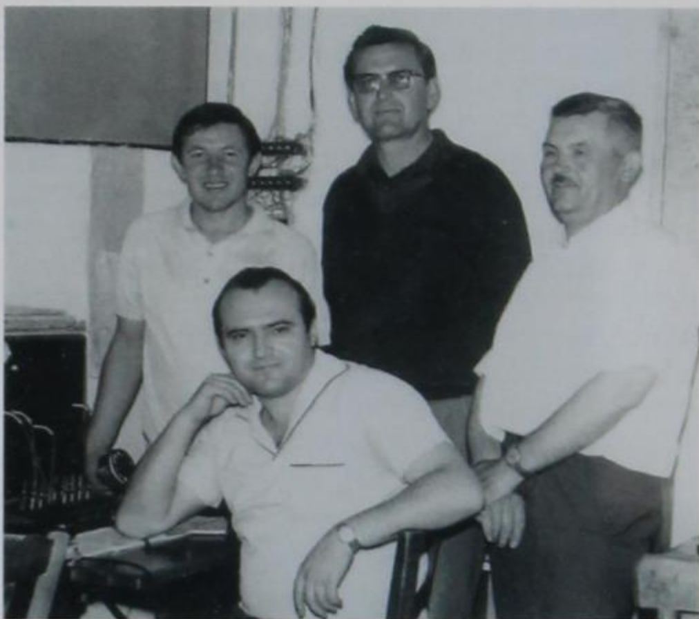
Το προσωπικό ΟΤΕ και ταχυδρομείου 1963 - 1970.

Υπηρεσιακές και οικογενειακές ανάγκες μας χώρισαν και βρεθήκαμε για πολλά χρόνια ο