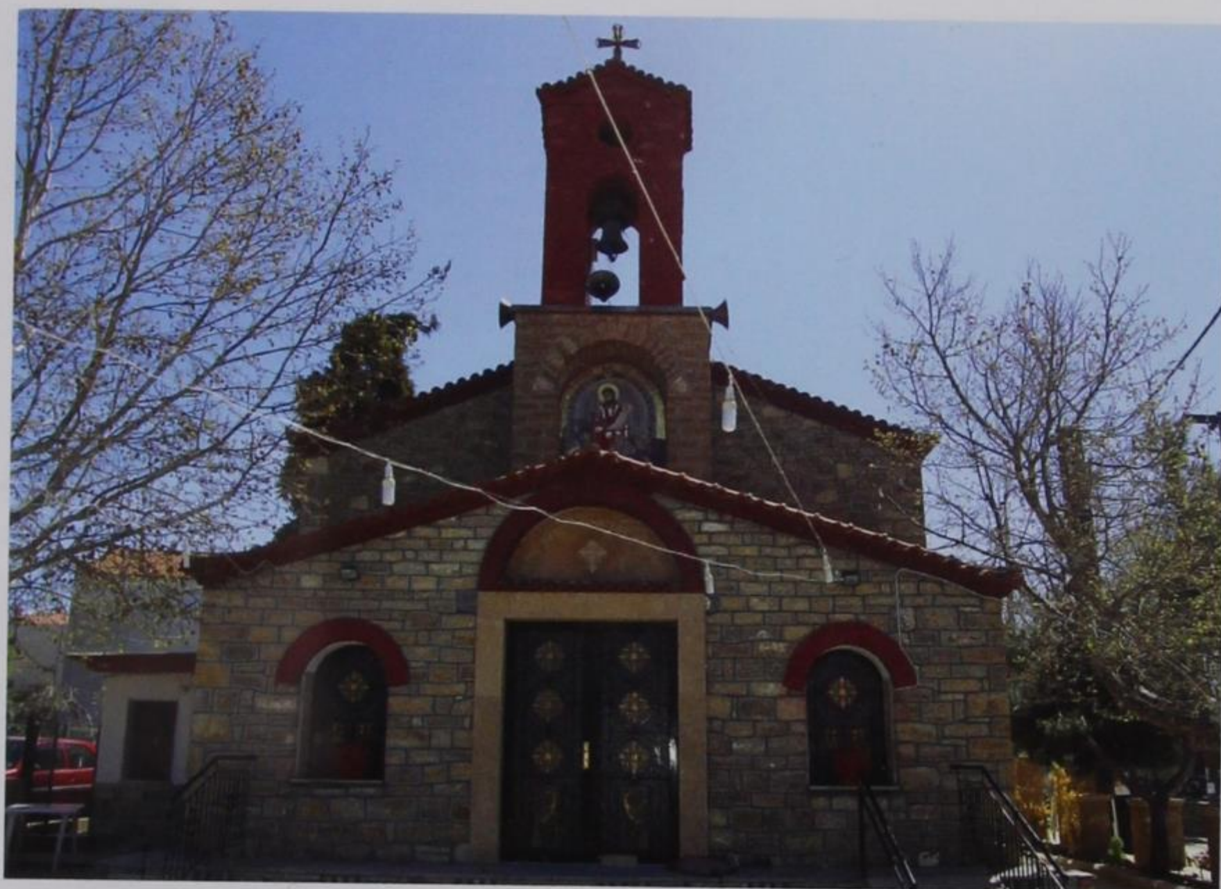
Εικ. 15 Λάκκωμα Χαλκιδικής. Εκκλησία Κοίμησης Θεοτόκου, 1950. Η κύρια είσοδος με το χαγιάτι – πρόναο που χτίστηκε το 1995 (φωτ. Βαγγέλη Καθάρου, 2011).