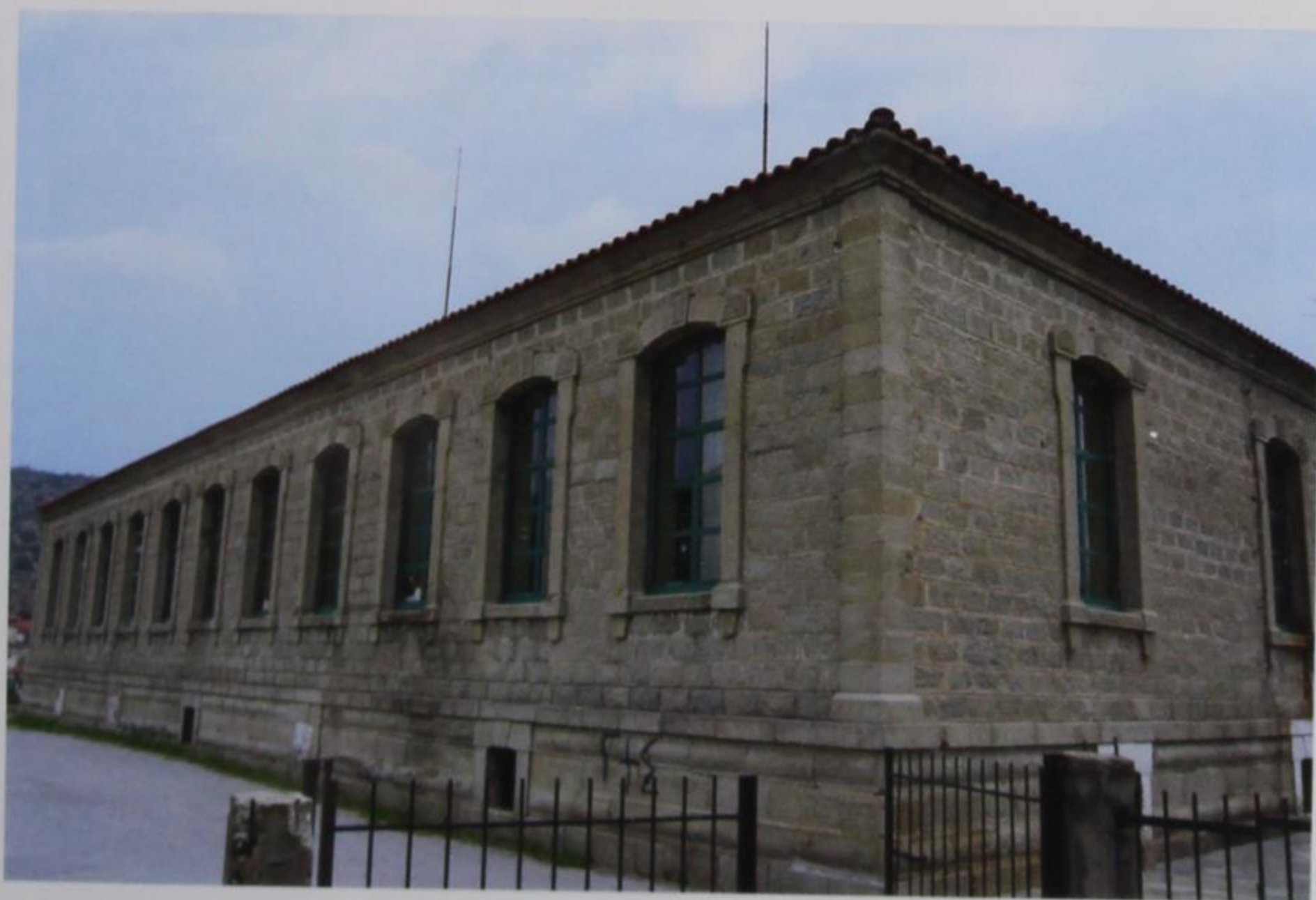
Εικ. 8 Ανατολική όψη του σχολείου Συκιάς (φωτ. Κώστα Ευρ. Βαλτά, 2010).