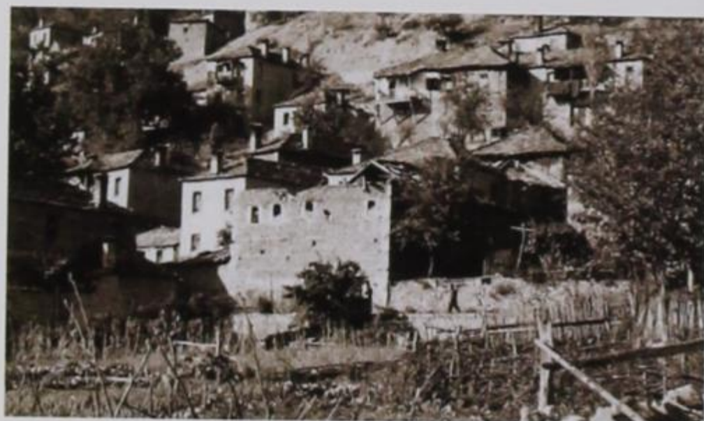
Το σπίτι της Αγγελικής Κουτρομπίνα όπως ήταν με γκρεμισμένη τη σκεπή από τον βομβαρδισμό. το Φθινόπωρο του 1948.

ασφαλείς και ηρέμησαν. Τότε η θεία αντιλήφθηκε ότι μέσα στον πανικό της είχε ξεχάσει μέσα στο σπίτι το ενός χρόνου παιδί της, τον Κώστα. Έβαλε τις φωνές και τα κλάμματα όντας σίγουρη ότι το παιδί είχε σκοτωθεί. Οι χωριανοί προσπάθησαν να την ηρεμήσουν, μάταια όμως. Όταν έφυγαν τα αεροπλάνα, ένας αντάρτης πήγε στο βομβαρδισμένο σπίτι. Εκεί βρήκε το παιδί να έχει φύγει από την κούνια, να βρίσκεται σε μια γωνιά του σπιτιού και από πάνω να το προστατεύει ένα χοντρό ξύλο της σκεπής (γριντιά), που πέφτοντας η μια άκρη της στάθηκε σε μια καμάρα του τοίχου και έτσι δεν πλάκωσε το παιδί η σκεπή.