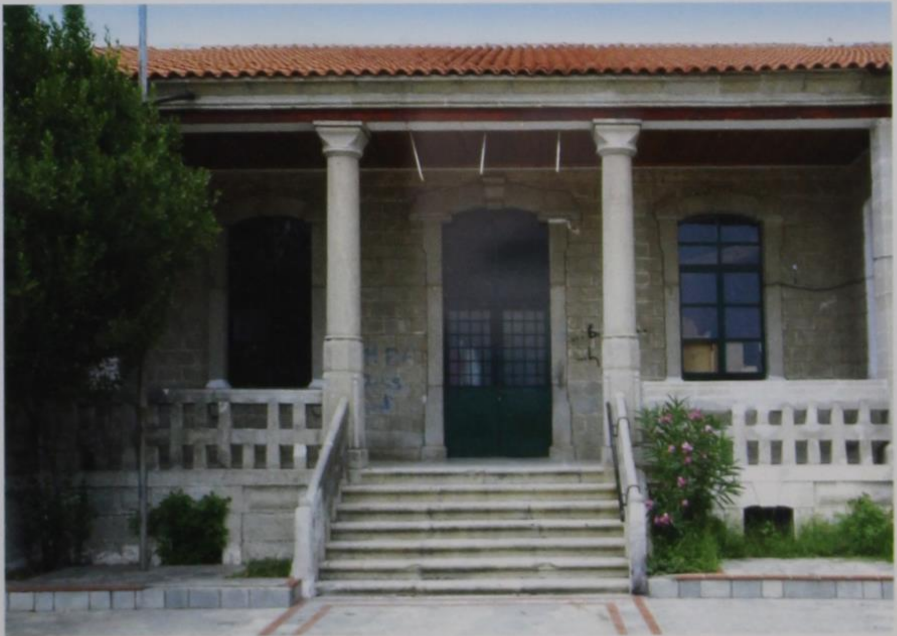
Εικ. 11 Η κεντρική είσοδος του σχολείου Συκιάς (2010).