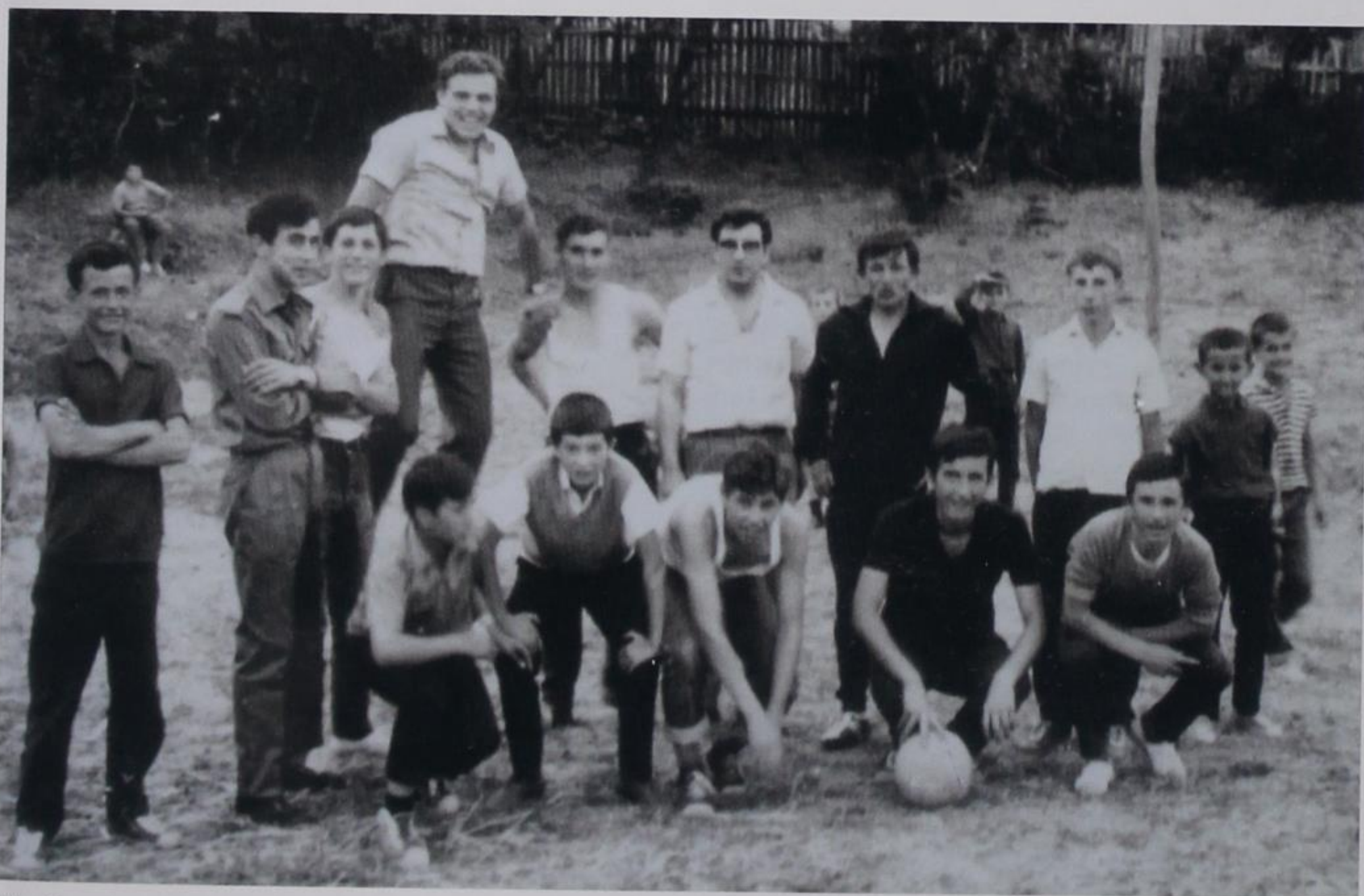
Η ποδοσφαιρική ομάδα του χωριού με τη συμμετοχή του ταχυδρόμου.

Ειδικά με το χωριό μου (Δροσοπηγή) οι σχέσεις του ήταν άριστες. Πήγα στο σπίτι του στο Κεφαλοχώρι (Λυκόρραχη – Λούψικο) και μου έδειξε πλούσιο φωτογραφικό υλικό με παρέες και νέους σε χορούς, γάμους και πανηγύρια του χωριού. Μάλιστα, συμμετείχε και σε ομάδα ποδοσφαίρου με νέους από τη Δροσοπηγή. Ήταν ένα αγαπητό πρόσωπο, και ειδικά στην τότε εποχή ήταν η αποκλειστική πηγή ειδήσεων. Αλήθεια! Τι σκληρές ήταν οι καιρικές συνθήκες εκείνα τα χρόνια! Φορτωμένος στον ώμο του τον βαρύ ταχυδρομικό σάκκο, δεν περπατούσε αλλά έτρεχε, υπερβαίνοντας και τα όρια της αντοχής, καθώς ήταν υποχρεωμένος να παλεύει με όλα τα στοιχεία της φύσης (βροχές, χιόνια, καυτερός ήλιος και άγρια θηρία). Στην αρχή το δρομολόγιο το εκτελούσε με τα πόδια, αργότερα με το μουλάρι και πιο ύστερα με ένα σαραβαλάκι μοτοποδήλατο μάρκας ZUNDAP. Εξυπηρετούσε έξι