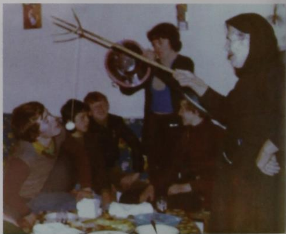
Το έθιμο του Χάσκαρου σε παλαιότερη φωτογραφία.