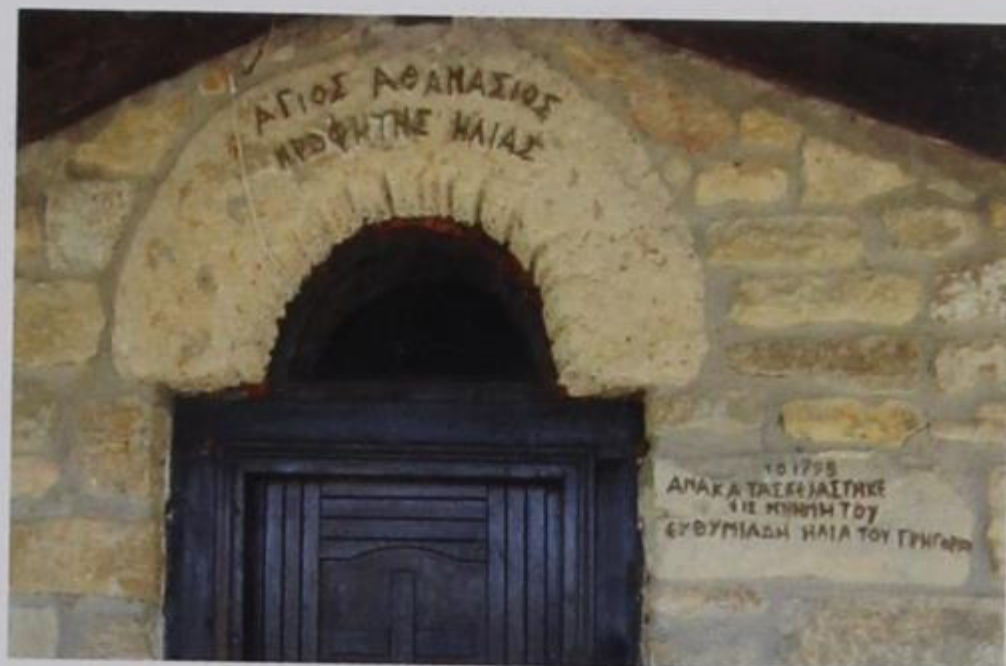
Εικ. 20, 21 Λάκκωμα Χαλκιδικής, 1998. Το εκκλησάκι του Αγίου Αθανασίου (φωτ. Βαγγέλη Καθάρου, 2011).

εκκλησάκι του Αγίου Αθανασίου που ήταν φκιαγμένο από το 1922. Δεν πείραξα μόνο τον αϊδήμο του ναού. Στην πόρτα και στα παράθυρα έβαλα μονοκόμματες πέτρες από τούρκικα σπίτια που είχε το Λάκκωμα (εικ. 20, 21).