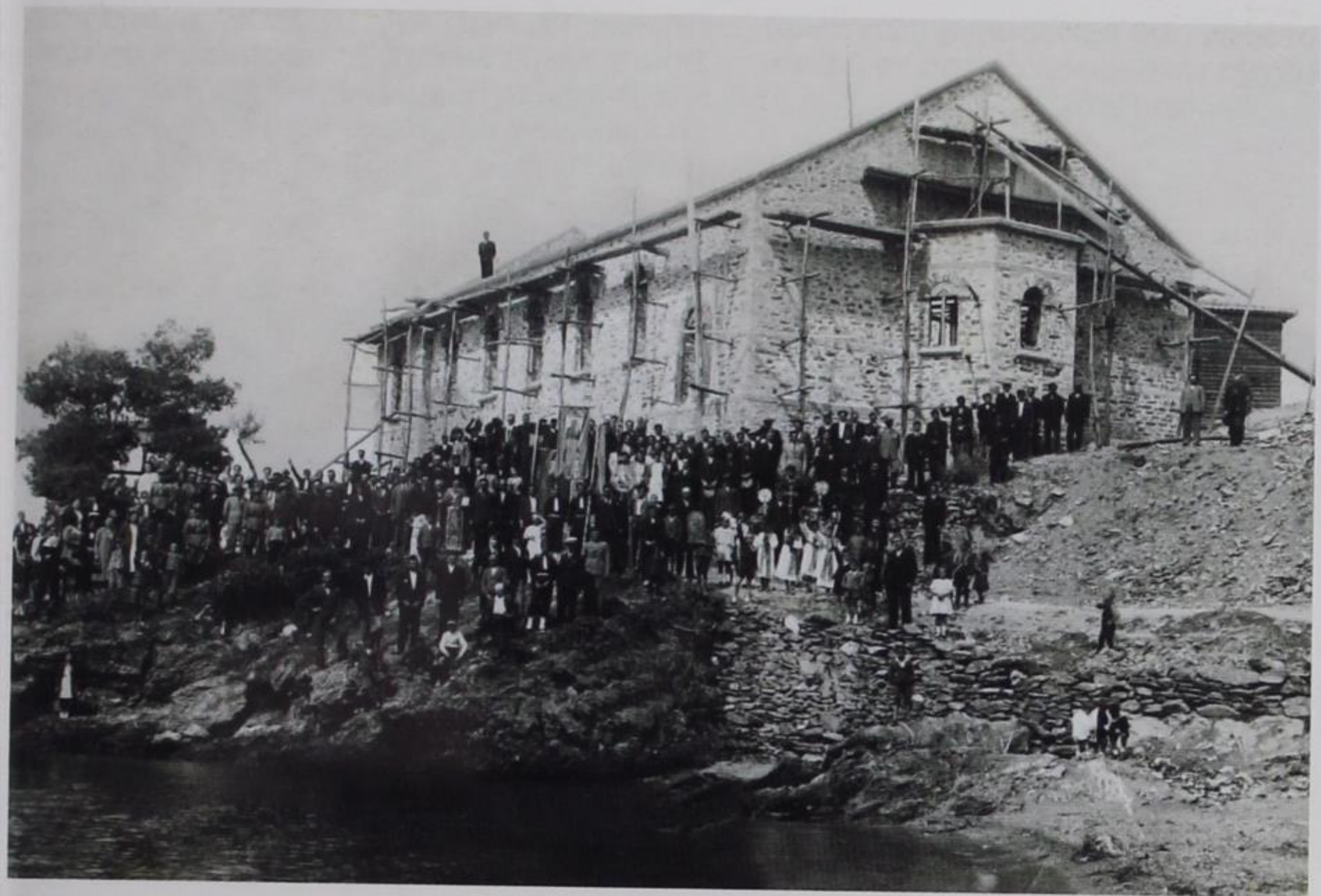
Εικ. 5 1939. Νέος Μαρμαράς Χαλκιδικής, ημέρα του Πάσχα, Δεύτερη Ανάσταση. Πίσω διακρίνεται ο νέος ναός (με τις σκαλωσιές) των Ταξιάρχων.