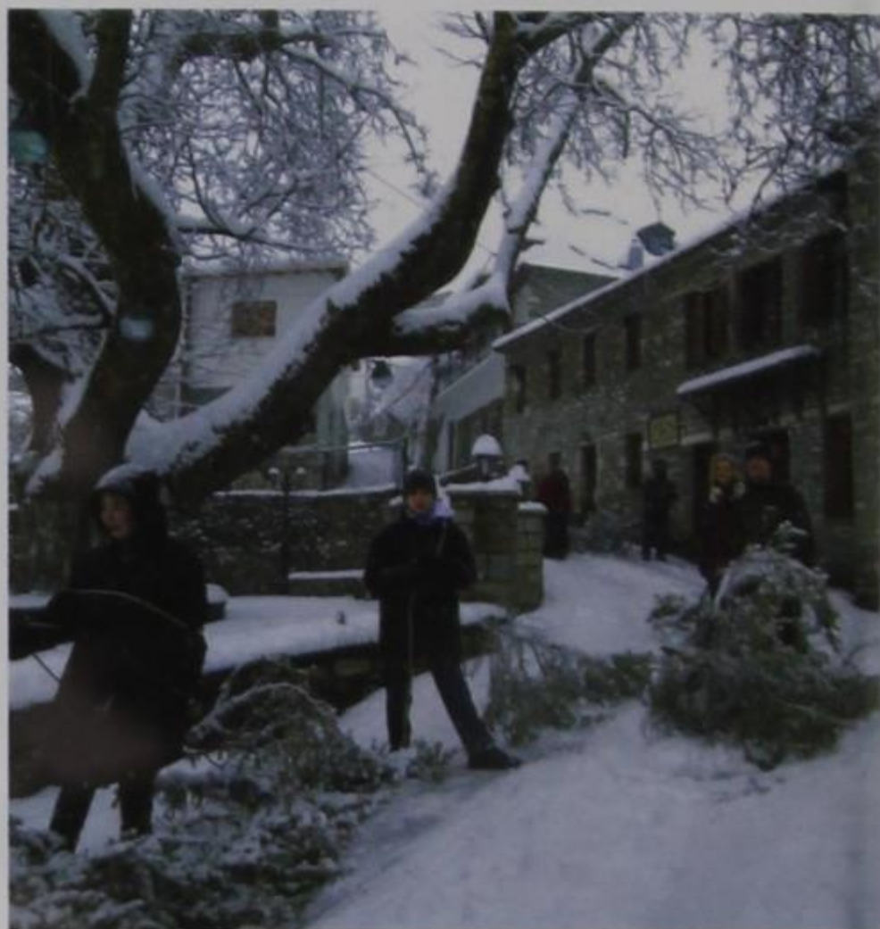
Η συλλογή των κέδρων από τους νέους του χωριού μας.

Ευτυχώς οι Καντισιώτες και ειδικά οι νέοι του χωριού μας, γαλουχημένοι με την παράδοση, τα ήθη και τα έθιμα του χωριού μας, πεισματικά αντιστέκονται και κάθε χρόνο με το ίδιο κέφι και θέληση διοργανώνουν και αναβιώνουν το έθιμο της Αποκριάς στο χωριό μας.