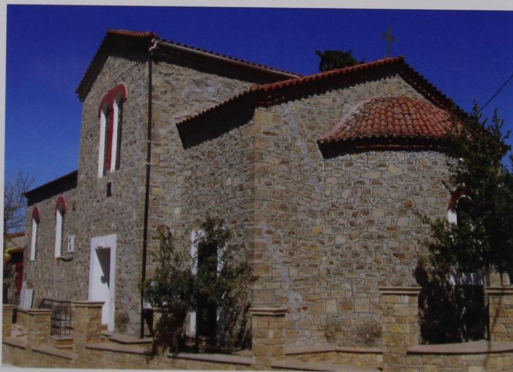
Εικ. 16 Λάκκωμα Χαλκιδικής. Εκκλησία Κοίμησης Θεοτόκου. Ανατολική – Νοτιοανατολική άποψη (φωτ. Βαγγέλη Καθάρου, 2011).