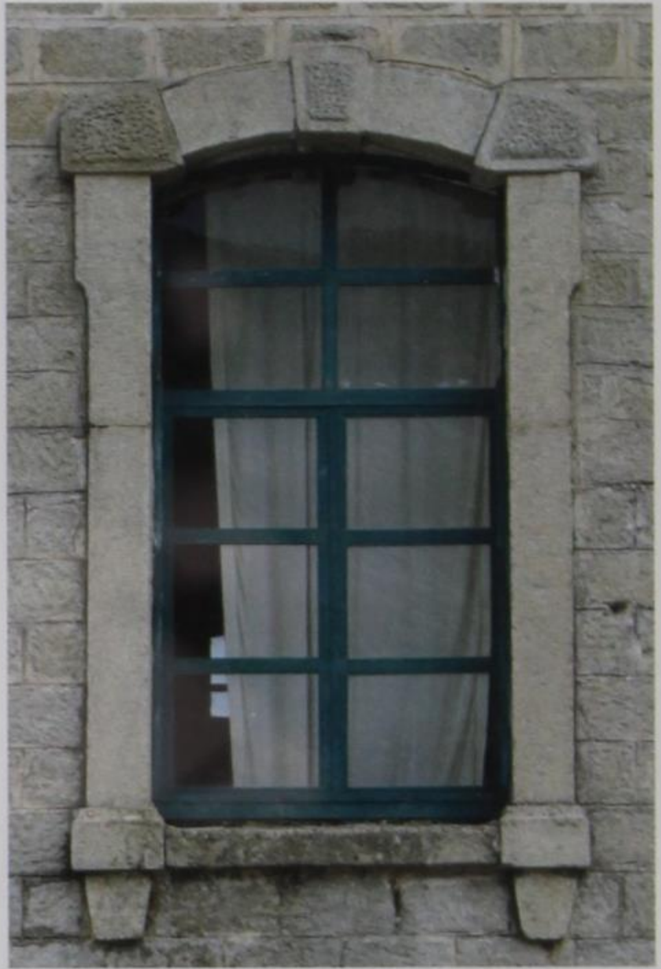
Εικ. 9, 10 Παράθυρα και φεγγίτες του σχολείου Συκιάς.