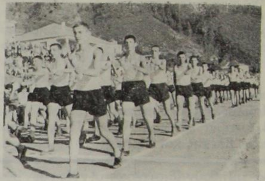
'Απὸ τὰ γυμναστικὰς ἐπιδείξεις τοῦ Γυμνασίου Κονίτσης

Χθὲς τὸ ἀπόγευμα, ἐνώπιον τῶν 'Αρχῶν καὶ μὲ συρροὴν τῶν κατοίκων τῆς πόλεώς μας, ἐτελέσθησαν αἱ ἐτήσιοι γυμναστικαὶ ἐπιδείξεις τοῦ Γυμνασίου μας. Μετὰ τὴν παρέλασιν τῶν μαθητῶν καὶ μαθητριῶν καὶ τὴν ἔπαρσιν τῆς σημαίας, ἐψάλη ὁ 'Ολυμπιακὸς ὕμνος καὶ ἐτοποθετήθη ἡ ἱερὰ φλόξ ἐπὶ τῆς 'Εστίας τοῦ βωμοῦ τῆς Πατρίδος.