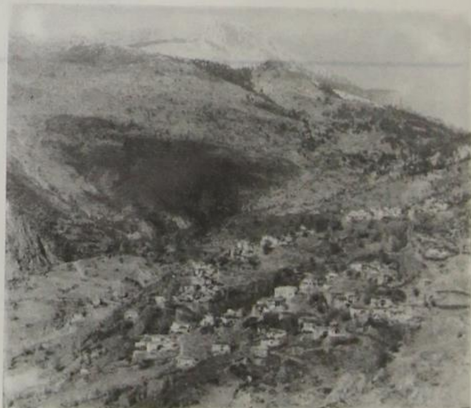
Ζέρμα (Παλιό χωριό)

μαξωτή αρτηρία της ΚΟΝΙΤΣΑΣ – ΝΕΑ-ΠΟΛΗΣ, η ηλεκτροδότηση του, το σύγχρονο υδραγωγείο και το νεόκτιστο πολιτιστικό κέντρο δίνουν στον επισκέπτη την όψη ενός παράξενου χωριού πάνω στα Ηπειρ. βουνά. Στα βουνά που διαγράφηκε το έπος του 40 και ο εμφύλιος σπαραγμός. Τον φετεινό χειμώνα ολοκληρώνεται σχεδόν η μεταφορά όλων των μόνιμων κατοίκων. Τα τελευταία χρόνια, είναι αλήθεια, έγιναν πολλά, στο νέο χωριό. Υπάρχουν όμως ακόμα προβλήματα που πρέπει να βρουν την λύση τους τώρα. (π.χ. τηλεφωνική σύνδεση, Εκκλησία κλπ.). Οι εκλεγμένοι από την πλειοψηφία των Ζερματινών στο κοινοτικό συμβούλιο, ας προσπαθήσουν.