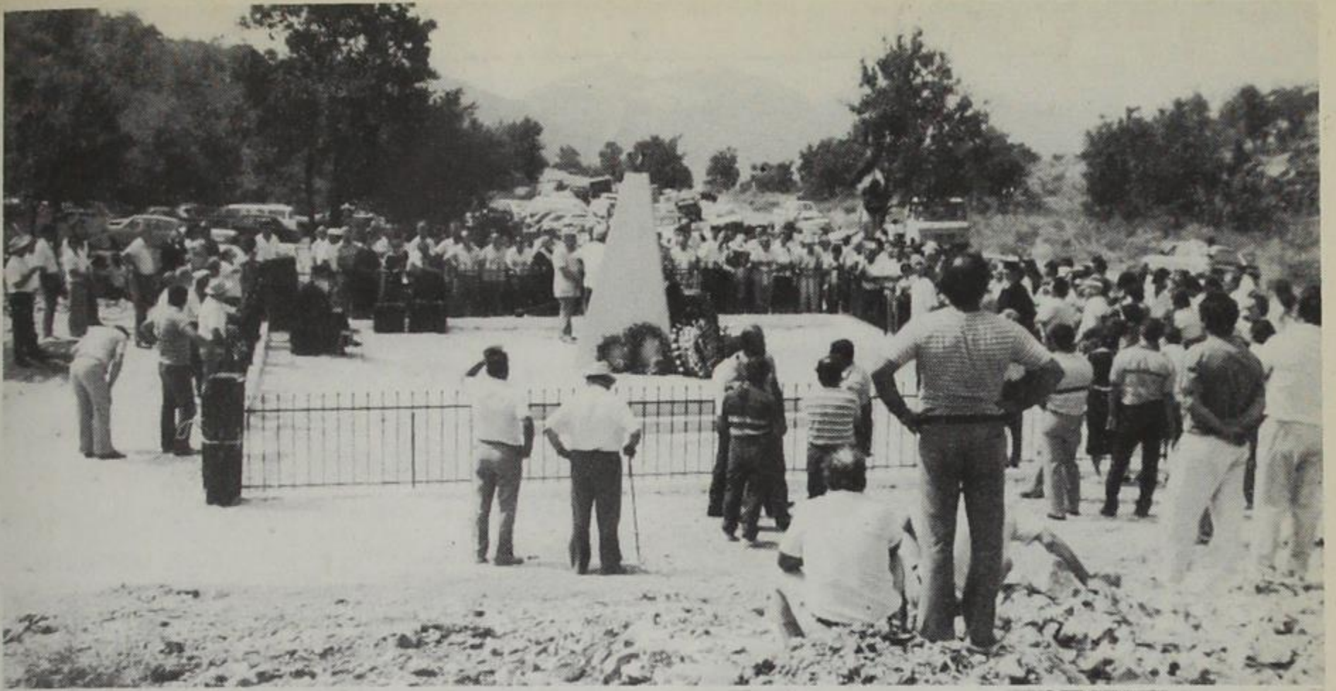
Από τ' αποκαλυπτήρια του Μνημείου στη Βίγλα 14.8.88