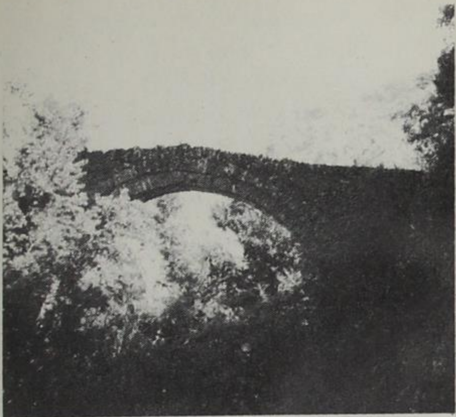
Πουρνιά: Γεφύρι του Σελού του Δυτικού χειμάρου του χωριού.