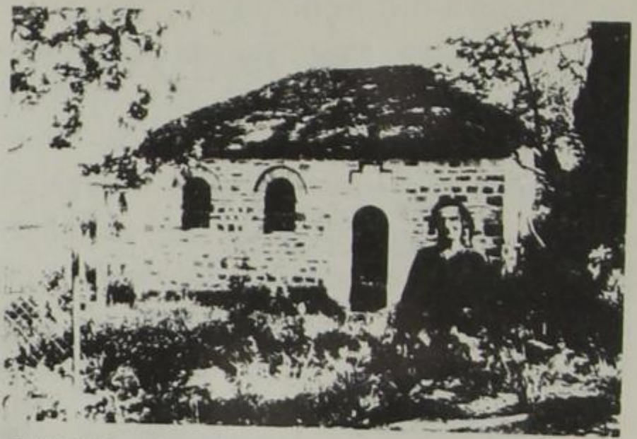
Το γραφικό παρεκκλήσι του Αγίου