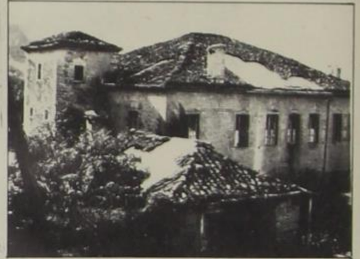
Το αρχοντικό του Μπεκιάρη στην Κόνιτσα