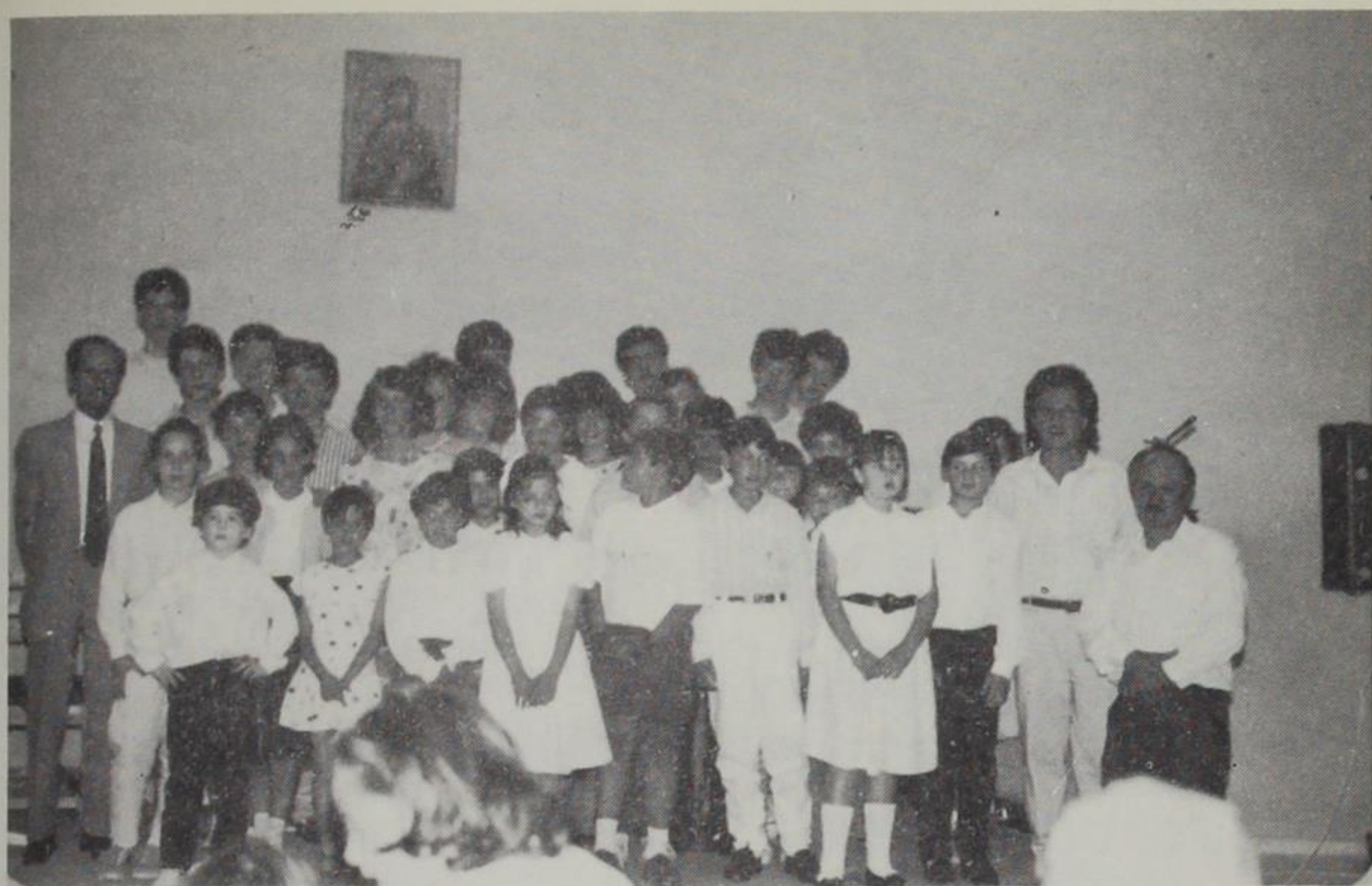
Από τη χρονιάτικη εκδήλωση του Μουσικού τμήματος στο αμφιθέατρο του Δήμου του Ιούνη του 1989.