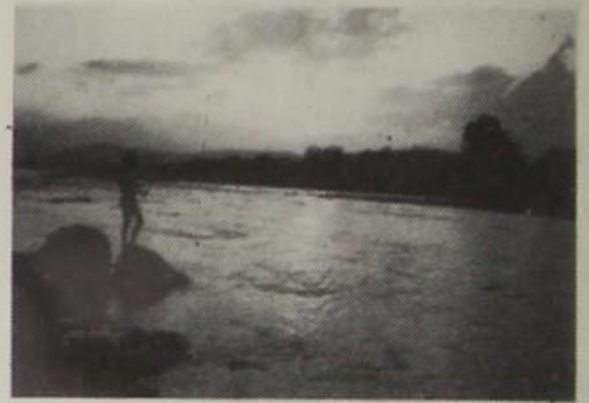
Αώος σε καλές ημέρες