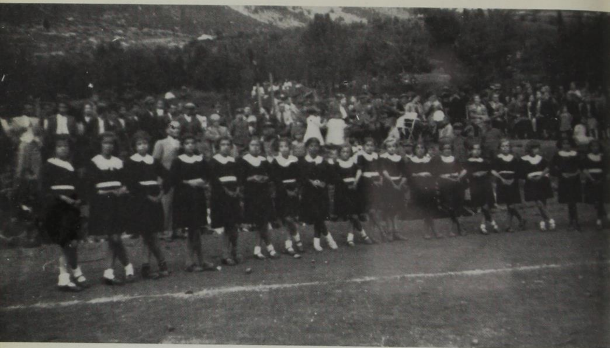
Γυμναστικές επιδείξεις μαθητριών Β' Δημ. Σχολείου