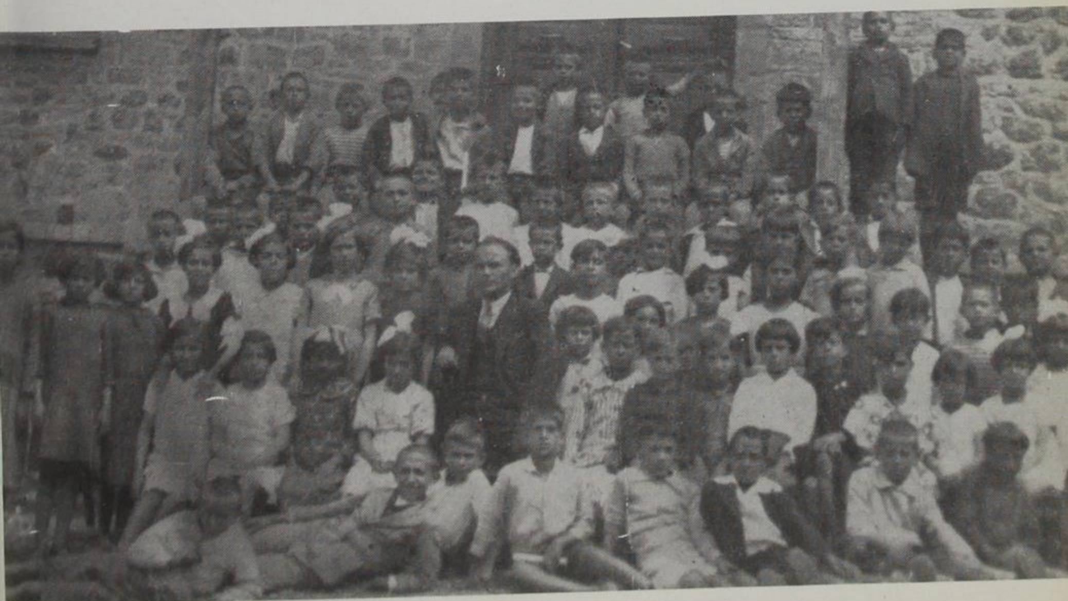
Β'. Δημ. Σχολείο Κ. Κόνιτσας (προπολεμικά)