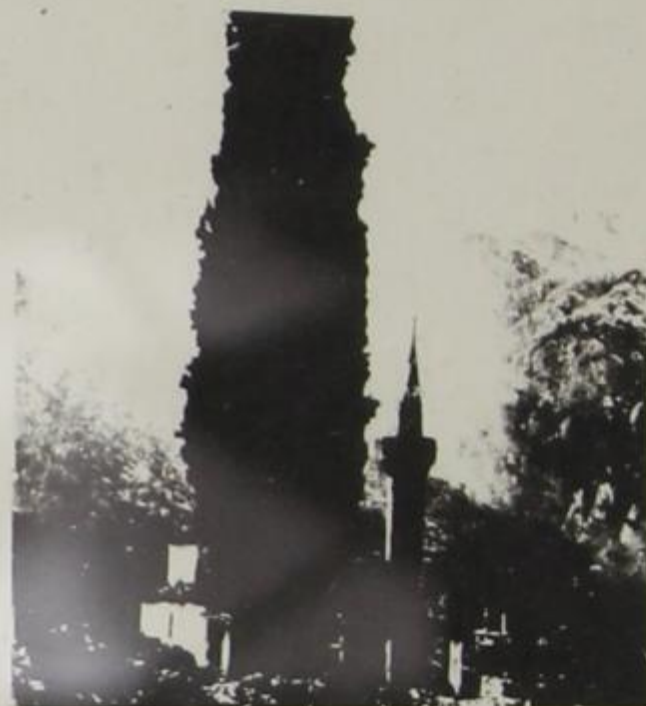
Τζαμί Δερβισιάδων στη θέση του σημερινού Ναού Αγίου - Κοσμά