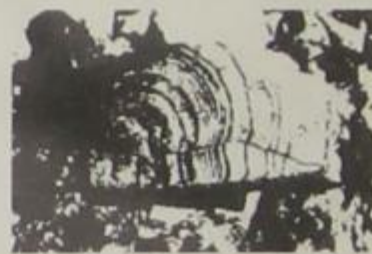
Πετρώματα στην περιοχή Γραμήλας