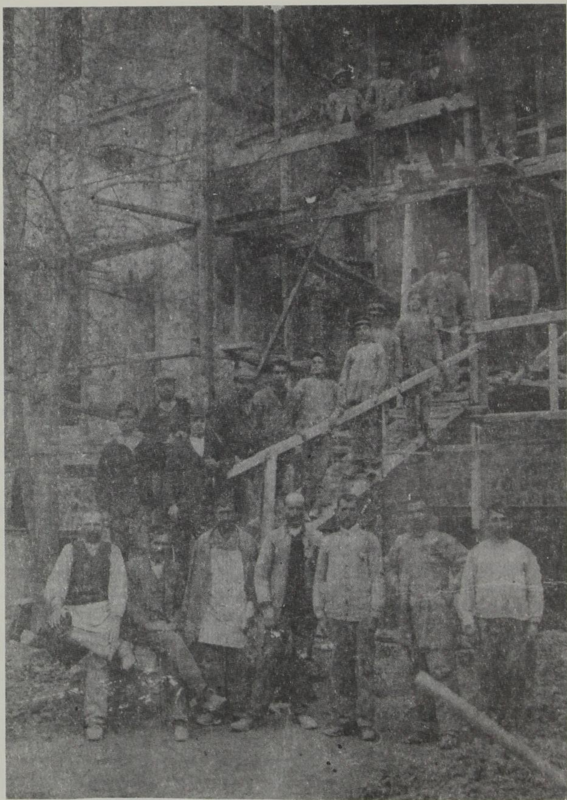
Δροσπηγιώτες μαστόροι χτίζουν το Νοσοκομείο «Ευαγγελισμός» Αθηνών.