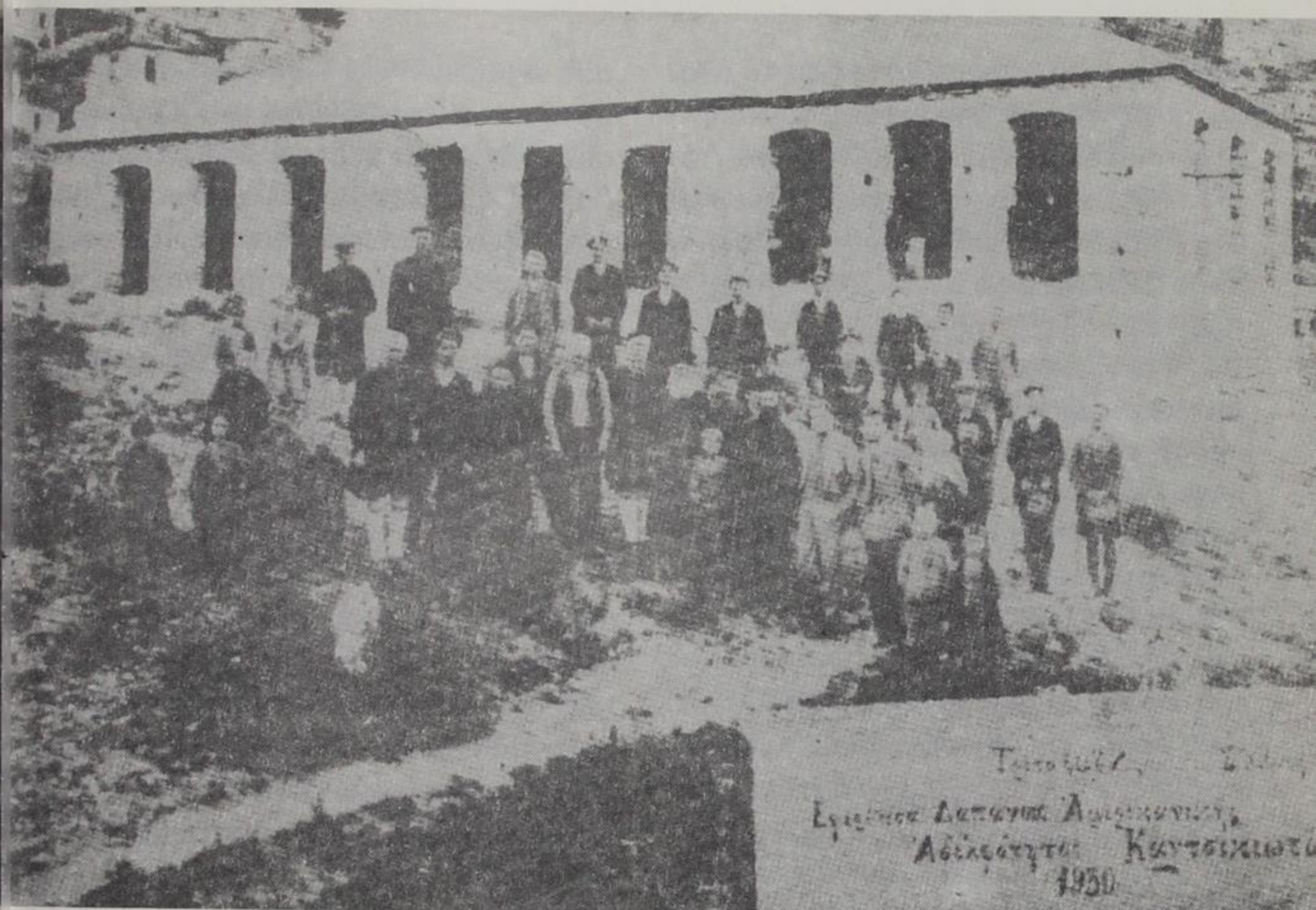
Το 1904 Εργασία Διασκευα Αμερικανικη Αδελφότητος Καντσειωτων 1930