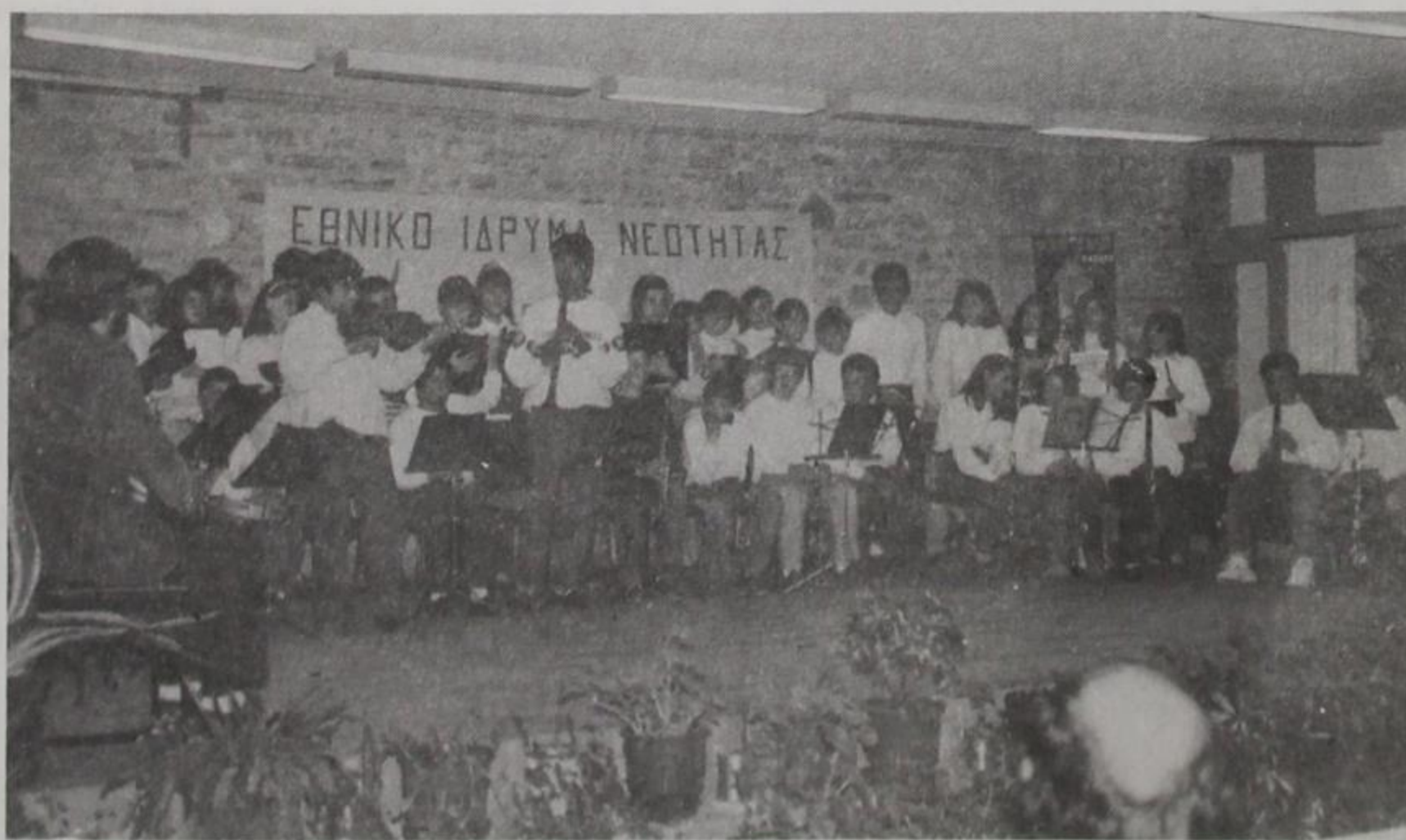
Μουσικό Γυμνάσιο Δολιανών