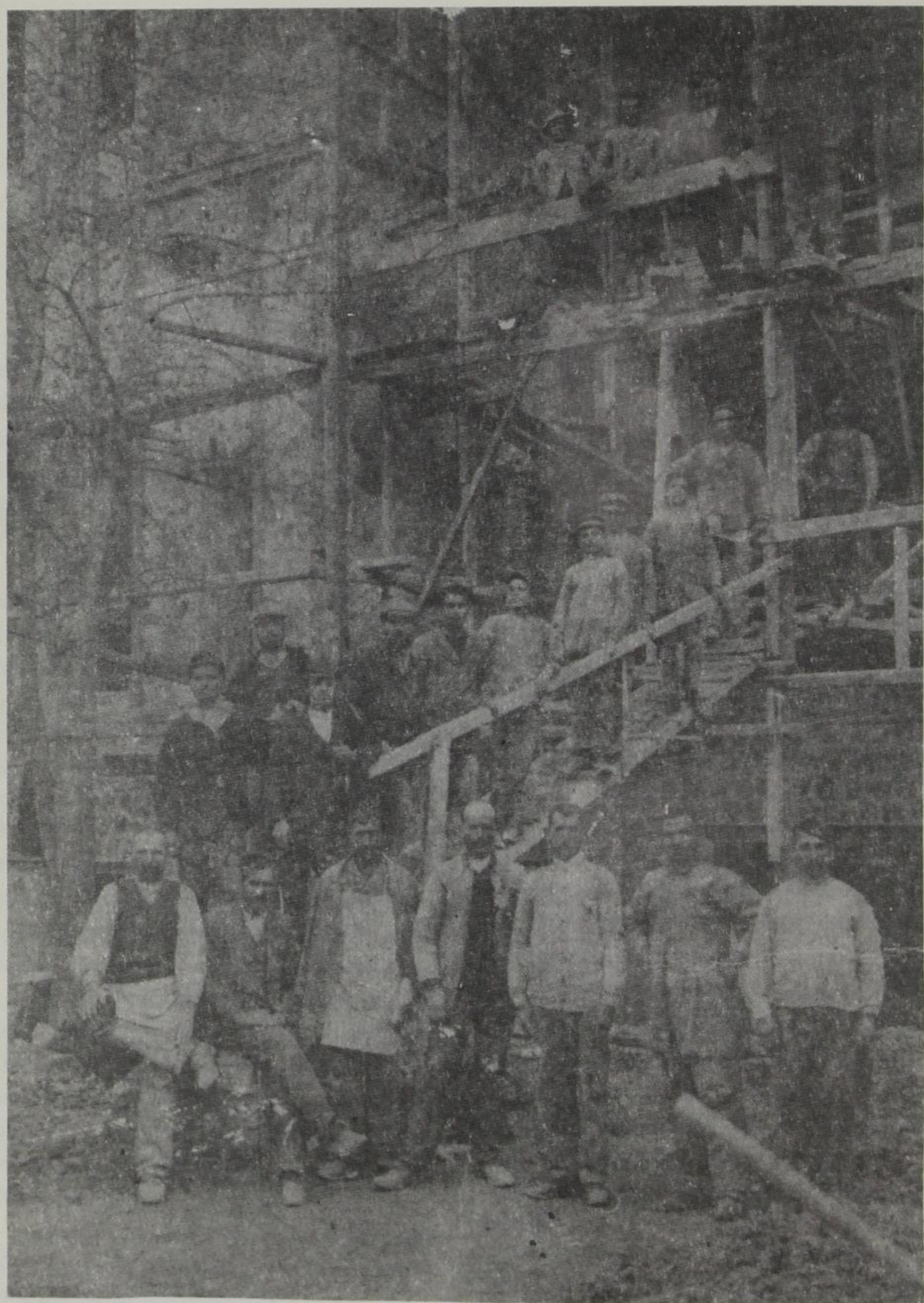
Δροσπηγιώτες μαστόροι χτίζουν το Νοσοκομείο «Ευαγγελισμός» Αθηνών.