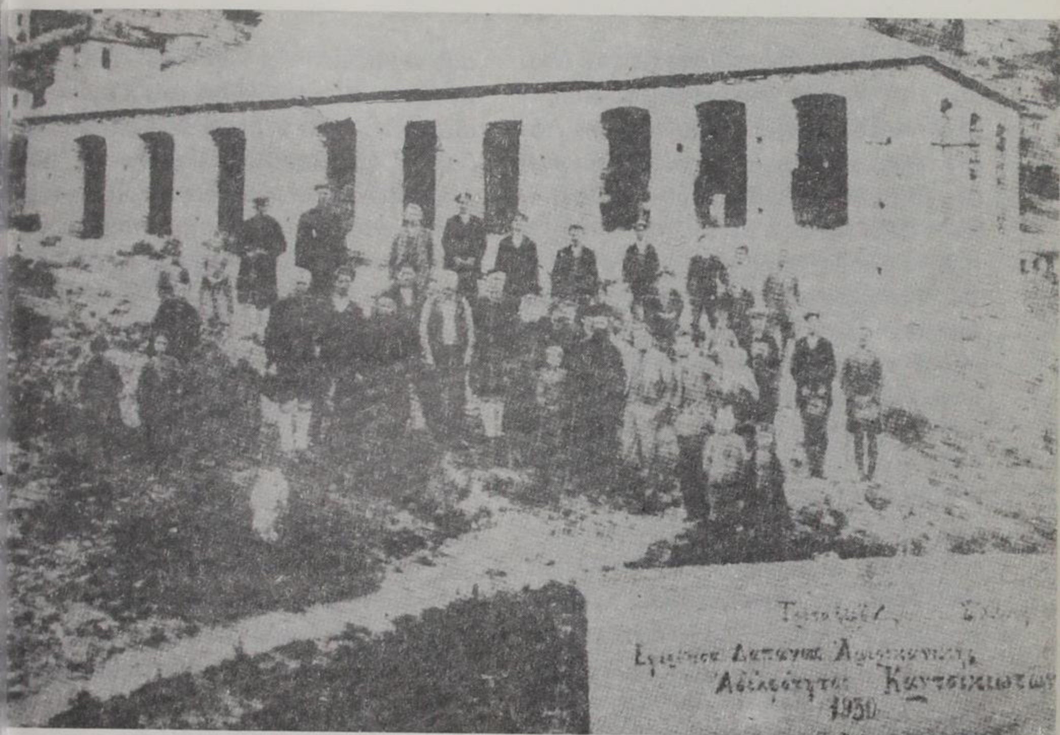
Το σχολείο Εργαστήριο Διαπαιδαγωγίας Αμερικανικής Αδελφότητας Καντσίωτων 1950