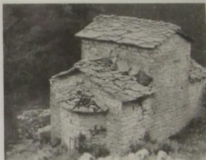
Η εκκλησία της Ευαγγελίστριας στο Καστράκι