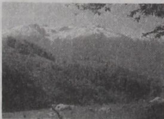
43 Μάρτις - Απρίλιος 1992