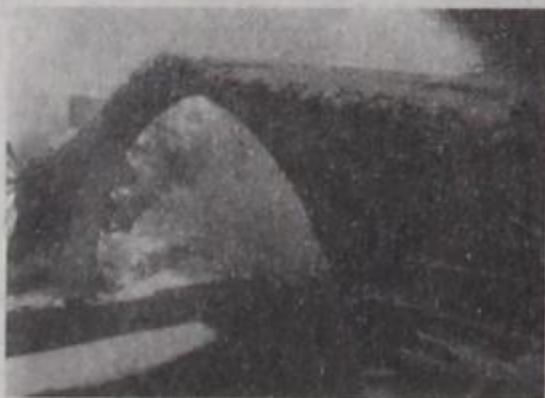
42 Γεφύρας - Φεβρουάριος 1992