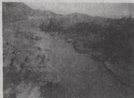
44 Μάιος - Ιούνιος 1992