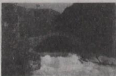
46. Σεπτέμβριος - Οκτώβριος 1992