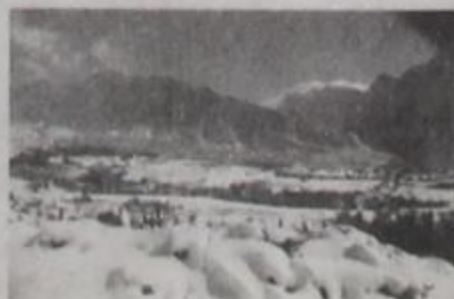
47. Νοέμβριος - Δεκέμβριος 1992