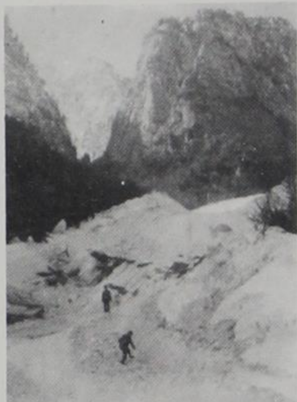
Χιονοστιβάδα στη χαράδρα Αώου

ΠΕΡΙΟΔΟΣ ΤΡΙΤΗ, ΤΕΥΧΟΣ 48 ΔΡΧ. 200 Κ Ο Ν Ι Τ Σ Α