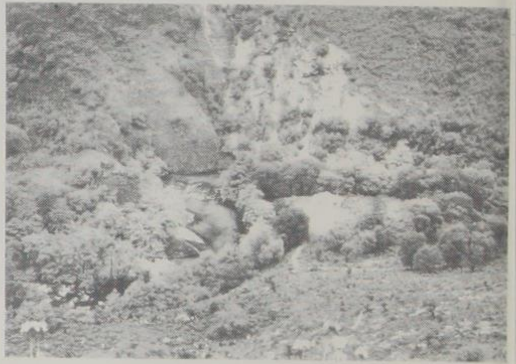
Φωτ. εξώφ. Πηγές Βοϊδομάτη.