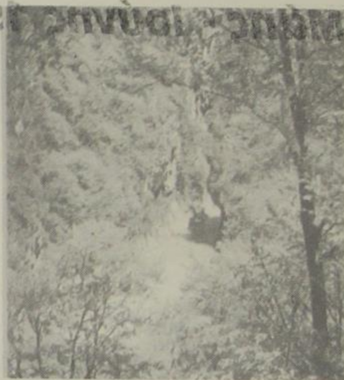
Φωτ. εξώφ. Αώος-Στόμιο

ΔΕΕ ΠΕΡΙΟΔΙΚΟ ΕΠΙΚΟΙΝΩΝΙΑΣ ΚΑΙ ΠΡΟΒΟΛΗΣ ΤΗΣ ΕΠΑΡΧΙΑΣ ΚΟΝΙΤΣΑΣ