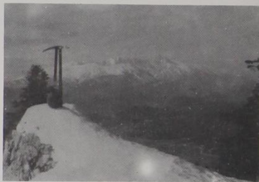
Φωτ. εξώφ. Χιονισμένα βουνά στην Κόνιτσα.