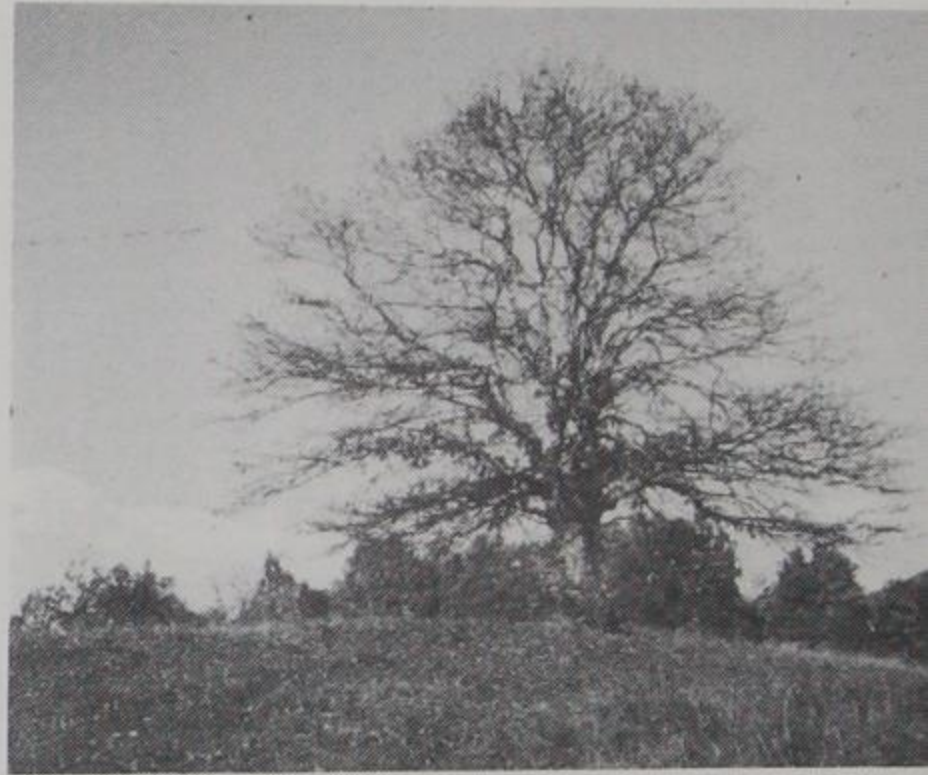
Φωτ. εξωφ. Βελανιδιά