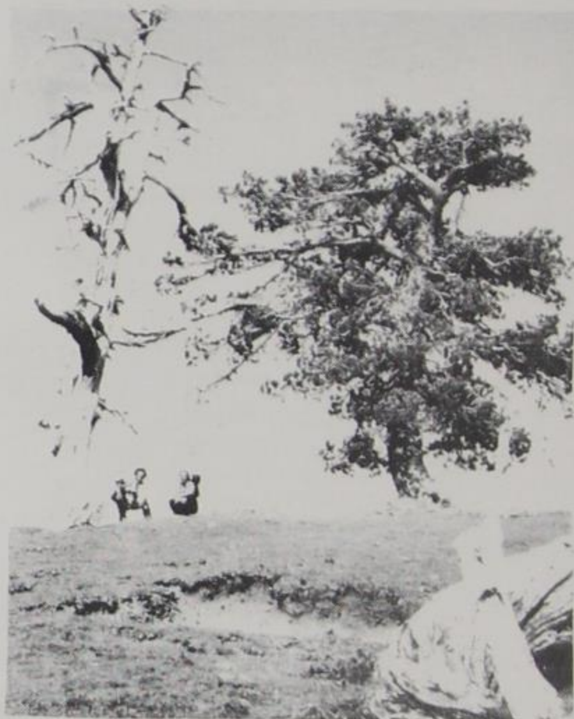
Φωτ. εξωφ. Σ.Τ. - Στο Σμόλικα