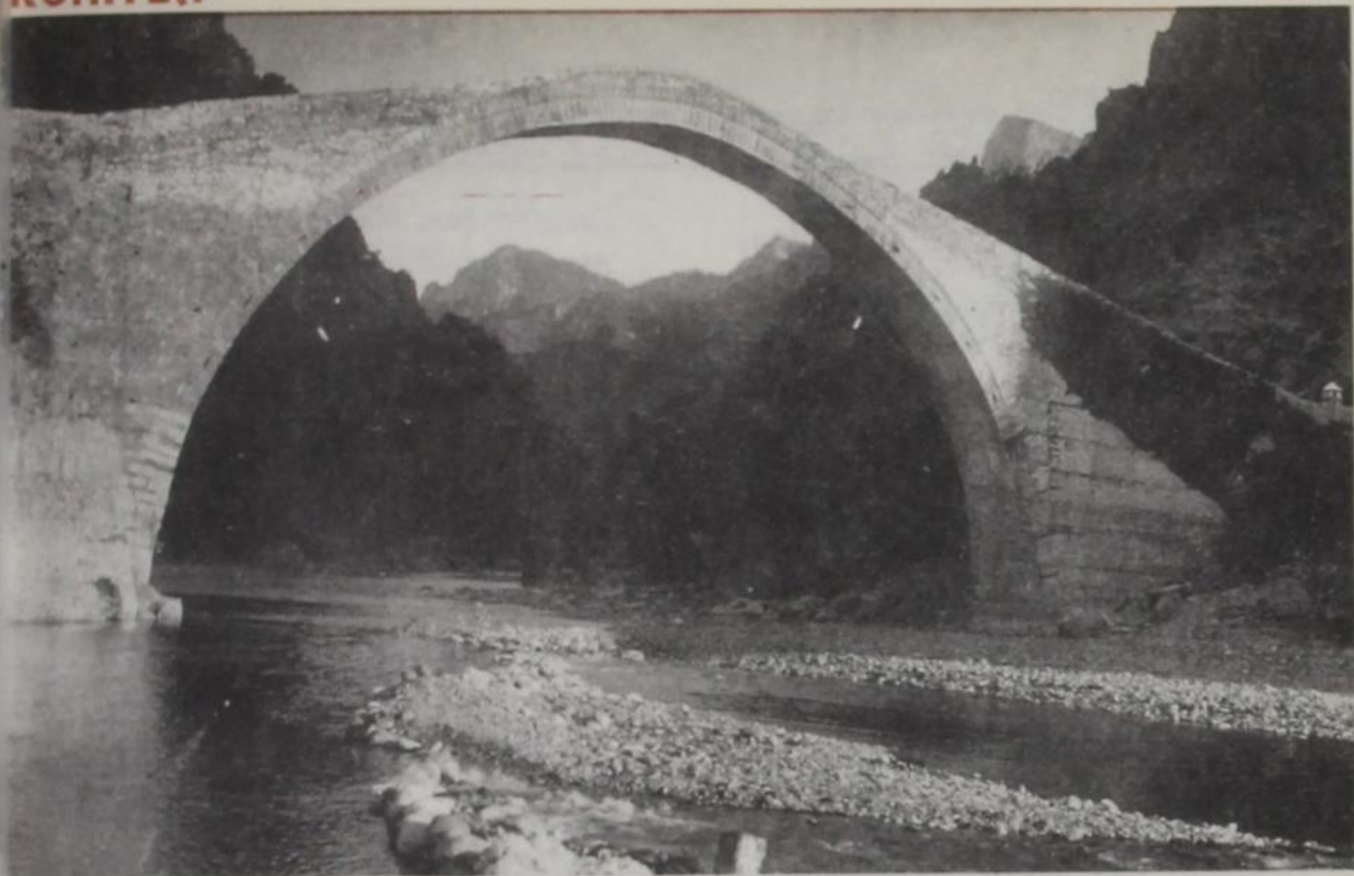
Τό γεφύρι τής Κόνιτσας τό 1938.