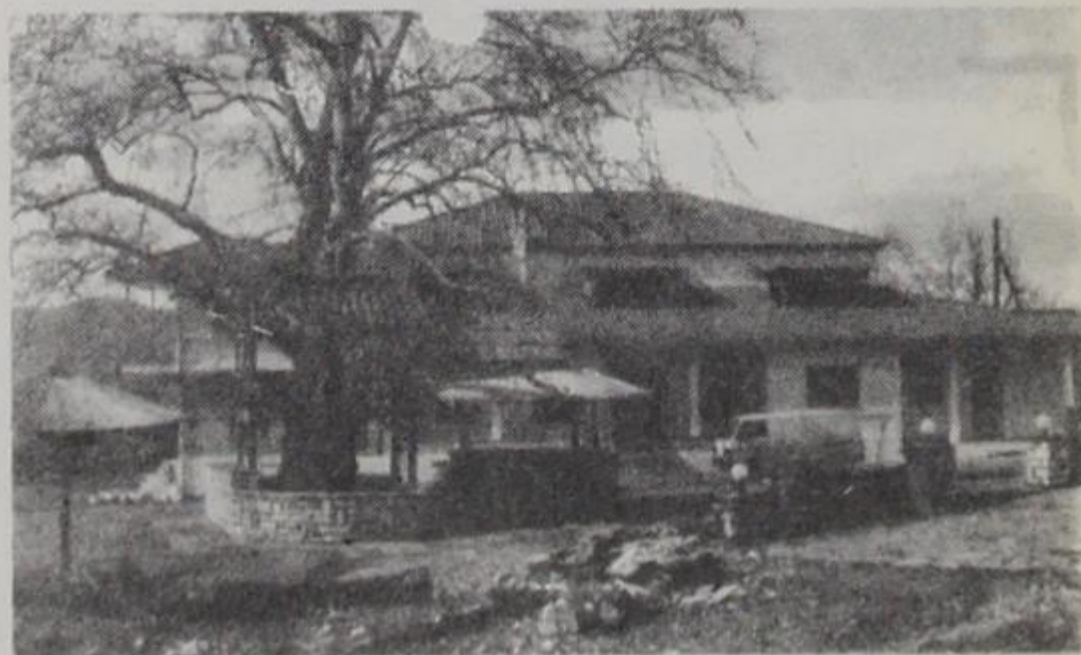
ΞΕΝΟΔΟΧΕΙΟ "Το Γεφύρι" Με 40 κλίνες, εστιατόριο, μπάρ, θέρμανση, πάρκιγκ κλπ. Στην ειδυλλιακή τοποθεσία της γέφυρας Αώου στην Κόνιτσα. Τηλ. 0655-23780

Οι Αρσακειάδες και Αρσακειείς με την υιοθεσία και την αδελφοποίηση έδειξαν έμπρακτα την πίστη τους στα ιδεώδη της αλληλεγγύης και της αγάπης τους, ιδεώδη που κληρονόμησαν από το αγαπητό τους σχολείο οι παλαιότεροι και με τα οποία γαλουχούνται οι νεότεροι, δίνοντας έτσι το παρόν σε κάθε εθνική και κοινωνική ανάγκη.