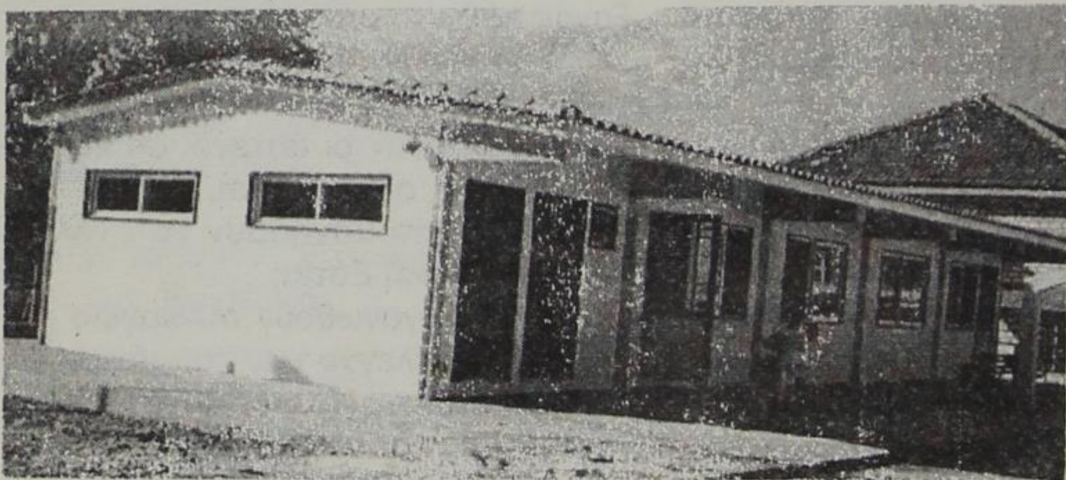
Αντισεισμικά προκατασκευασμένα κτίρια Γ. Δημοτικού Σχολείου και Τεχνικού Λυκείου

Ταυτόχρονα όμως αρχίσαμε σε συνεργασία με τη Νομ/κή Αυτ/ση και την Περιφέρεια Ηπείρου την οργάνωση και σύνταξη ειδικής αναπτυξιακής πρότασης για την Επαρχία της Κόνιτσας. Με τεκμηρίωση και αγώνα, συναντήσεις με υπουργούς και υπηρεσιακούς παράγοντες οδηγούμαστε στην αποδοχή καταρχήν της πρότασης χωρίς να έχουμε ακόμη οριστικό ΝΑΙ.