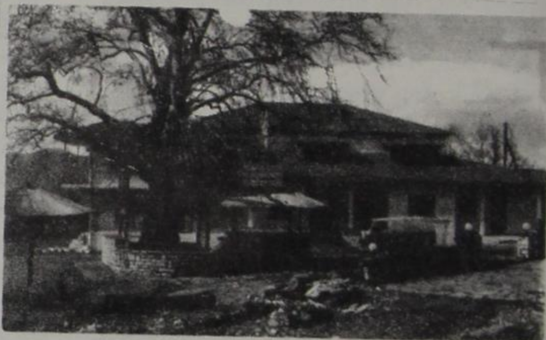
ΞΕΝΟΔΟΧΕΙΟ "Το Γεφύρι" Με 40 κλίνες, εστιατόριο, μπάρ, θέρμανση, πάρκινγκ κλπ. Στην ειδυλλιακή τοποθεσία της γέφυρας Αώου στην Κόνιτσα. Τηλ. 0655-23780

Θέμιδος 2 - Α. όροφος- Τηλ. 22464 Οικ. Ιουστινιανού 127 - Τηλ. 33147 Δ Ρ Α Μ Α