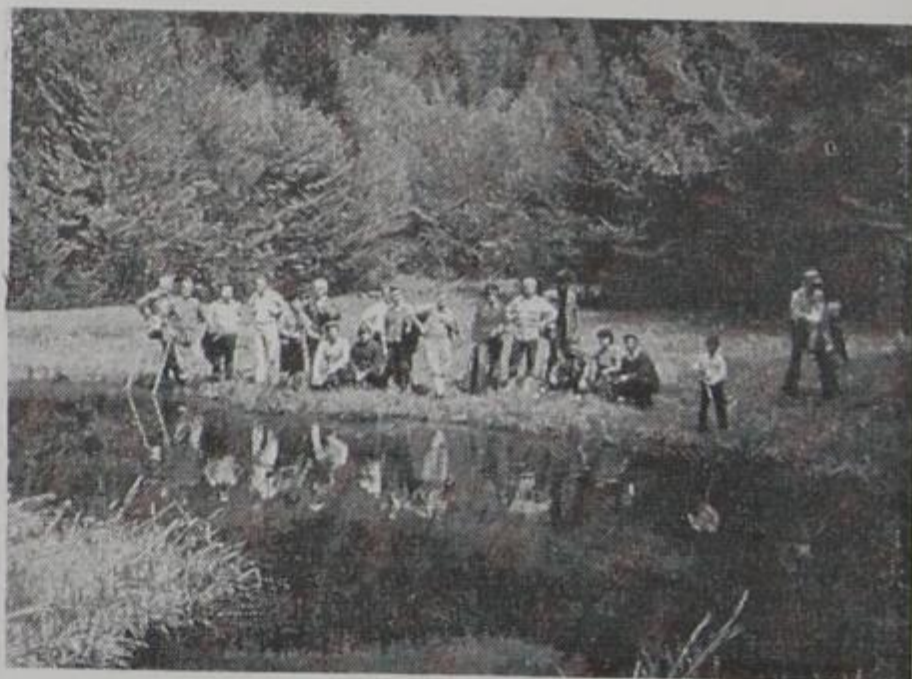
(Ορειβάτες στο Ασημοχώρι)