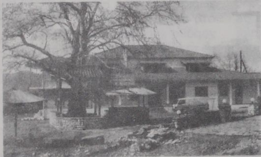
ΞΕΝΟΔΟΧΕΙΟ "Το Γεφύρι" Με 40 κλίνες, εστιατόριο, μπάρ, θέρμανση, πάρκινγκ κλπ. Στην ειδυλλιακή τοποθεσία της γέφυρας Αώου στην Κόνιτσα. Τηλ. 0655-23780

ΝΟΙΚΙΑΖΟΜΕΝΑ ΔΩΜΑΤΙΑ ΣΤΗΝ ΚΟΝΙΤΣΑ ROOMS FOR RENT (500 μ. από την είσοδο στην πόλη) Με θέρμανση, μπάνιο κλπ.