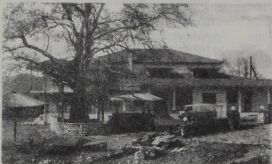
ΞΕΝΟΔΟΧΕΙΟ "Το Γεφύρι" Με 40 κλίνες, εστιατόριο, μπάρ, θέρμανση, πάρκιγκ κλπ. Στην ειδυλλιακή τοποθεσία της γέφυρας Αώου στην Κόνιτσα. Τηλ. 0655-23780