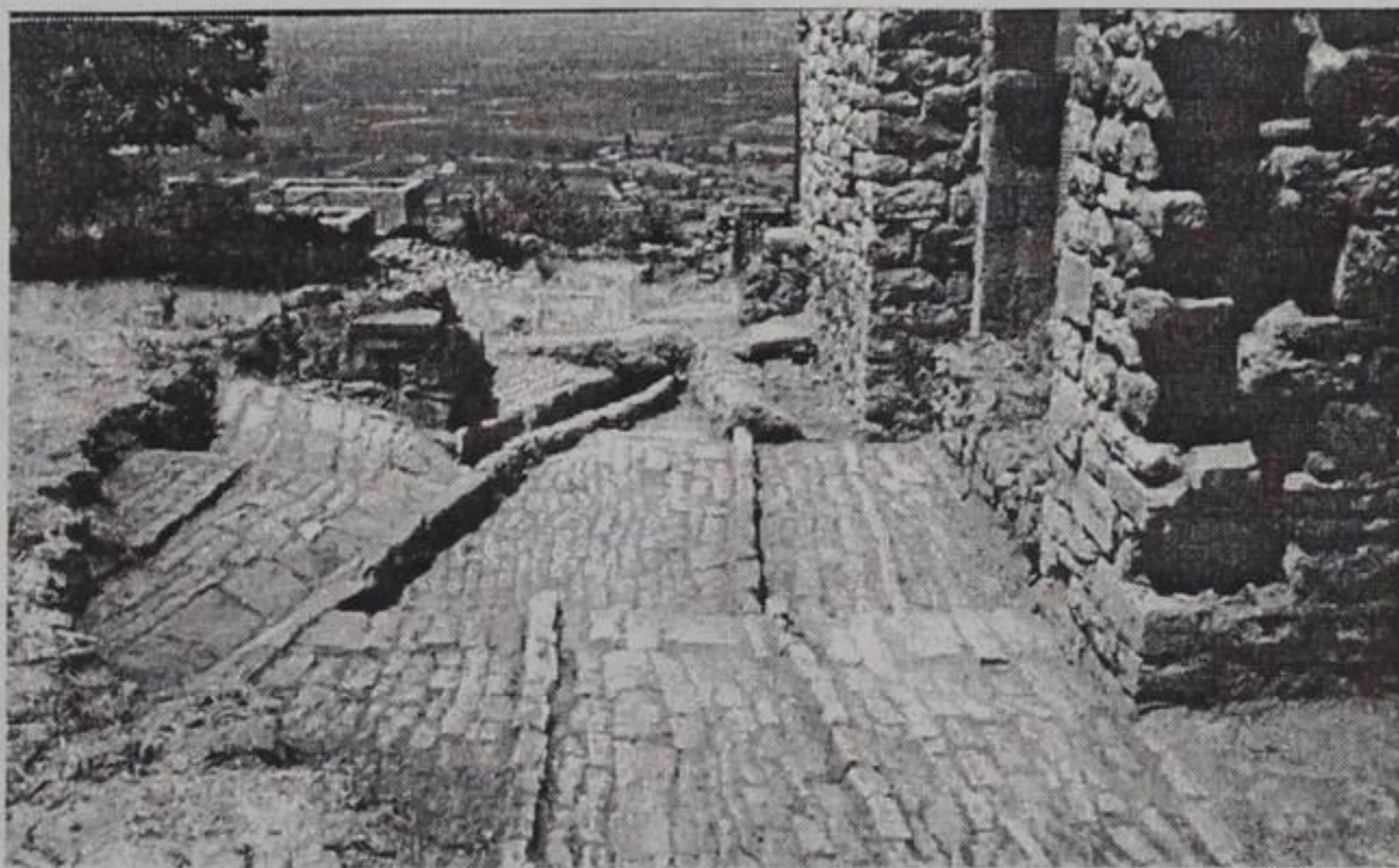
Καλντερίμι στην οικία Χάμκως.

Η πρόσφατη ανασκαφική έρευνα, σύμφωνα με τις υπεύθυνες αρχαιολόγους της ανασκαφής έδωσε θραύσματα αγγείων που μαρτυρούν την κατοίκηση του λόφου ήδη από την Ύστερη Χαλκοκρατία (12ος αι. π.Χ.).