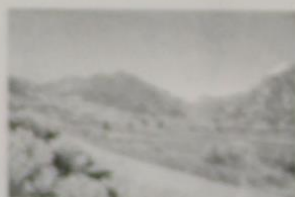
Φωτ. εξωφ. Σ.Τ. (Κόνιτσα)