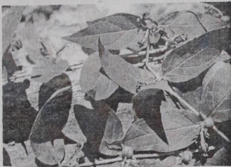
Ajuga piskoi & Bald. ( Lamiaceae )

- Cistus albanicus E.F. Warburg ( Cistaceae )