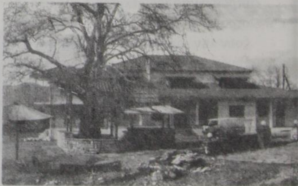
ΞΕΝΟΔΟΧΕΙΟ "Το Γεφύρι" Με 40 κλίνες, εστιατόριο, μπάρ, θέρμανση, πάρκι κλπ. Στην ειδυλλιακή τοποθεσία της γέφυρας Αώου στην Κόνιτσα. Τηλ. 0655-2378