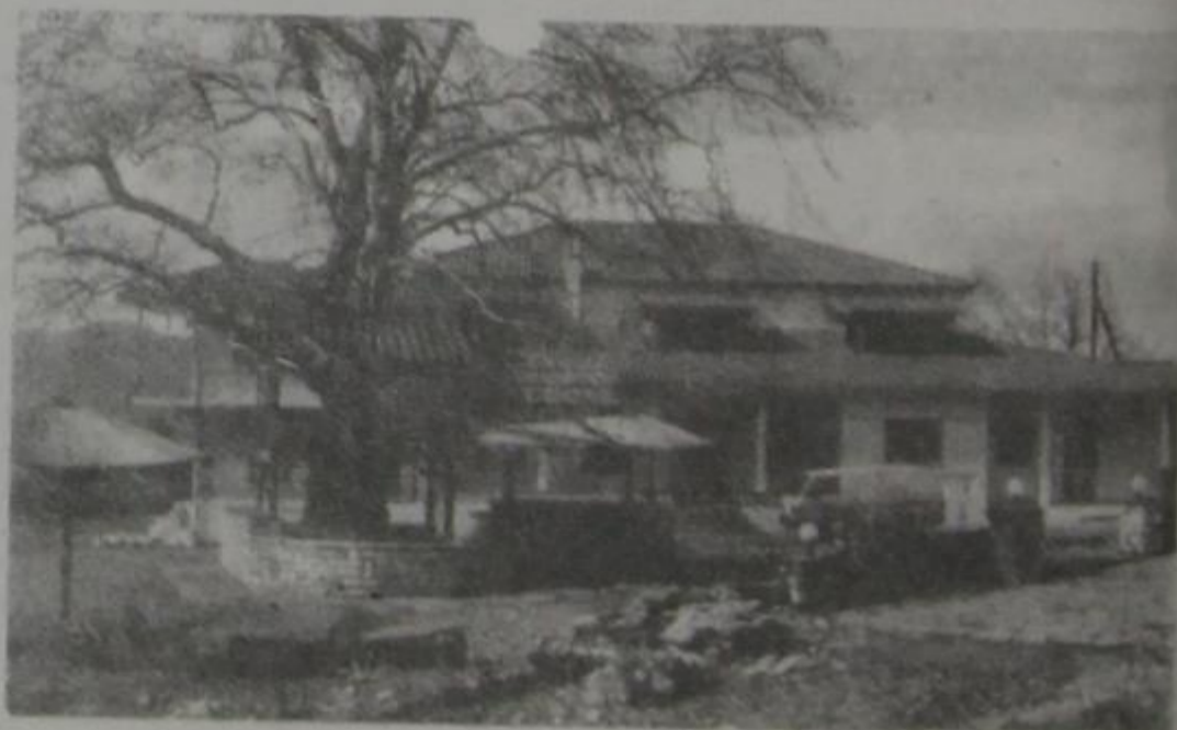
ΞΕΝΟΔΟΧΕΙΟ "Το Γεφύρι" Με 40 κλίνες, εστιατόριο, μπάρ, θέρμανση, πάρκινγκ κλπ. Στην ειδυλλιακή τοποθεσία της γέφυρας Αιού στην Κόνιτσα. Τηλ. 0655-23780