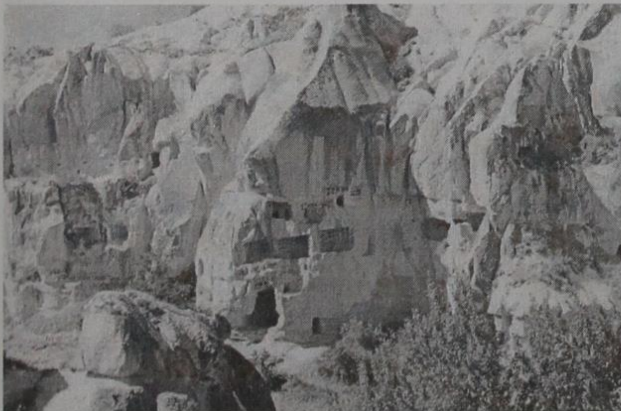
ΚΩΡΑΜΑ - Εκκλησίες λαξευτές μέσα στα βράχια

Ξημερώνοντας η 3 Σεπτεμβρίου 1997 ξεκινήσαμε για την Καισάρεια, την πόλη του Αγίου Βασιλείου και ένα από τα μεγαλύτερα κέντρα της