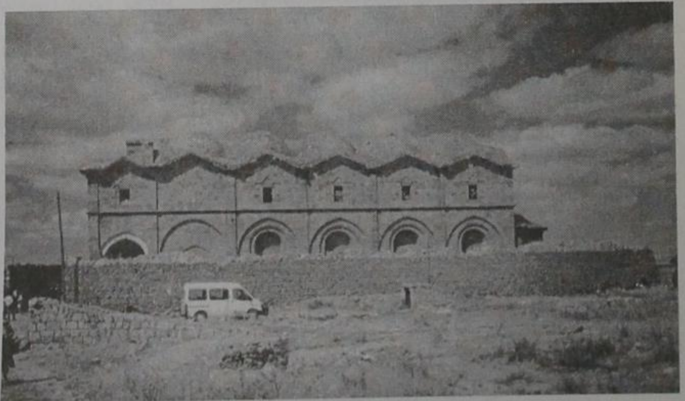
Η μεγαλοπρεπής εκκλησία του Αγίου Βασιλείου

Επιτέλους ένας γέροντας έφερε το κλειδί για να μπορέσουμε να μπούμε στο εσωτερικό του ναού. Ακούστηκε το άνοιγμα της κλειδαριάς και το τρίξιμο της πόρτας καθώς άνοιγε. Σαν μικρά παιδιά ξεχυθήκαμε στο εσωτερικό του ναού. Το πάτωμα ήταν στρωμένο με με-