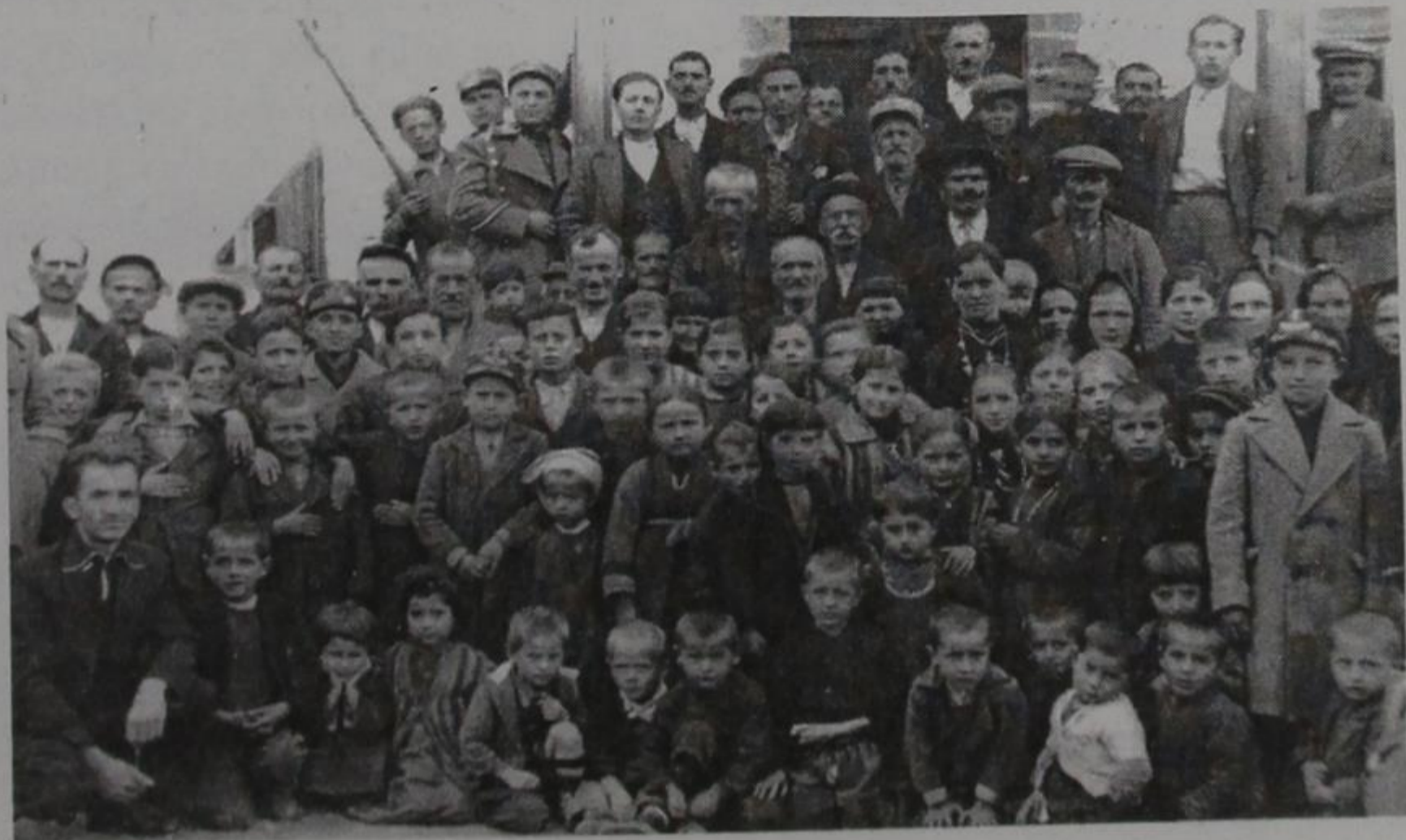
Αγ. Βαρβάρα (Πλάβαλη) 1938-39

Οι δυνατές φωνές των παιδιών ενοχλούσαν κάποτε τους μεγάλους που ήταν μαζεμένοι στα σκαλιά της εκκλησίας μόλις σουρούπωνε και συζητούσαν τα προβλήματα του χωριού. Τις περισσότερες φορές η συζήτηση γινόταν πολύ ζωηρή, και κατέληγε σε καυγά. Όμως την επομένη είχε ξεχαστεί ο καυγάς, κι η βουλή του χωριού είχε κα-