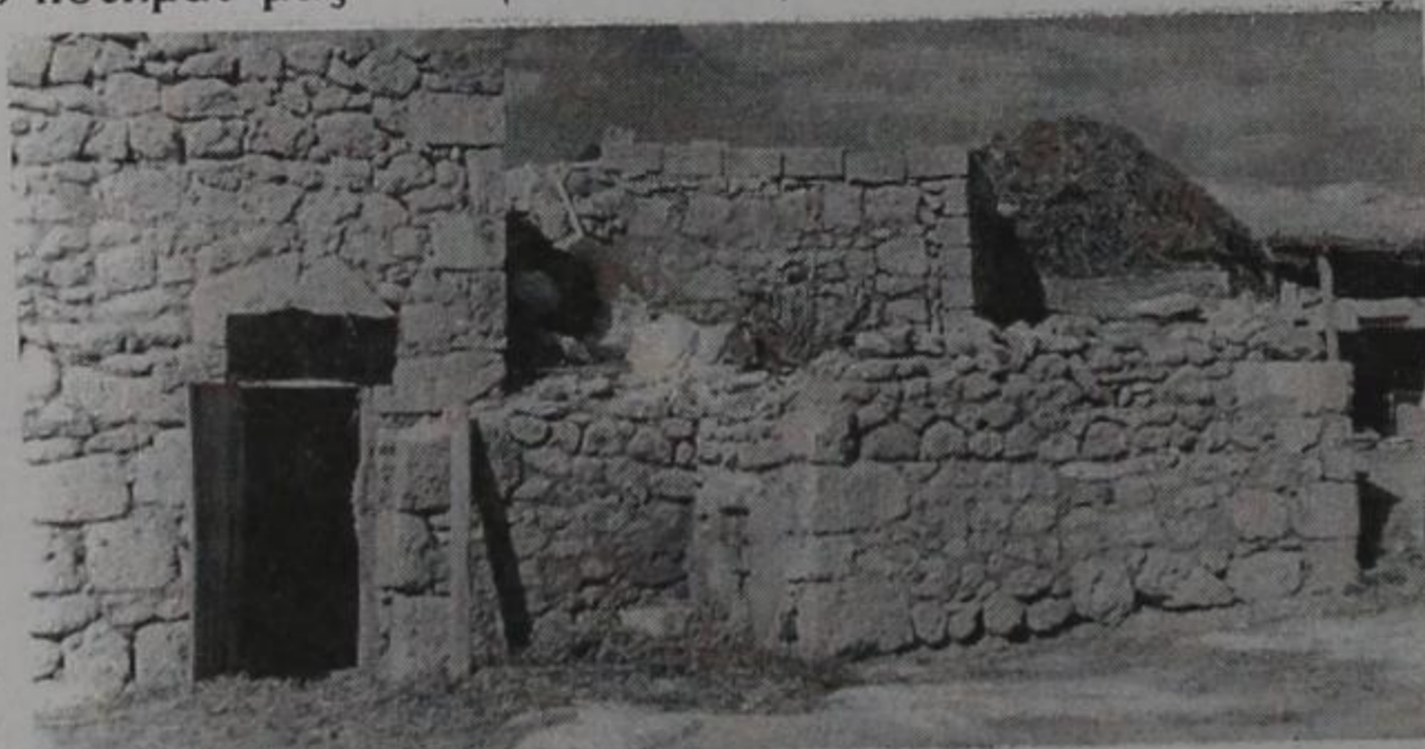
Πόρτες υπογείων σπιτιών στο Μιστί.