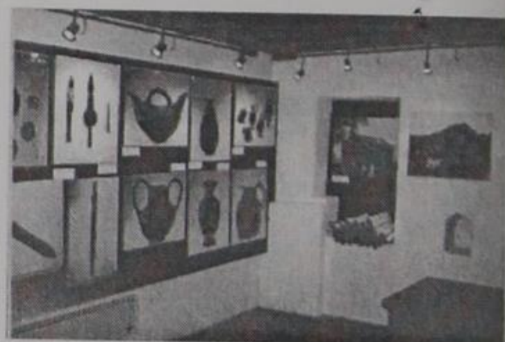
Φωτ. εξωφ. φωτογραφική έκθεση μνημείων στην Κόνιτσα