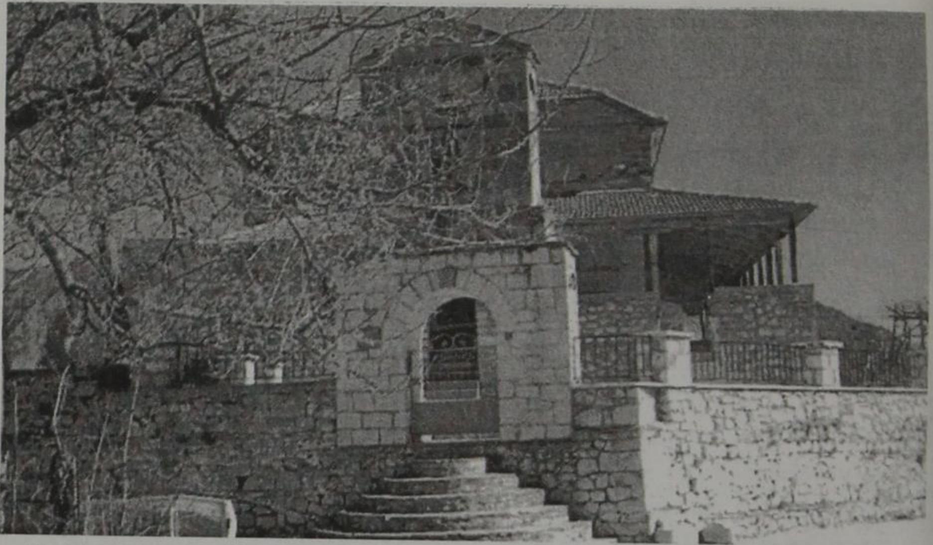
Αγ. Νικόλαος (Πλάβαλη)

νούργια θέματα και προβλήματα να λύσει τώρα όπως δείχνει η φωτογραφία τα σκαλοπάτια ερήμωσαν. Όλοι φύγαμε και μόνο το καλοκαίρι ζωντανεύει για λίγο με την επίσκεψη των χωριανών. Ήταν πολύ δύστυχα τα χρόνια τότε, αυτό είναι αλήθεια. Μας έλειπαν τα