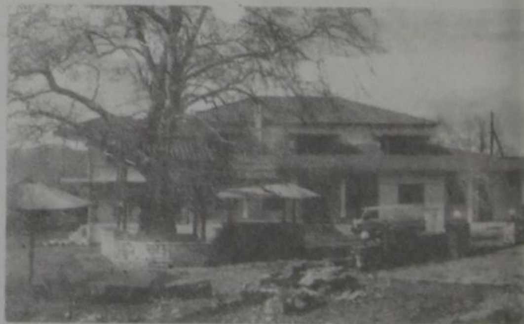
ΞΕΝΟΔΟΧΕΙΟ "Το Γεφύρι" Με 40 κλίνες, εστιατόριο, μπαρ, θέρμανση, παρκινγκ κλπ. Στην ειδυλλιακή τοποθεσία της γεφυρας Αωρου στην Κόνιτσα. Τηλ. 0655-23780