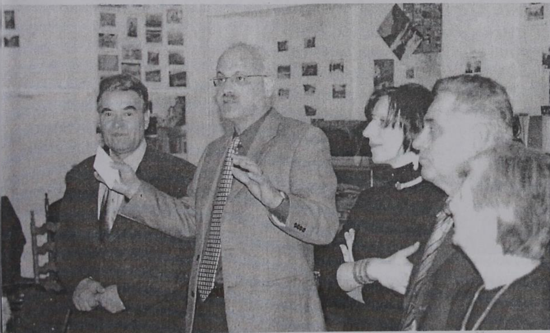
Το Δ.Σ. της Ένωσης.