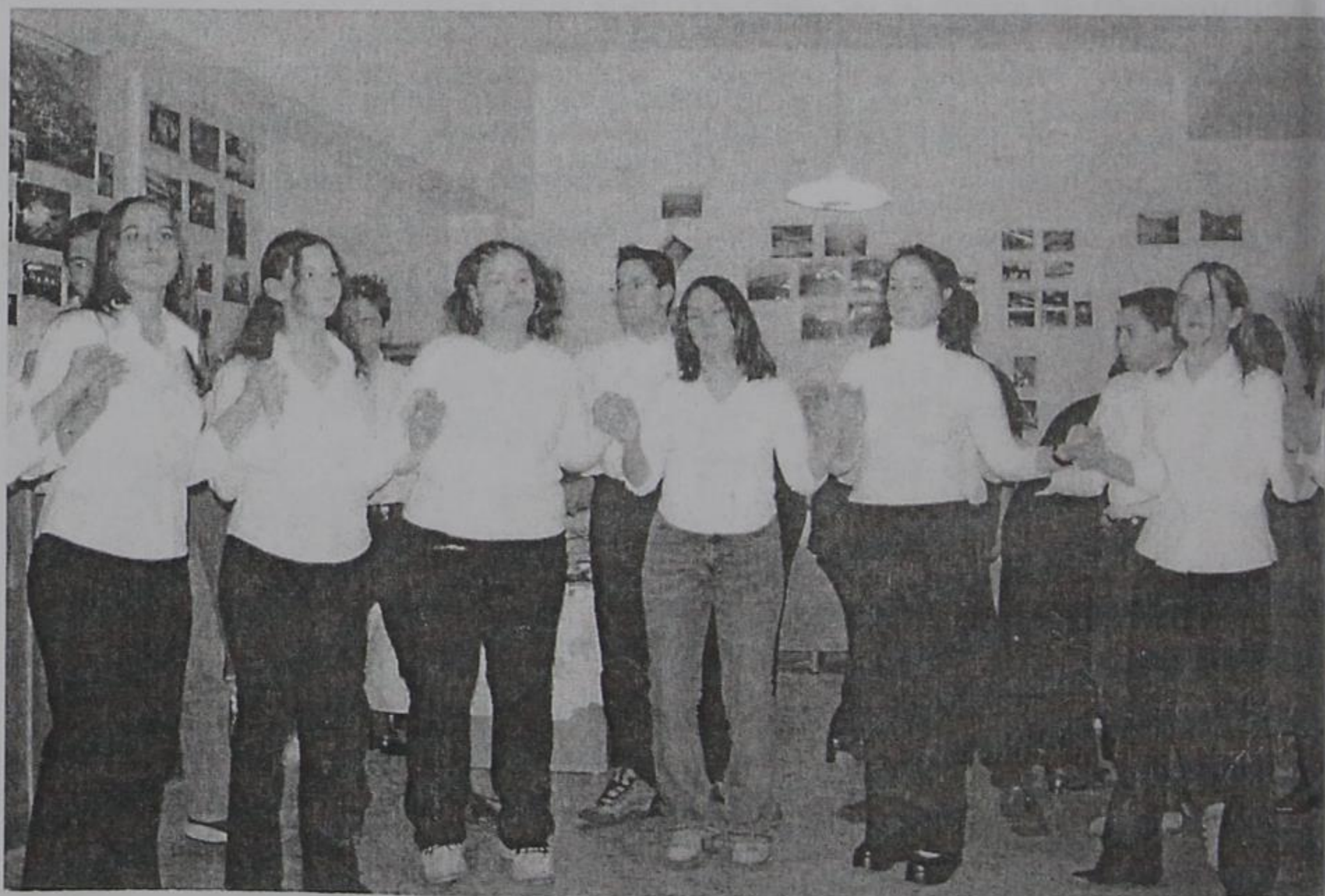
Το χορευτικό της Ένωσης

Το χορευτικό της ένωσης συμμετείχε στην εκδήλωση "Η πίτα του Ηπειρώτη" που πραγματοποιήθηκε στο τέλος Γενάρη στο Στάδιο Ειρήνης και Φιλίας, με λεωφορείο που παραχώρησε δωρεάν ο Δήμαρχος Κόνιτσας και τα λοιπά έξοδα διαμονής διατροφής κλπ. καλύφθηκαν από το ταμείο της ένωσης.