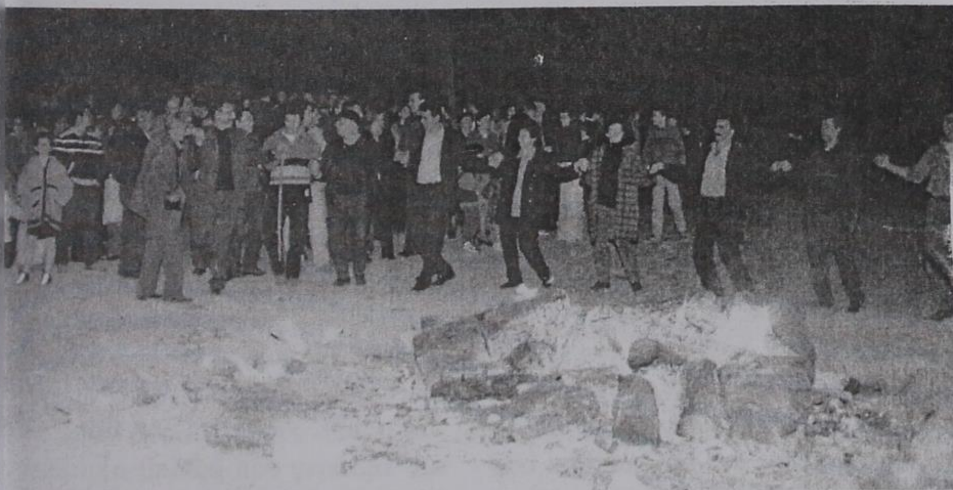
Από τις αποκριάτικες εκδηλώσεις.

6. Κοπή βασιλόπιτας με την παρουσία του βουλευτή κ. Κων. Τασούλα,