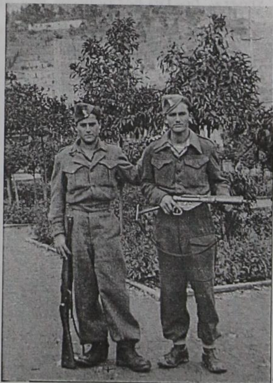
Στο Γ.Σ. του Ε.Λ.Α.Σ. 4-12-1944.