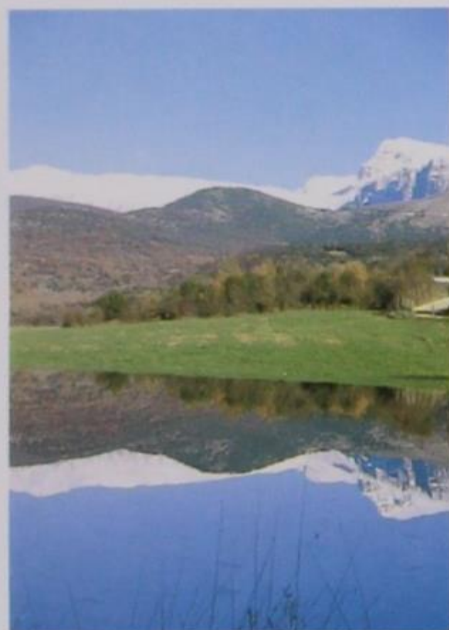
3. Ορεινή λίμνη

κτηρίζεται από την βαθμιαία ελλάτωση της θερμοκρασίας, που ξεκινάει από τις κοιλάδες και ανεβαίνει προς τις κορυφές τους. Μια θερμοκρασιακή και υγρασιακή αναστροφή δημιουργείται κατά τις πρώτες πρωινές ώρες της ημέρας ή όταν υπάρχει σχετική νέφωση. Τότε, η θερμοκρασία και η υγρασία είναι πιο χαμηλές στις κοιλάδες παρά στις κορυφές ή στις πλαγιές των βουνών. Το φαινόμενο παρατηρείται ειδικότερα στον Εθνικό Δρυμό της Πίνδου, όπου τα ψυχρόβια κωνοφόρα δέντρα εμφανίζονται στη χαμηλότερη ζώνη 3 , δηλαδή κατά μήκος των κοιλάδων της «Βάλια Κάλντα» και του «Αρκουδορέματος».