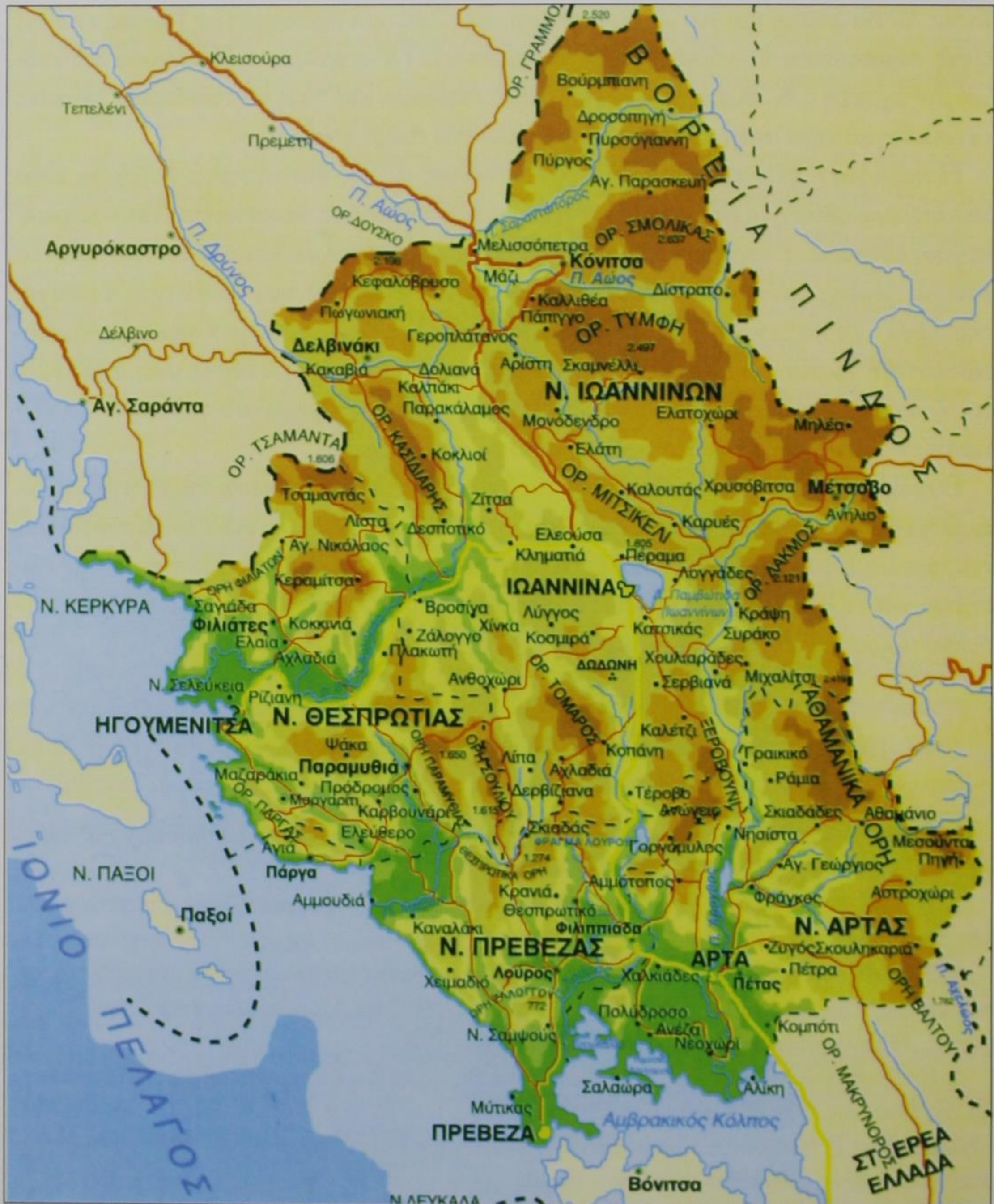
1. Γεωφυσικός χάρτης της Ηπείρου

(Παγκόσμιος Γεωγραφικός ΑΤΛΑΣ με ειδικό αφιέρωμα στην Ελλάδα, ΜΑΛΛΙΑΡΗΣ Παιδεία, 1998)