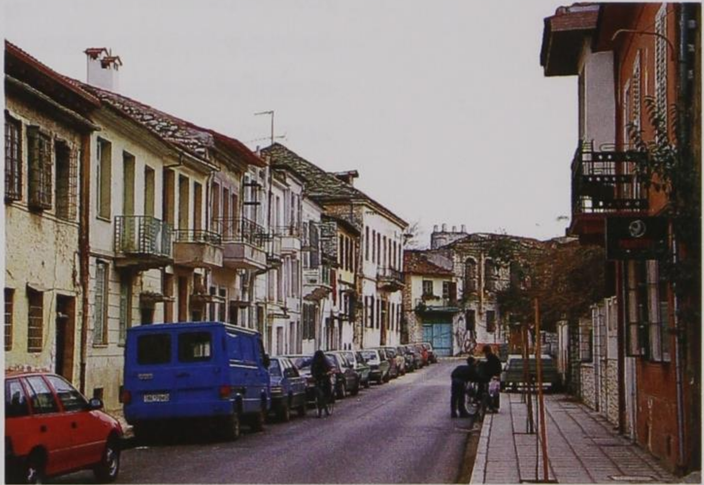
9. Δρόμος στην πόλη

Στον αγροτικό χώρο, οι γεωγραφικές - ιστορικές - πολιτισμικές ενότητες επικεντρώνονται σ' έναν ή περισσότερους μεγαλύτερους σε πληθυσμό οικισμούς, τα κεφαλοχώρια. Αυτά με τη σειρά τους συνδέονται οργανικά με τα εμπορικά - οικονομικά - διοικητικά κέντρα της μικροπεριοχής τους. Η πόλη των Ιωαννίνων διαδραματίζει το ρόλο της περιφερειακής πρωτεύουσας ή καλύτερα αποτελεί το μεγάλο πολιτικό, διοικητικό, οικονομικό, εμπορικό, τεχνικό και πολιτισμικό κέντρο της ευρύτερης περιοχής της Ηπείρου. Την εποχή της ακμής των Ιωαννίνων έπρεπε κανείς να βγει από τα γεωγραφικά όρια