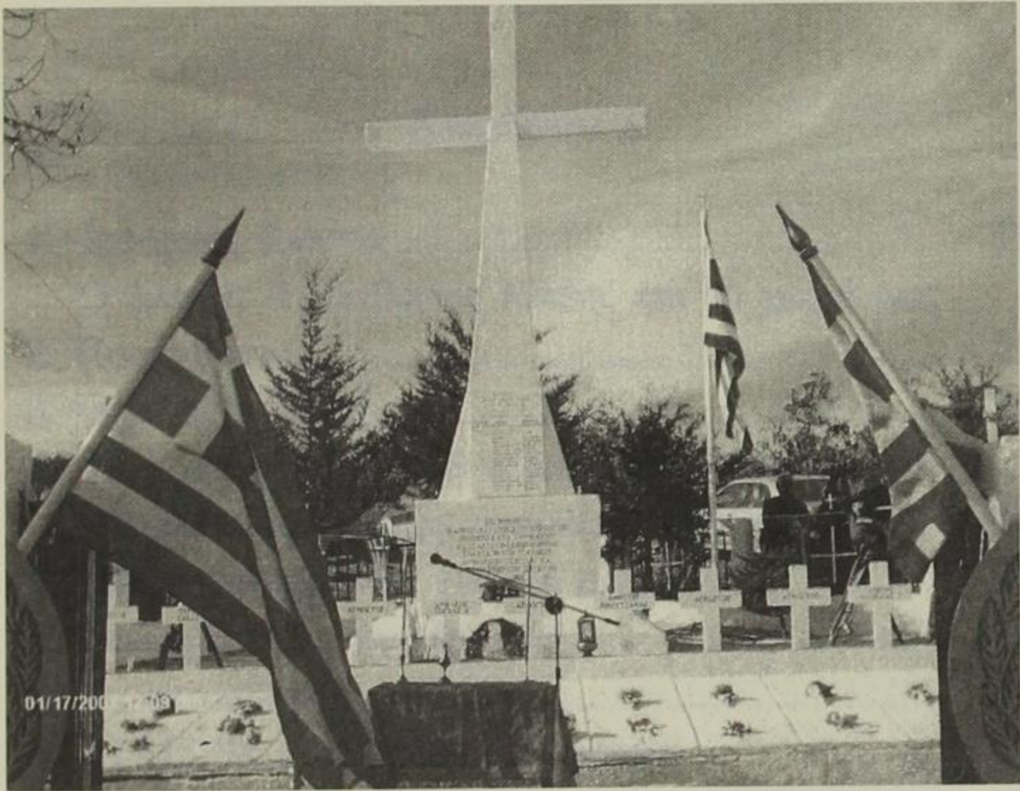
Το μνημείο των πεσόντων του 1940 (18/11/1940) Στη βίγλα Γεροπλατάνου