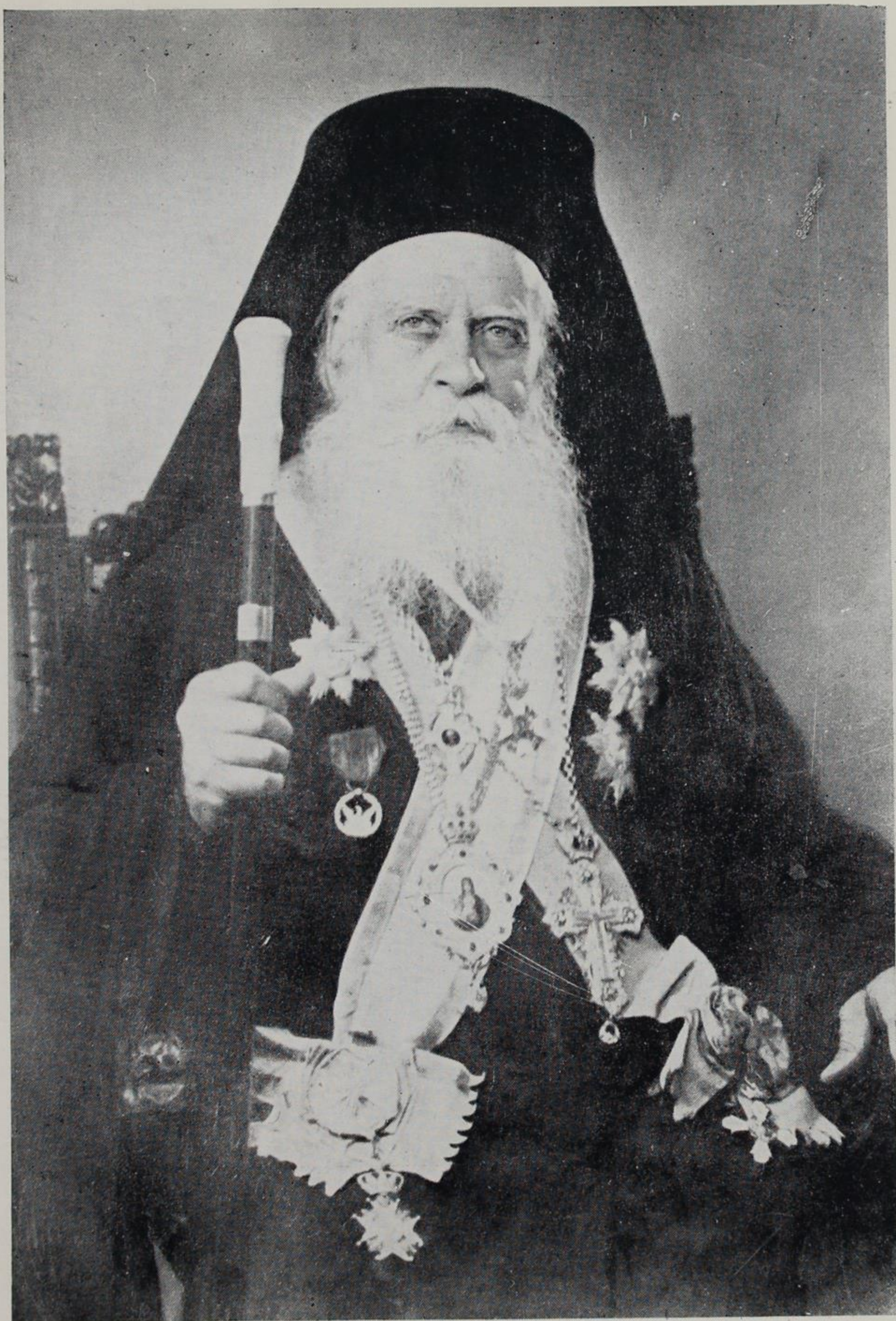
Ο ΣΕΒΑΣΜΙΩΤΑΤΟΣ ΜΗΤΡΟΠΟΛΙΤΗΣ ΜΥΤΙΛΗΝΗΣ ΙΑΚΩΒΟΣ (ΚΑΤΑ ΤΕΛΕΥΤΑΙΑΝ ΦΩΤΟΓΡΑΦΙΑΝ)