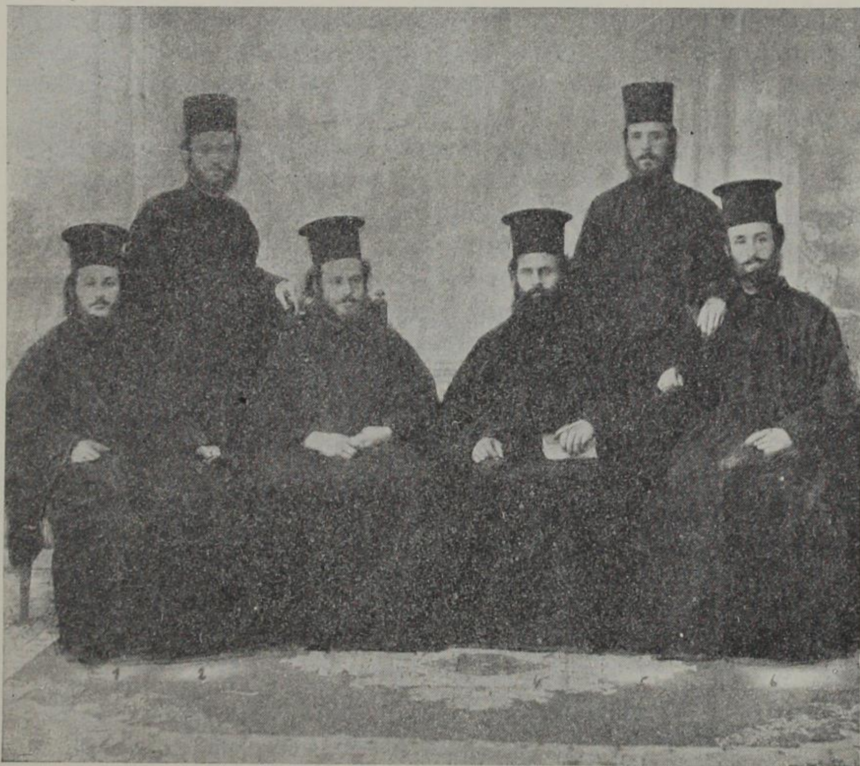
Ο ΔΙΑΚΟΝΟΣ ΙΑΚΩΒΟΣ ΩΣ ΦΟΙΤΗΤΗΣ ΕΙΣ ΤΗΝ ΧΑΛΚΗΝ

Εἰς τὴν περίπτωσιν τῆς ὡς ἄνω ἀσθενείας του, ὁ Μητροπολίτης Ἰάκωβος ἐπέδειξε τὸν ἴδιον ἥρωϊσμόν καὶ τὴν αὐτὴν ἀπαράλλακτον αἰσιοδοξίαν—διὰ τὴν καταπολέμησιν τῆς νόσου—μὲ τὸν ἀείμνηστον στρατηγὸν Ν. Πλαστήραν, ὁ ὁποῖος, εὐρεθεὶς εἰς τὸ τελευταῖον στάδιον τῆς φυματιώσεως τὸ 1923, κατώρθωσε μὲ τὴν ἰσχυράν του θέλησιν καὶ τὴν τρομερὰν αἰσιοδοξίαν του, ν' ἀποθεραπευθῆ καὶ νὰ