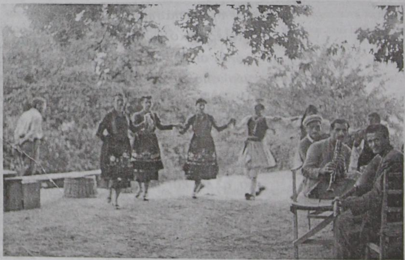
Παλαιоссέλλι 1964.