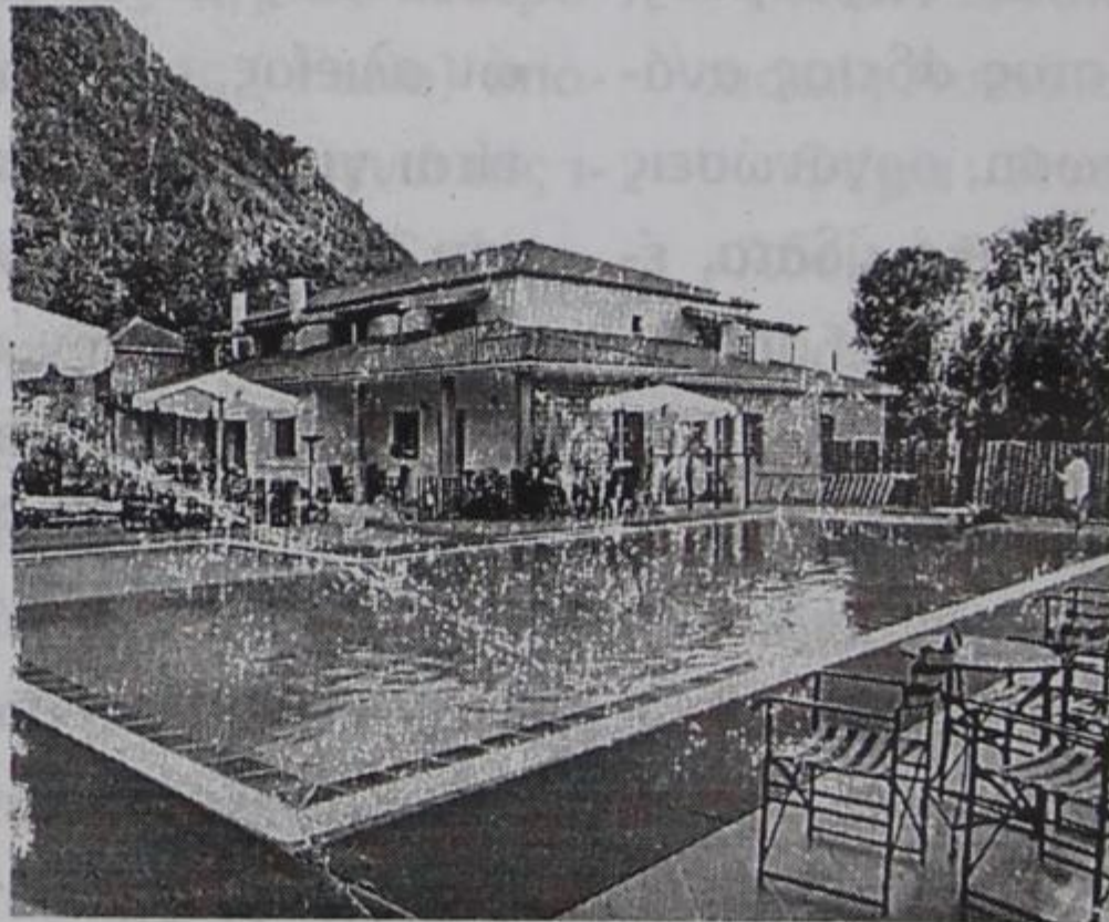
ΞΕΝΟΔΟΧΕΙΟ "Το Γεφύρι" Με 40 κλίνες, εστιατόριο, μπάρ, θέρμανση, πάρκιγκ κλπ. Στην ειδυλλιακή τοποθεσία της γέφυρας Αώου στην Κόνιτσα. Τηλ. 0655-23780