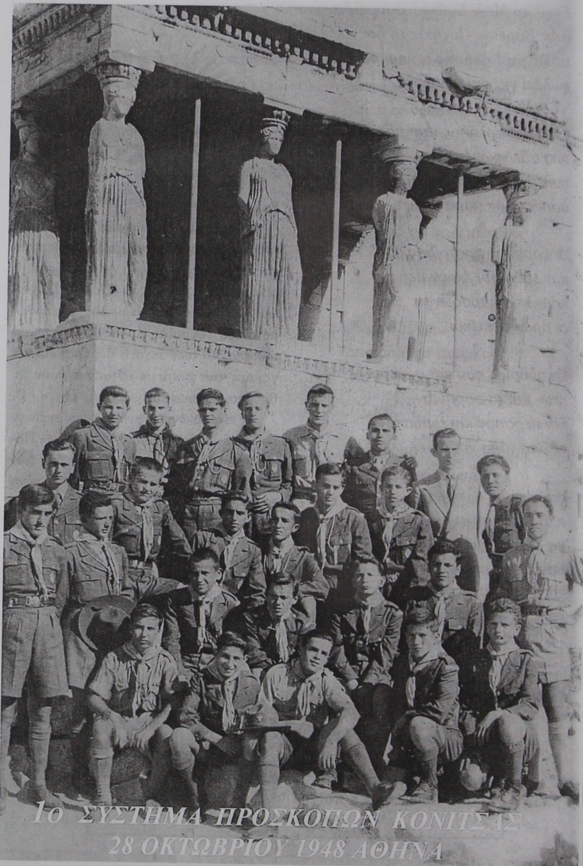
1ο ΣΥΣΤΗΜΑ ΠΡΟΣΚΟΠΩΝ ΚΟΝΙΤΣΑΣ 28 ΟΚΤΩΒΡΙΟΥ 1948 ΑΘΗΝΑ