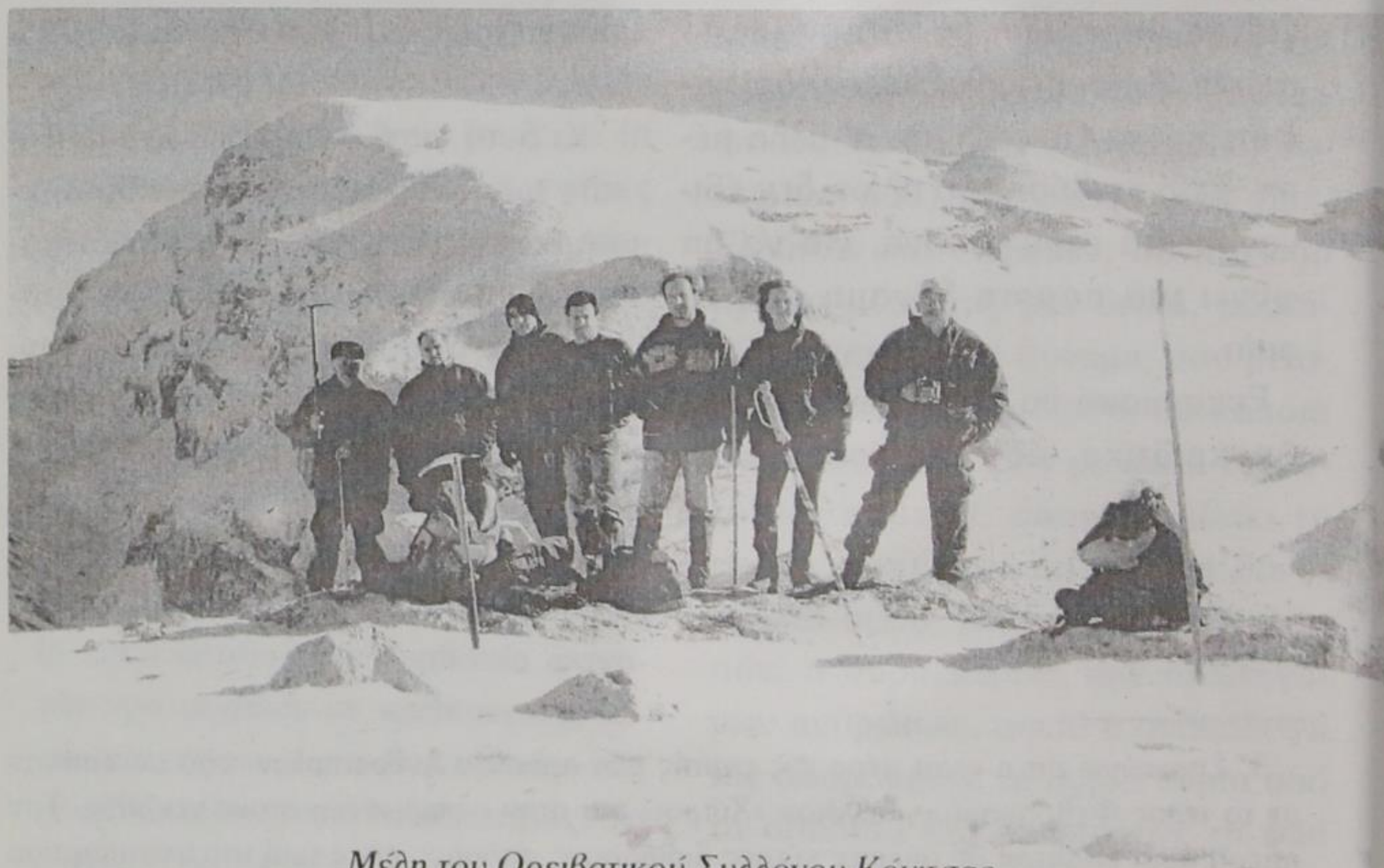
Μέλη του Ορειβατικού Συλλόγου Κόνιτσας