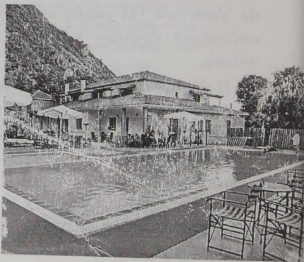
Ξενοδοχεῖο "Το Γεφύρι" Με 40 κλινές, εστιατόριο, μπάρ, θέρμανση, πάρκινγκ κλπ. Στὴν εἰδυλλιακὴ τοποθεσίᾳ τῆς γέφυρας Ἄφου στὴν Κόνιτσα. Τηλ. 0655-23780

Οικόπεδο 610 τ.μ. στην Α. Κόνιτσα (κοντὰ στη Μητρόπολη) Τηλ. 210 2758906