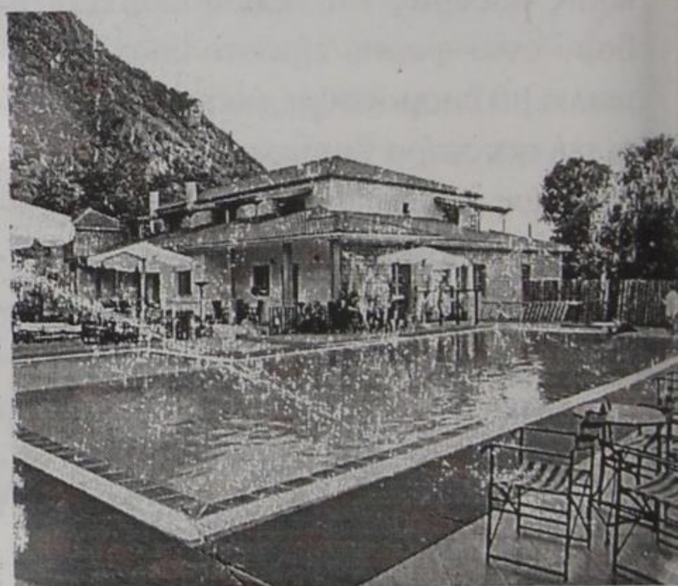
ΞΕΝΟΔΟΧΕΙΟ "Το Γεφύρι" Με 40 κλινές, εστιατοριο, μπαρ, θερμανση, πάρκινγκ. Στην ειδυλλιακή τοποθεσία της γεφυρας Αωου στην Κόνιτσα. Τηλ. 0655-23