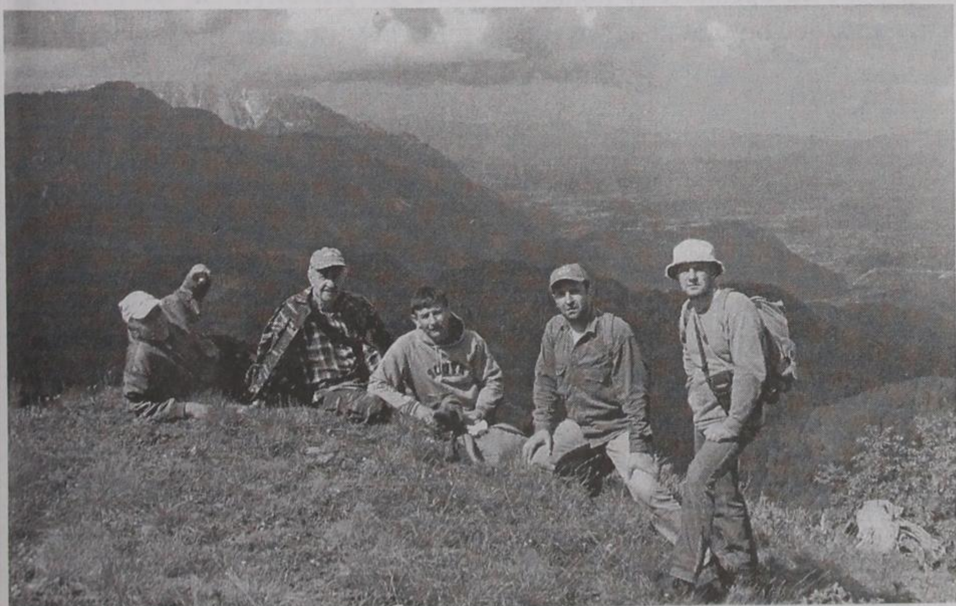
Κονιτσιώτες ορειβάτες στην κορυφή του Κλέφτη

Η θέα προς τα τέσσερα σημεία του ορίζοντα θαυμάσια. Ξανοίγονται μπροστά στα μάτια μας, η δαντελω-