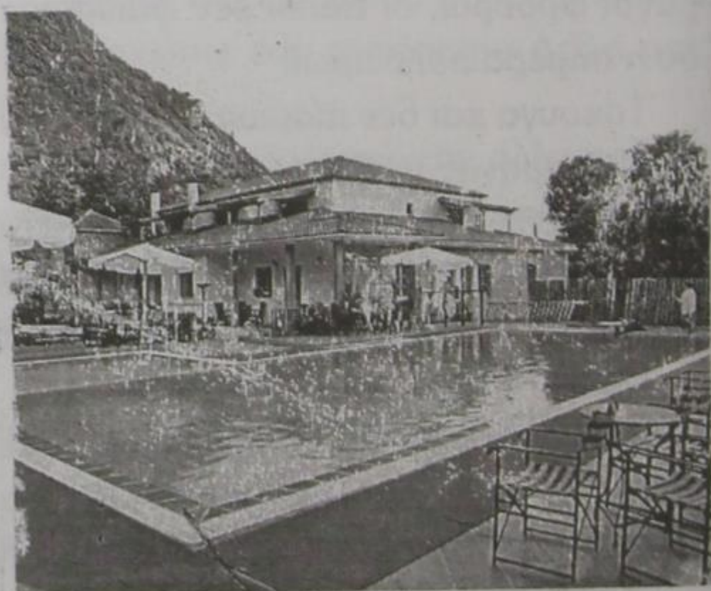
ΞΕΝΟΔΟΧΕΙΟ "Το Γεφύρι" Με 40 κλίνες, εστιατόριο, μπάρ, θέρμανση, πάρκινγκ κλπ. Στην ειδυλλιακή τοποθεσία της γέφυρας Αΐου στην Κόνιτσα. Τηλ. 0655-23780