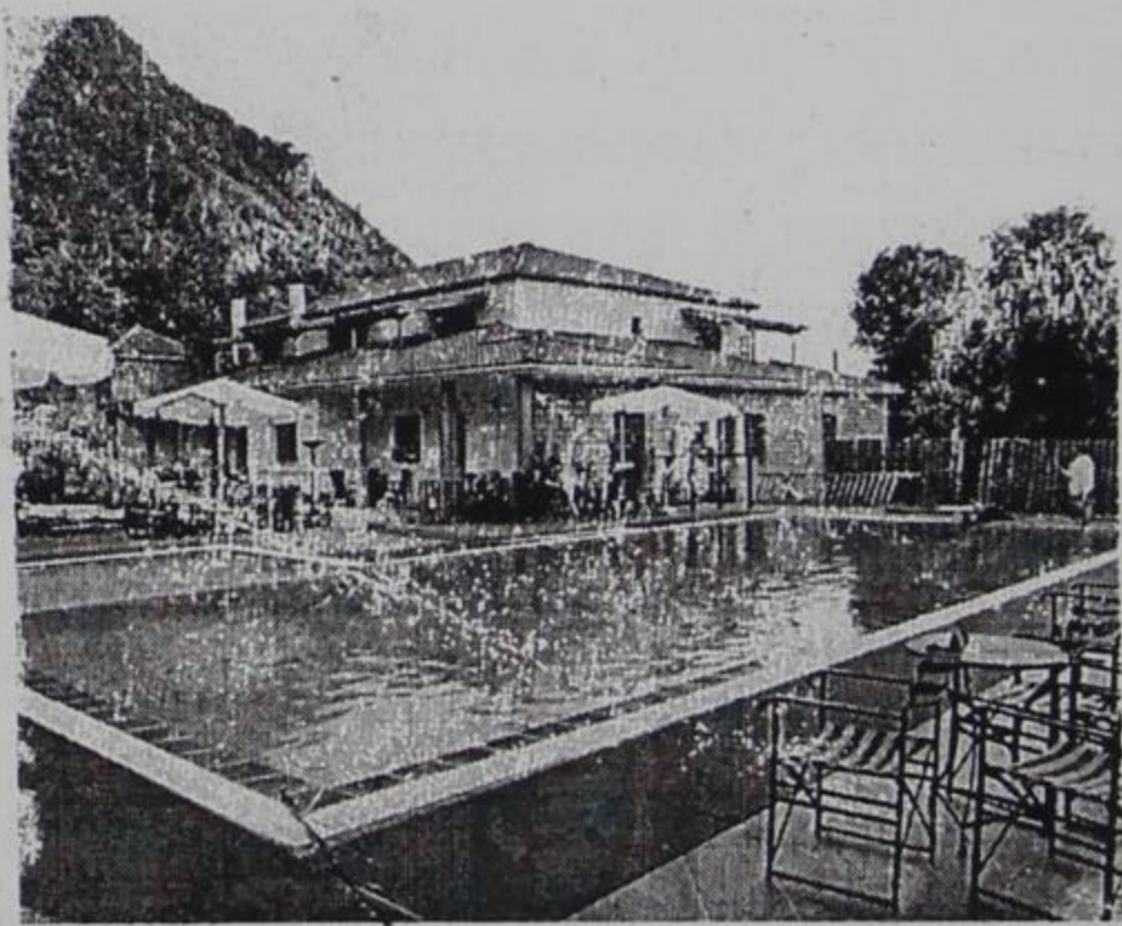
ΞΕΝΟΔΟΧΕΙΟ «Το Γεφύρι» Με 40 κλίνες, εστιατόριο, μπάρ, θέρμανση, πάρκιγκ, κ.λπ. Στην ειδυλλιακή τοποθεσία της γέφυρας Αώου στη Κόνιτσα Τηλ. 26550 23780

Το ίδιο βράδυ που θα' φευγα, την είδα να' ρχεται από μακριά, σαν σε όνειρο, με το φεγγάρι στην αγκαλιά της. Τα μαλλιά της, θημωνιά από άχυρο, της έκρυβαν το πρόσωπο. Στην κεντημένη της ποδιά κρατούσε καρύδια χλωρά και σούρβα, για να με πάρει, καθώς φαίνεται, με το καλό. Μου ζήτησε την αγάπη που της είχα, αλλά εγώ ήθελα να φύγω, γιατί ήμουν πολύ μικρός ακόμα και δεν είχα άλλη αγάπη φυλαγμένη στην καρδιά μου, πάρεξ της μάνας μου. -