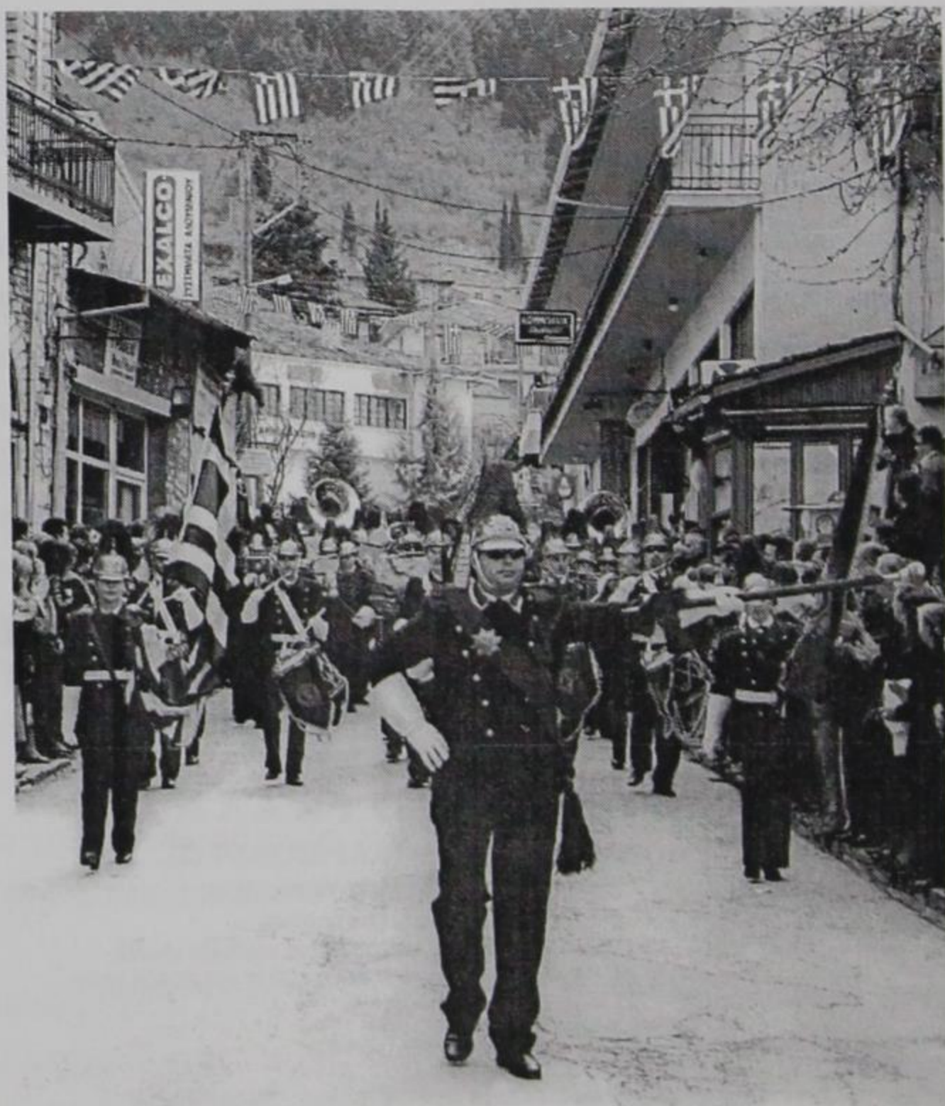
Παρέλαση στην Κόνιτσα 25 Μαρτίου 2006