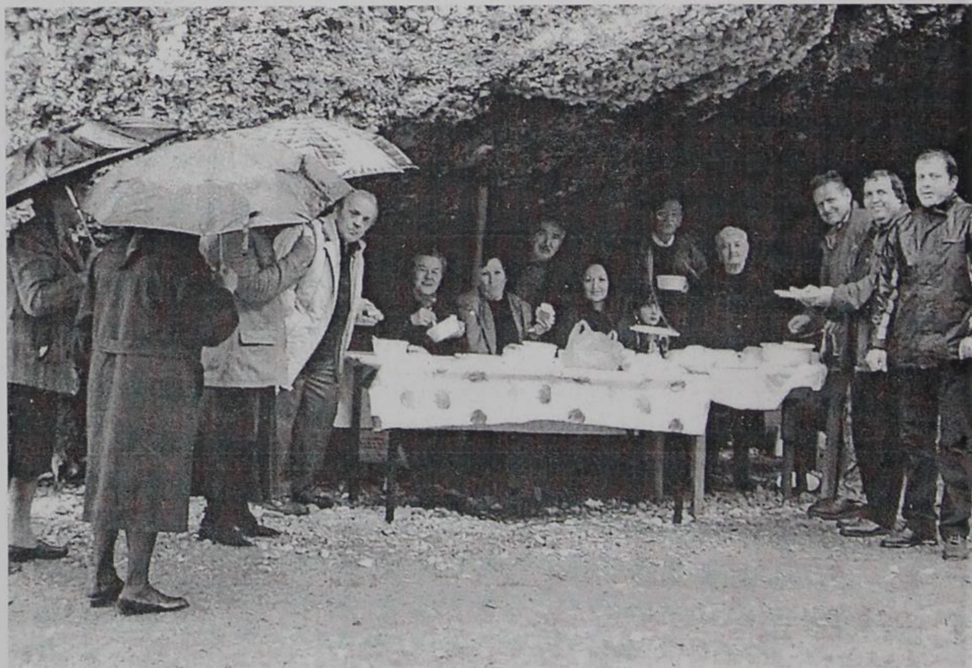
Αγία Βαρβάρα 2006.

ομπρέλα παραμάσχαλα και πλάι το αδιάβροχο, να αντιμετωπισθούν η βροχή και το κρύο, που έτυχε φέτος να τραβήξουν κάπως παραπάνω από ό,τι συνήθως, οδοιπορήσαμε το στενό αλλά βατό δρομάκι, στα κράσπεδα της πόλης κοντά στη δεξαμενή προς την Αγία Βαρβάρα. Από το σημείο εκείνο που αρχίζει το μονοπάτι αρχίζεις και ζεις τη μαγεία μιας διαδρομής που μόνο με ιερή μυσταγωγία μπορεί να συγκριθεί. Η υποβλητικότητα της φύσης είναι μογαδική γι' αυτόν που ανυποψίαστα οδηγείται στα τρίςβαθα των μυστικών της, όταν μάλιστα ενισχύεται και από τη θρησκευτική φόρτιση των ημερών λόγω νηστείας, τότε πράγματι