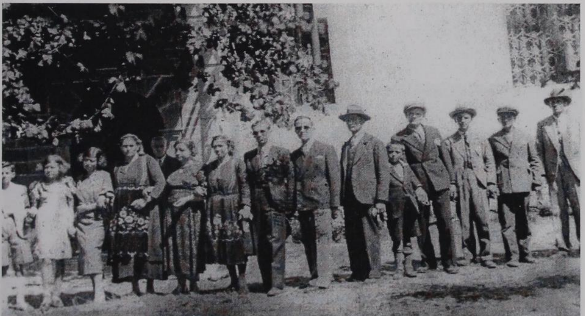
ΠΑΔΑΙΣ: 15 Αυγούστου το έτος 1937 ημέρα γιορτής της Κοιμήσεως Θεοτόκου και πανηγύρεως για το χωριό μας. Μπροστά στον Ιερό Ναό ο παραδοσιακός χορός, των παππούδων και πατεράδων που συνεχίζεται και σήμερα.