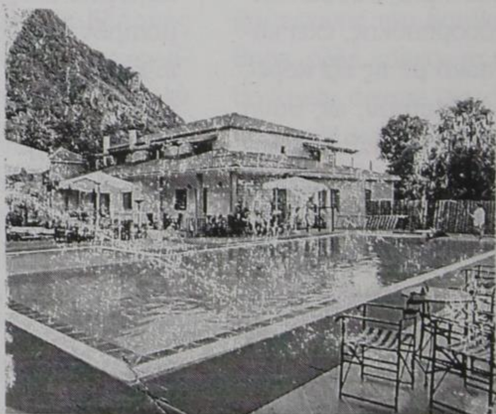
ΞΕΝΟΔΟΧΕΙΟ «Το Γεφύρι» Με 40 κλίνες, εστιατόριο, μπάρ, θέρμανση, πάρκιγκ, κ.λπ. Στην ειδυλλιακή τοποθεσία της γέφυρας Αώου στη Κόνιτσα Τηλ. 26550 23780